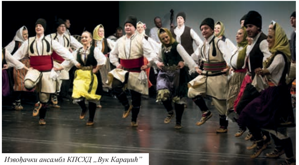
Извођачки ансамбл КПСХД „Вук Караџић”

„Култура, умјетност, обичаји, љепота и мудрости живота обликују традицију једног народа. Традиција је дјело људских радњи које се у времену креативно допуњавају и на тај начин развијају и трају кроз генерације. Велики број људи различитих година, велики број играча, пјевача и свирача оставио је трагове у нашем друштву...”. Овако почиње текст у брошури коју је СКПХД „Вук Караџић” из Радовљице штампало поводом Осмог годишњег концерта који је одржан 19. јануара 2020. у Позоришту Тонета Чуфара на Јесеницама.