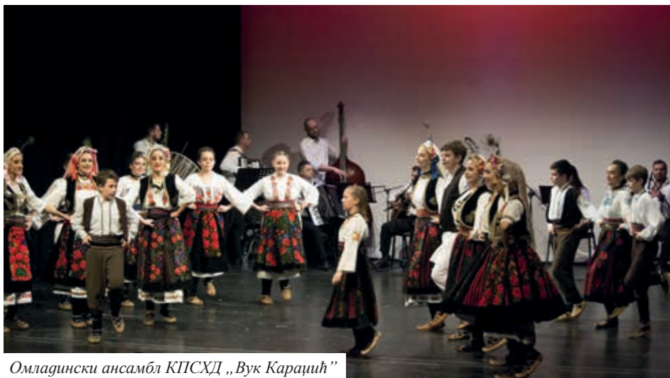
Омладински ансамбл КПСХД „Вук Караџић”