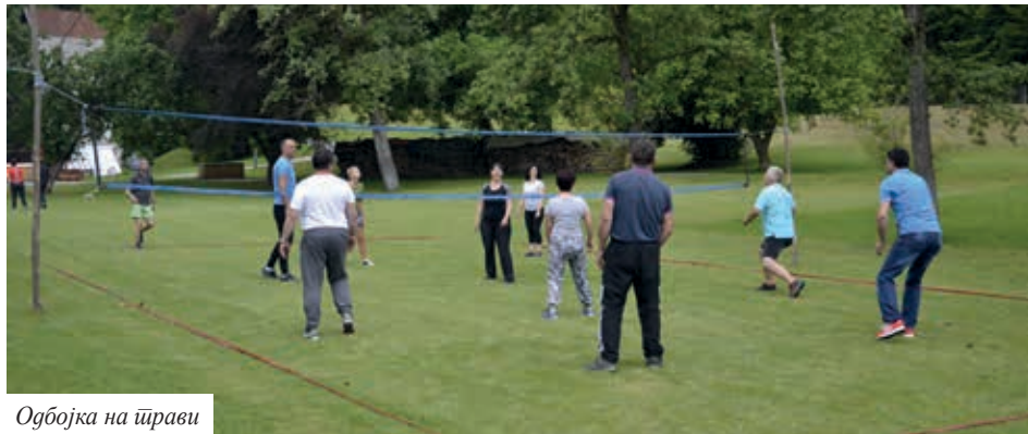
Одбојка на траву

пријатељство, дружење, сарадња и повјерење међу друштвима и члановима. За ту прилику, у веома отежаним условима, када нису могуће манифестације у затвореном простору, коришћење могућности на отвореном, веома су добро чланови прихватили уз добар одзив. Друштво је за ту прилику приредило и пикник, тако је дружење трајало до касно у ноћ. У условима пандемије, љетном и јесењем термину, могуће је организовати и известе манифестације, програме и пројекте.