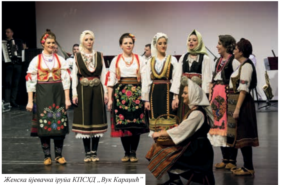
Женска пјевачка група КПСХД „Вук Караџић”

Опет су дошле на ред пјесме. Прво је Мушка пјевачка група отпјевала пјесму „Од мора ето сватова”, а Женска пјевачка група пјесму „Жао ми је материних двора”, да би након тога чланице Женске пјевачке групе