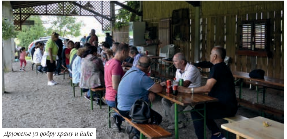
Дружење уз добру храну и пиће

Члановима је понуђен културни програм, гдје су књижевници рецитовали, а чланови „Театра Давид” изводили монодраму и монолог. Сусрету је присуствовало више од 150 посјетилаца, а организоване су и традиционалне спортске игре, где су учествовале мушке и женске екипе из друштва. Побједници су као награда