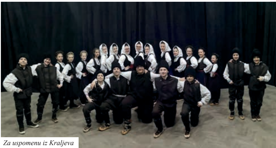
Za uspomenu iz Kraljeva