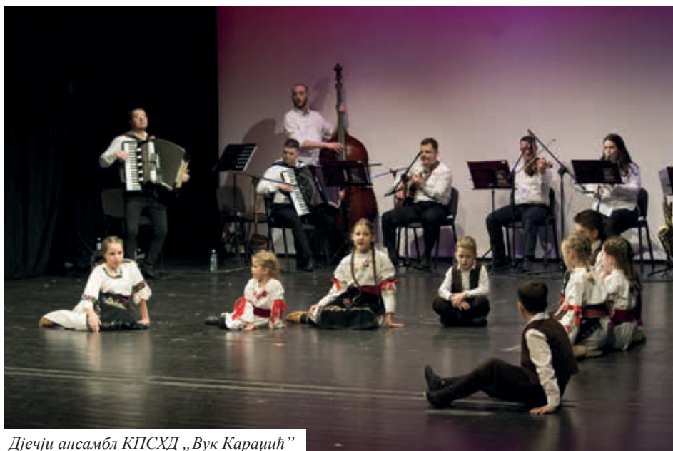
Дјечји ансамбл КПСХД „Вук Караџић”