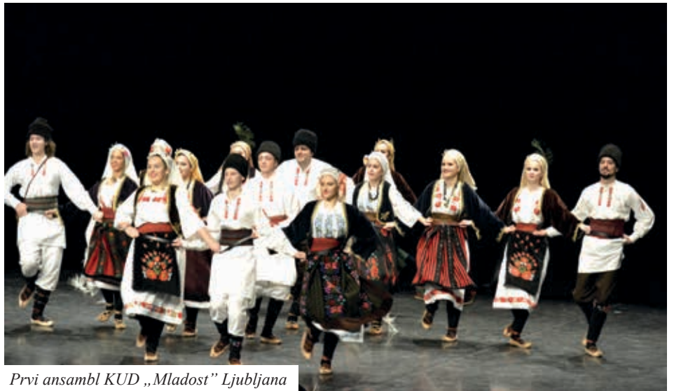
Prvi ansambl KUD „Mladost” Ljubljana