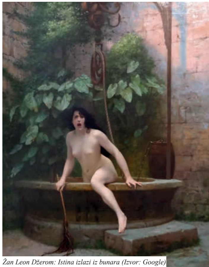
Žan Leon Džerom: Istina izlazi iz bunara