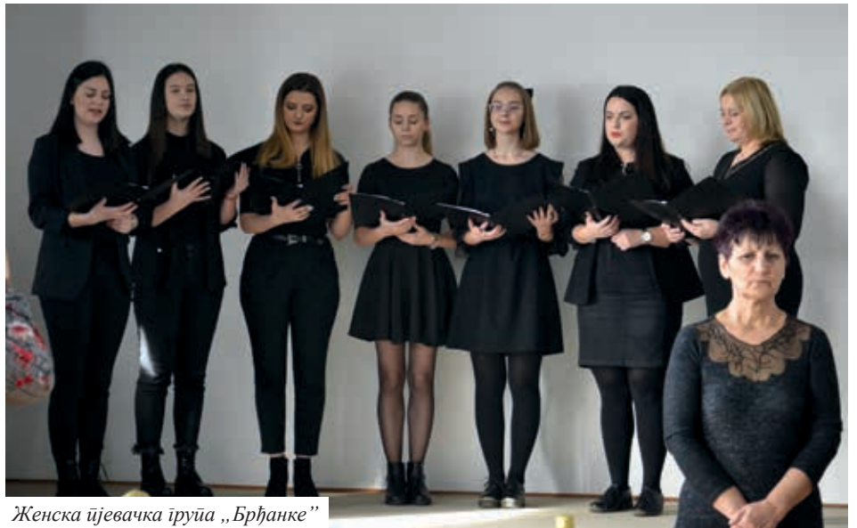
Женска ијевачка група „Брђанке”