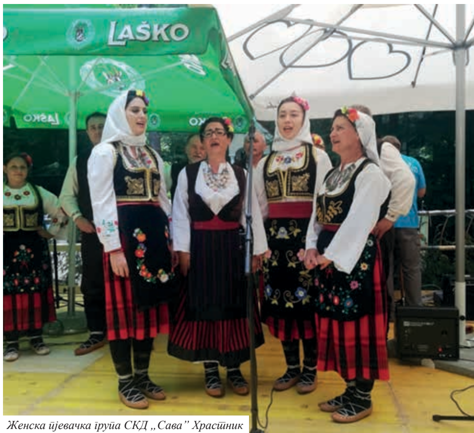
Женска пјевачка група СКД „Сава“ Храстник

Наше друштво се представило са пјевачком групом и традиционалним пјесмама,