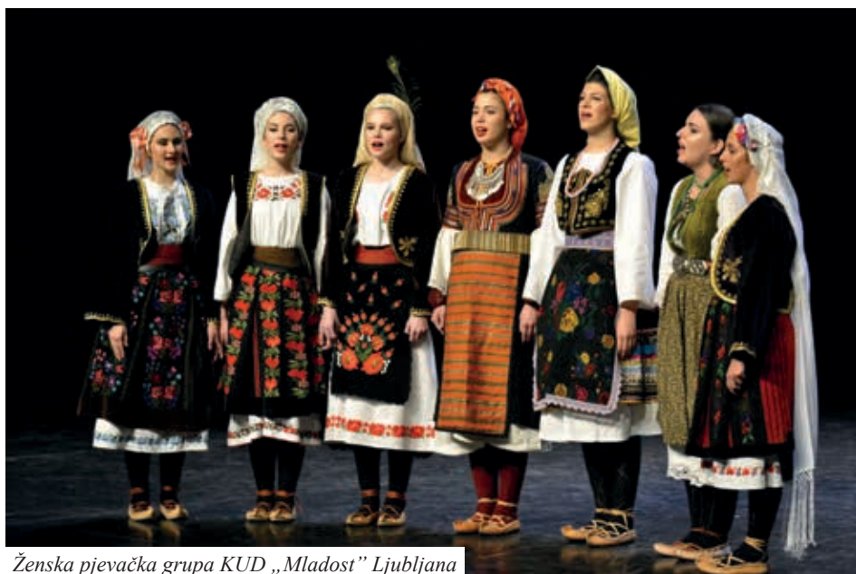
Ženska pjevačka grupa KUD „Mladost” Ljubljana