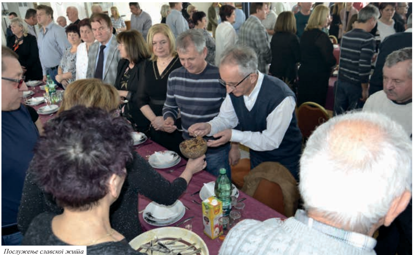
Послужење славској жињи