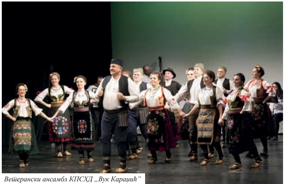
Ветерански ансамбл КПСХД „Вук Караџић”