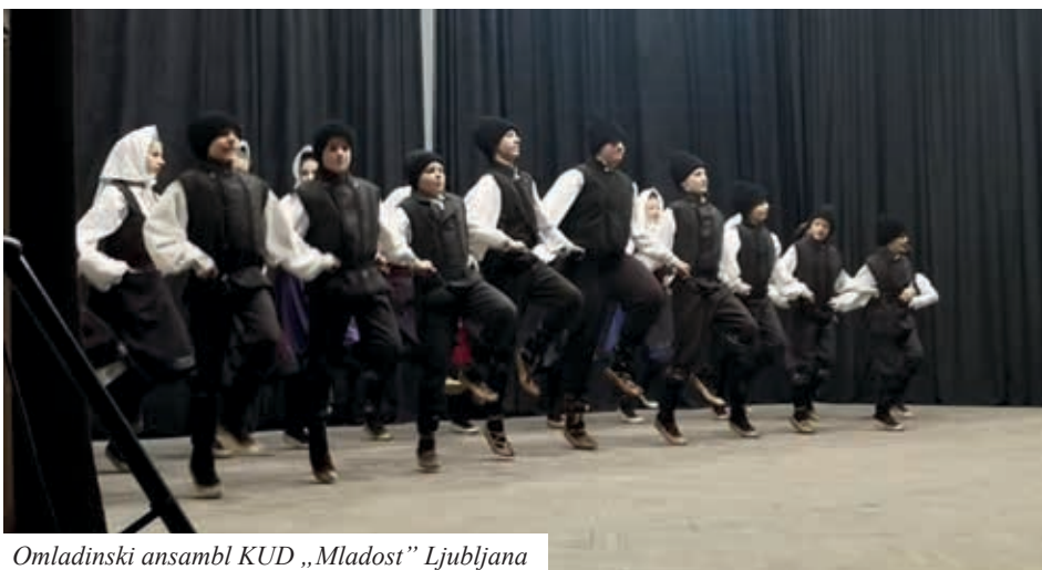
Omladinski ansambl KUD „Mladost” Ljubljana