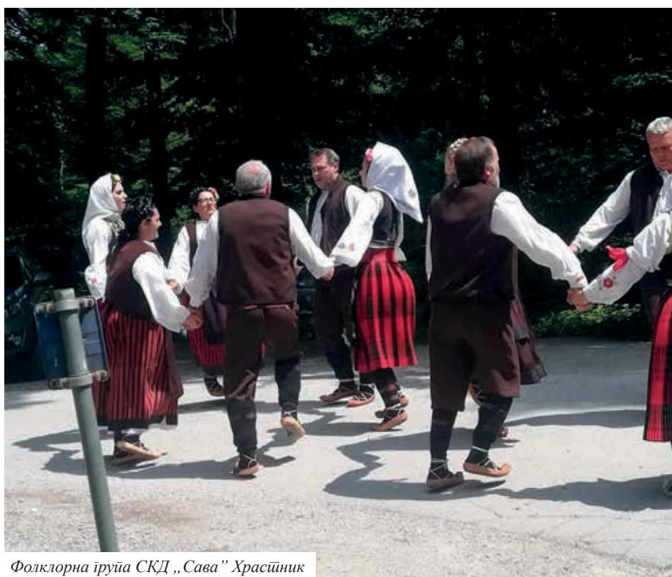
Фолклорна група СКД „Сава“ Храстник

фолклорна група са „Играма из Лесковца“, а на крају са бројном публиком и учесницима смо заиграли Ужичко коло, те после пријатно дружили са словеначким домаћинима, уз пиће и храну добрих домаћина.