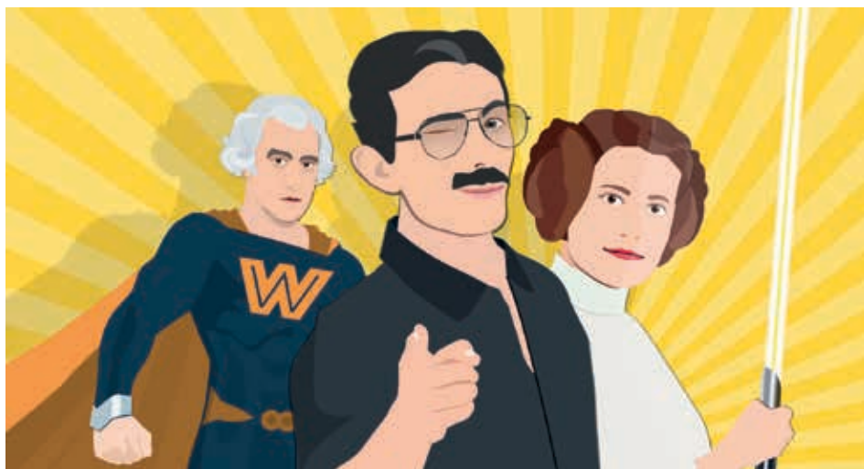
Džejs Vat (James Watt), Nikola Tesla, Henrijeta Svon Levit (Henrijeta Svon Levit)

Tako su nastali Eneja i Jure Varčun. Izmišljeno slovenačko prezime „Varčun“ bi na srpskom jeziku odgovaralo recimo prezimenu „Štedić“, ime Eneja je povezano