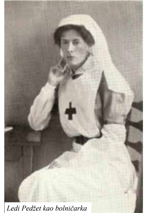
Ledi Pedžet kao bolničarka

Pismom joj je odgovorio regent Aleksandar Karađorđević, zahvaljujući joj što je o našim ranjenicima brinula kao rođena mati ili sestra,