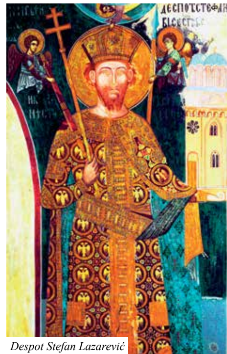
Despot Stefan Lazarević

Despot Stefan Lazarević je proglašen za sveca 500 godina posle svoje smrti.