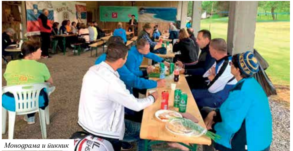
Монодрама и пикник

Малограђанска средина је учмала средина која на подноси разлике и веома тешко мијења своја учмала унапријед утврђена мјерила доброг понашања. У њој влада дво-