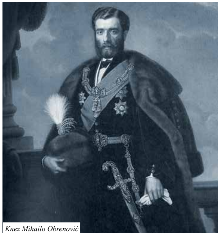
Knez Mihailo Obrenović

Kad su engleskog filozofa F. Bakona upitali, kada je najbolje oženiti se, odgovorio je: – Svako doba je dobro, jer kad si mlad, žena ti je ljubavnica, kad si sredovečan, ona ti je drugarica, a kad si star, ona ti je negovateljica.