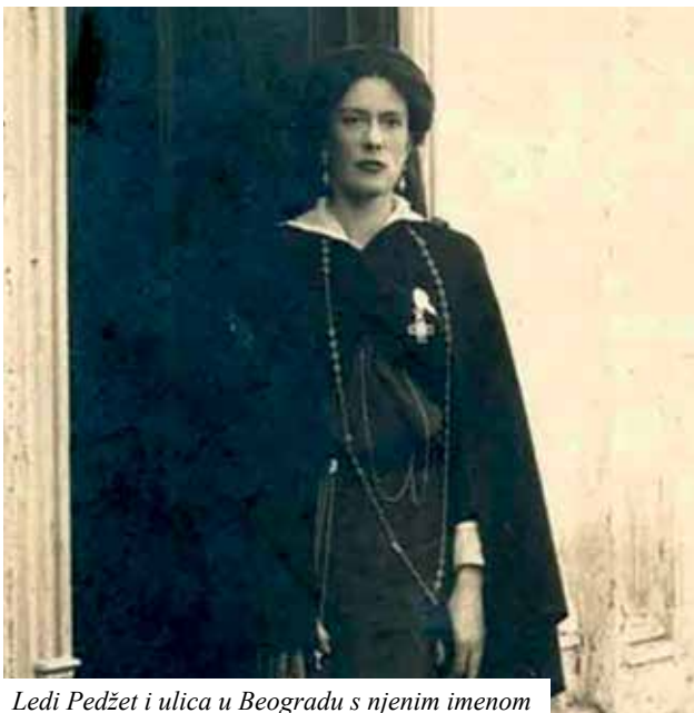
Ledi Pedžet i ulica u Beogradu s njenim imenom