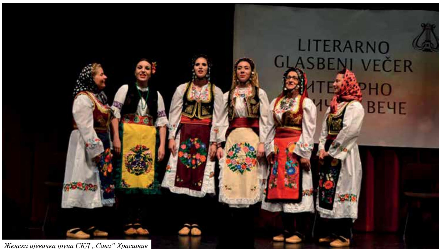
Женска пјевачка група СКД „Сава” Храстник