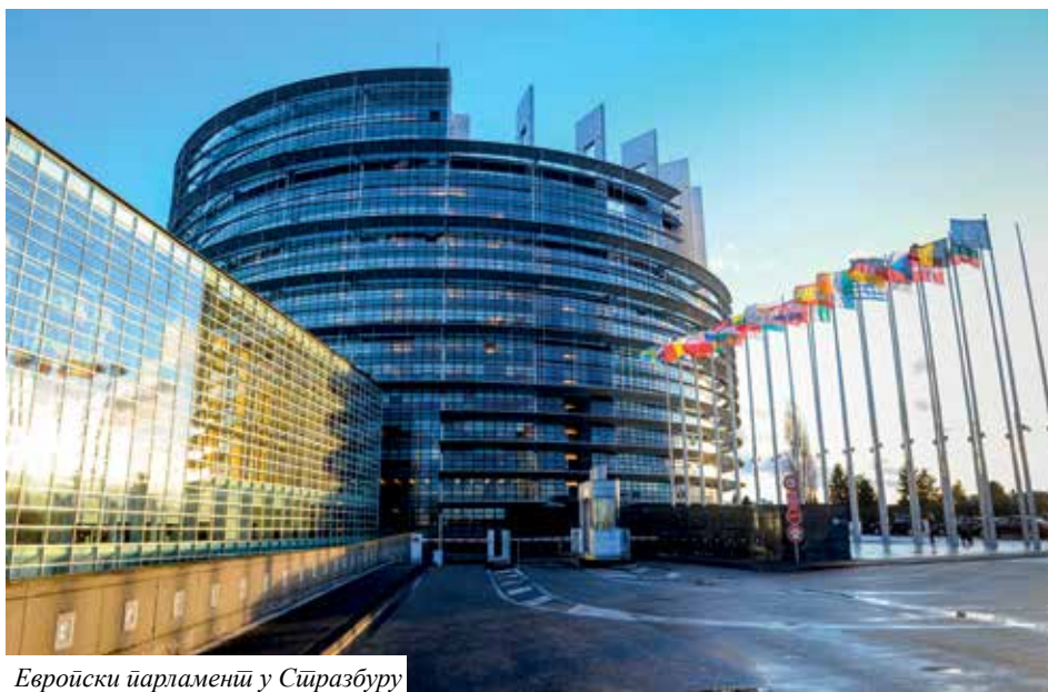
Европски парламенти у Стразбуру

(Са гоуишињем и блајословом аутора преузето из књије: Драјан Недељковић „Дијаспора и отаџбина”, Београд, 1994)