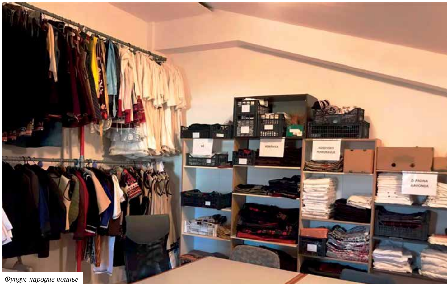
Фондус народне ношње

Текст: Данијел Серчић