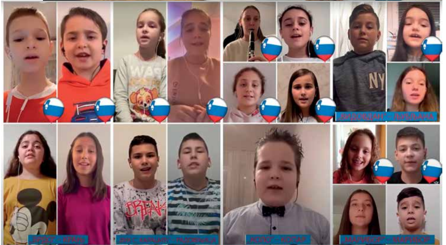
Деца су украс свећа - чланови друштвава из Словеније