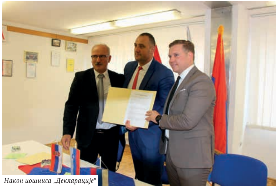
Након потписивања „Декларације”

Вујадиновић је похвалио прошлогодишњи велики успех Срба из Словеније, који су почели са школом српског језика и ћирилице по словеначким градовима, у којима се већ на почетку уписало 1.600 ученика свих година узраста. Тај успех Срба из Словеније су похвалиле Управа за са-