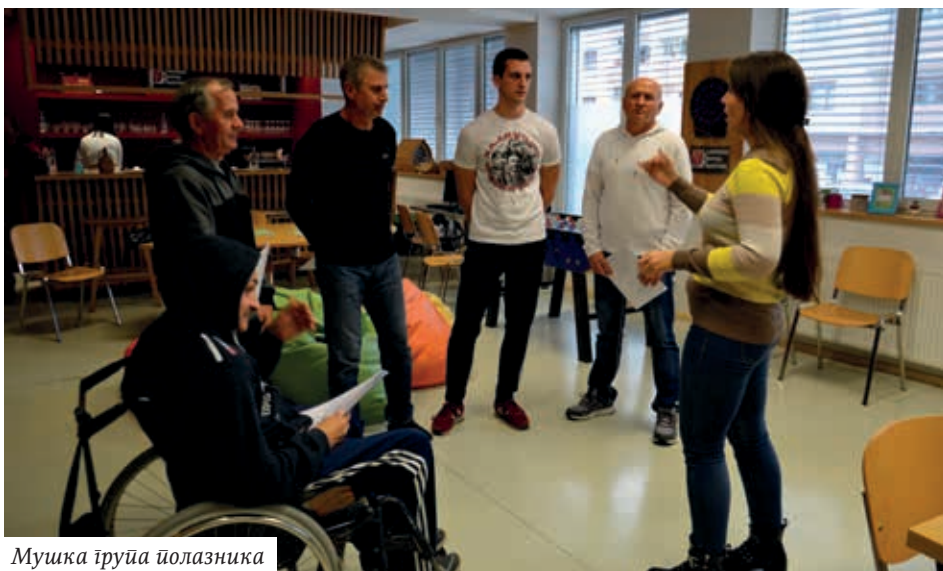
Мушка група полазника

Други дан Семинара, односно недјеља 24. октобра 2021, почео је такође окупљањем полазника и почетком рада на трећем блоку пјесама. У овом блоку полазници Семинара су се упознали и обрадили пјесме из Гламоча, затим пјесме из Челарева, па онда пјесме са Кордуна, из Војводине и на крају пјесме из Шумадије. Опет, наравно наизмјенично, женска и мушка група.