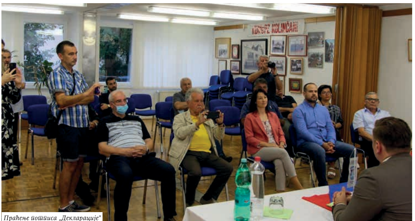
Праћење потписивања „Декларације”