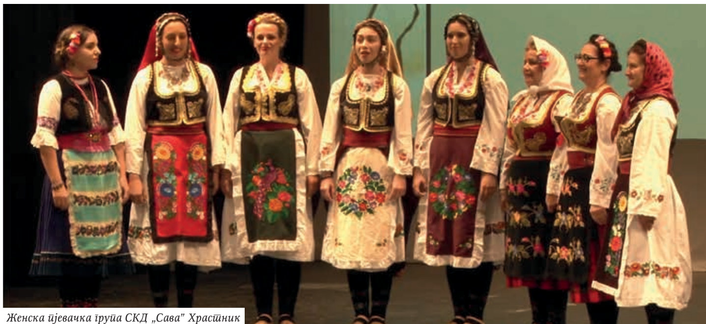
Женска пјевачка група СКД „Сава” Храстник