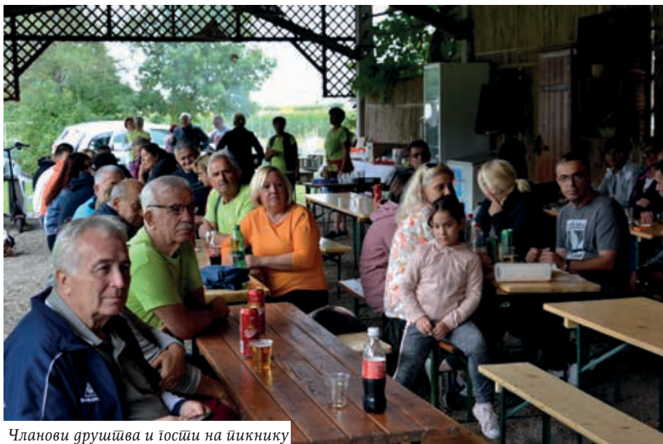
Чланови друштва и гости на пикнику