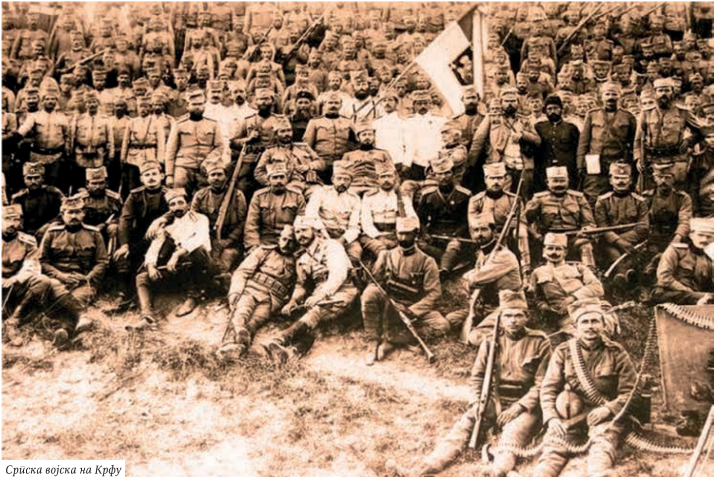
Српска војска на Крфу