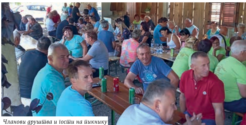
Чланови друштва и гости на пикнику