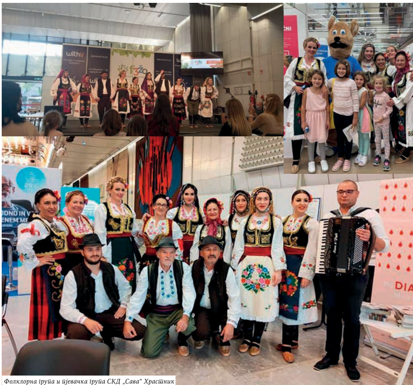
Фолклорна група и пјевачка група СКД „Сава“ Храстник