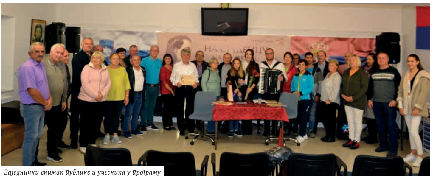
Заједнички снимак публике и учесника у програму