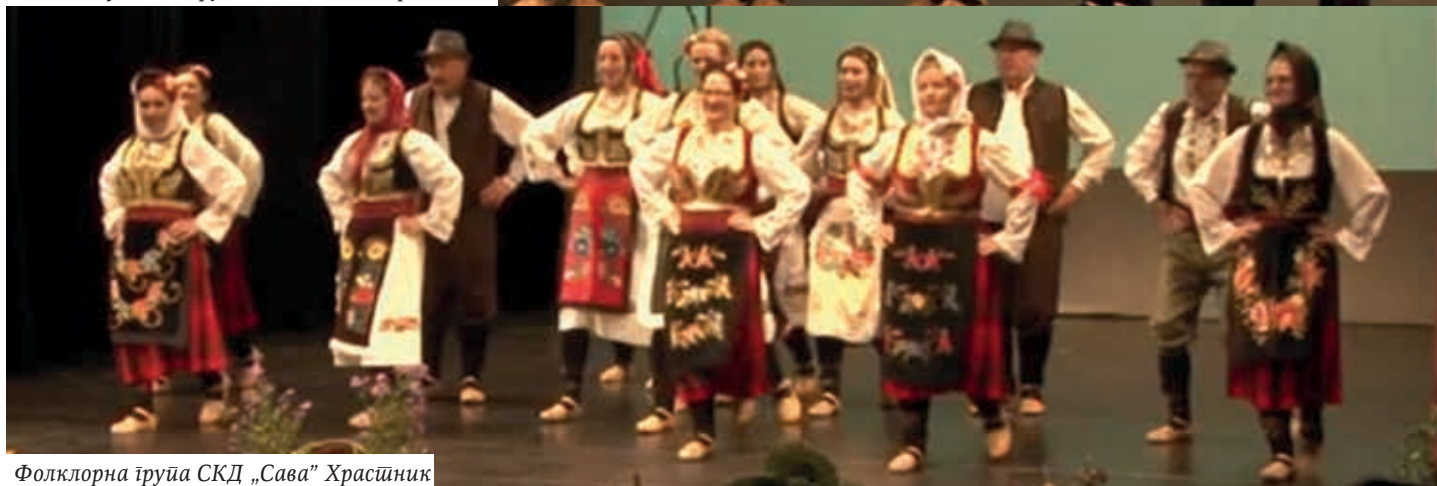
Фолклорна група СКД „Сава” Храстник