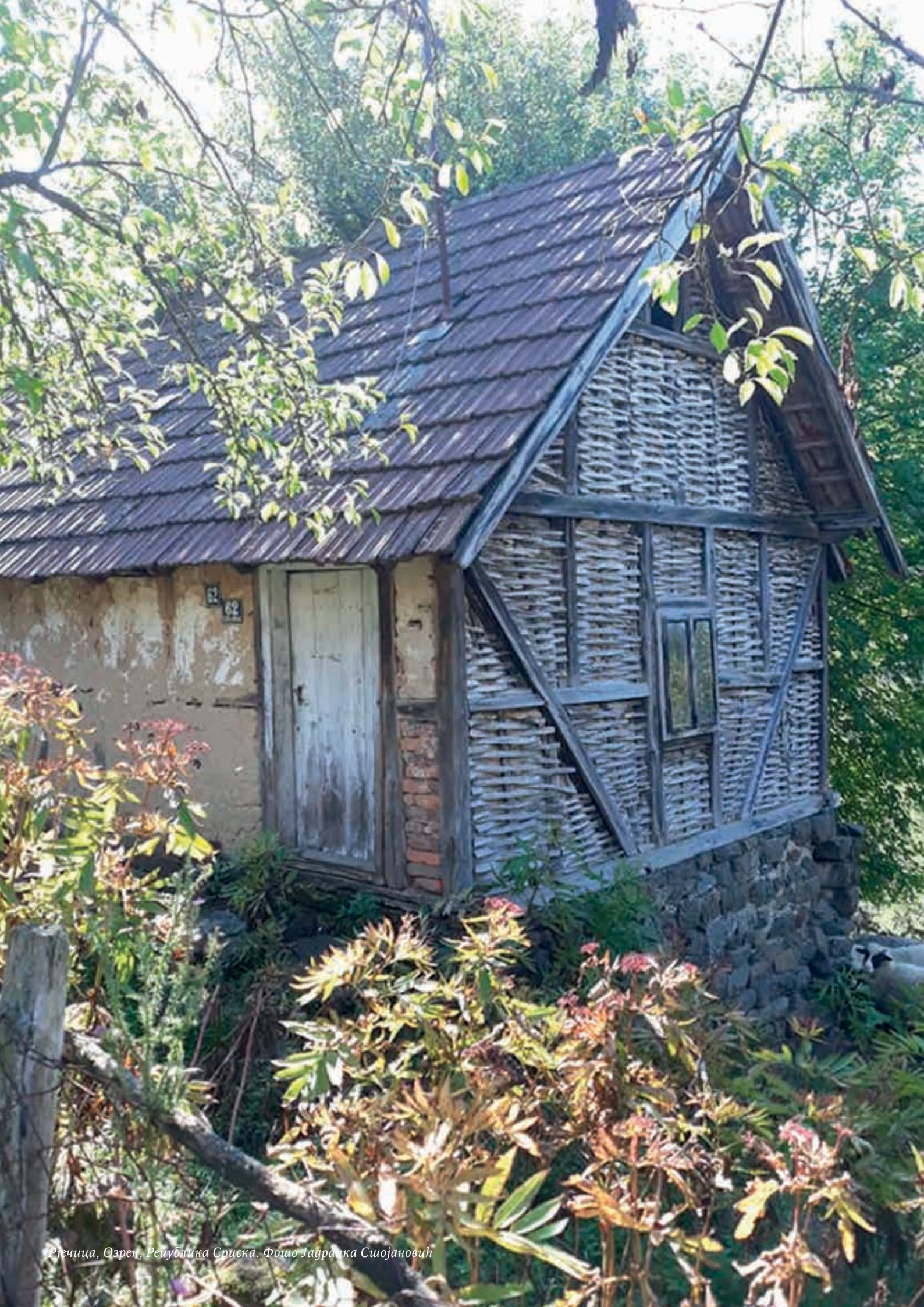
Рјешица, Озрен, Република Српска.