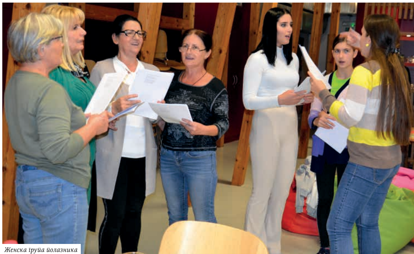
Женска група полазника