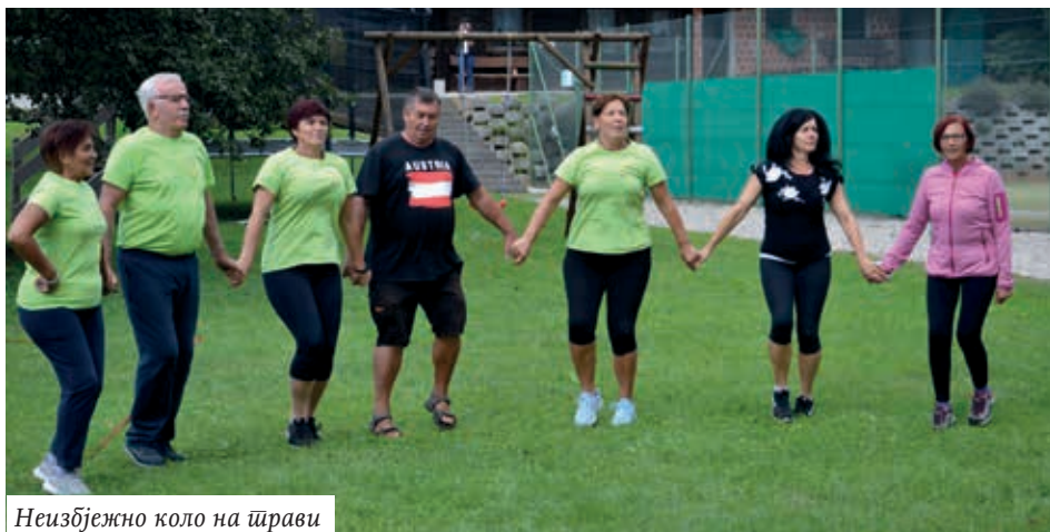
Неизбјезно коло на шрави

Они, увијек жељни покрета и пуни снаге, нису могли ни овај пут без већ традиционалне одбојке, ређале су се екипе, измјењивани састави и на крају сви су били побједници. А како другачије, Па онда је ту и коло без кога се такође не може нити на једном дружењу, па је ово на неки начин била и проба за оне који играју у фолклорним групама.