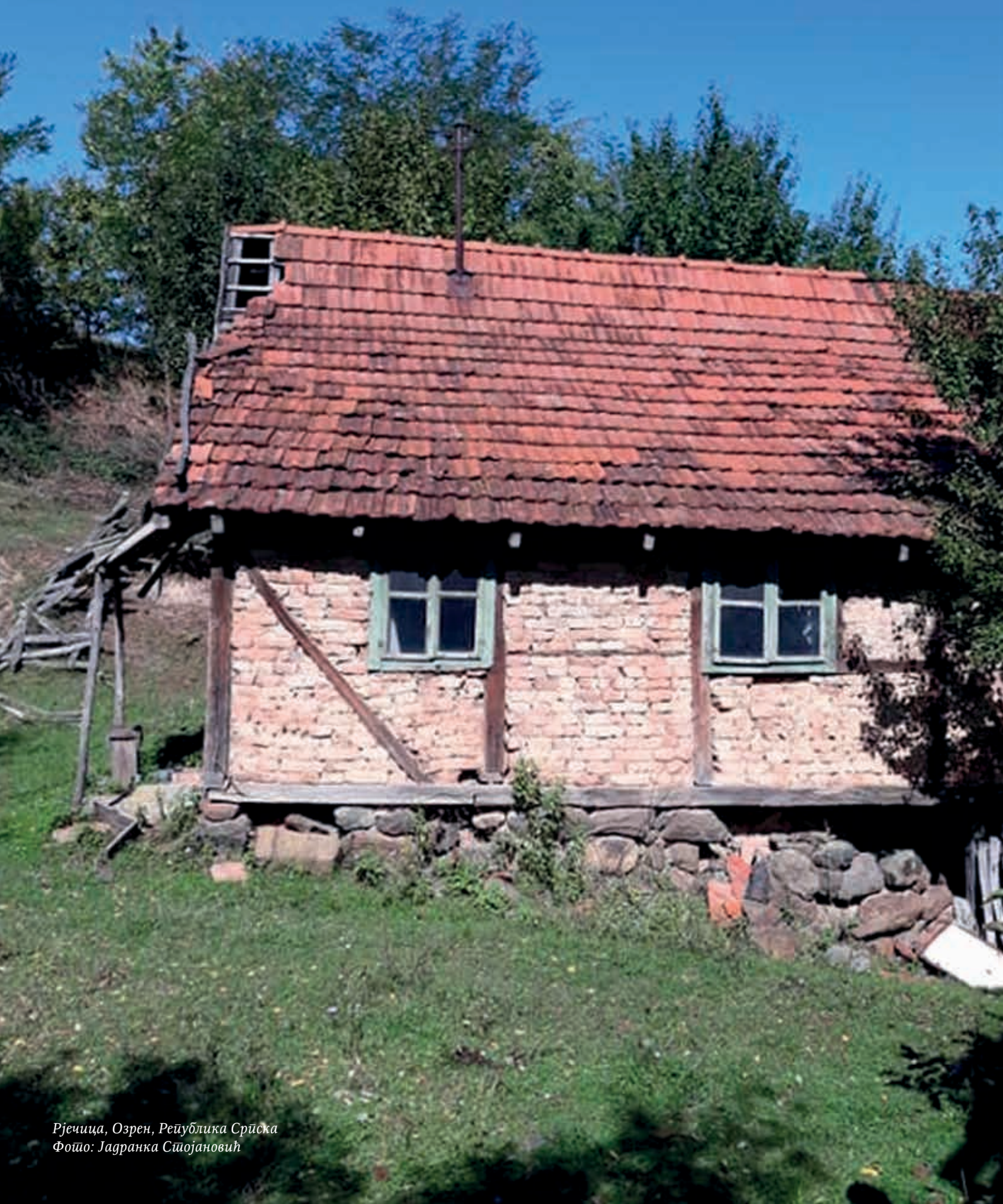
Рјечица, Озрен, Република Српска