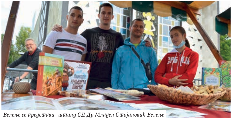
Велење се представља - шпанг СД Др Младен Стојановић Велење

Тај дан у исто вријеме одржана је више пројеката на раздаљини петсто метара.