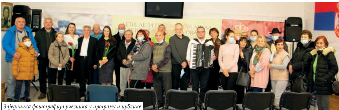
Заједничка фотографија учесника у програму и публике