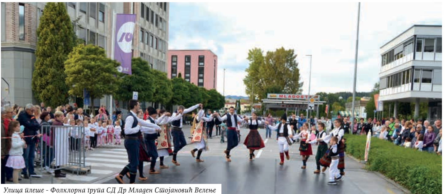
Улица Ђлеше - Фолклорна група СД Др Младен Стојановић Велење

У пројекту су учествовали: Српско друштво „Др Младен Стојановић”, КД „Међимурје”, Велењски тамбураши и грађани насеља Кардељев трг. Србско друштво „Др Младен Стојановић” из Ве-