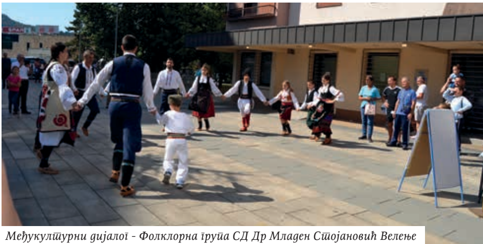
Међукултурни дијалог - Фолклорна група СД Др Младен Стојановић Велење