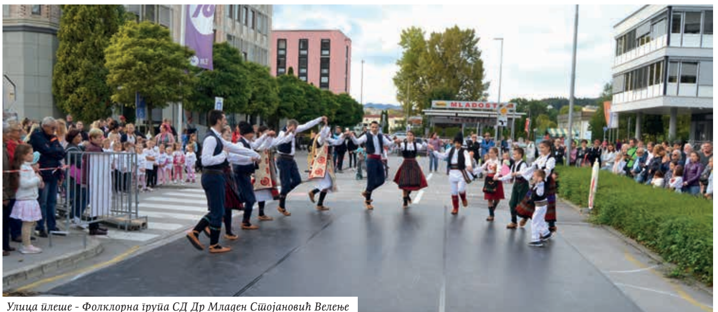
Улица Ђлеше - Фолклорна група СД Др Младен Стојановић Велење