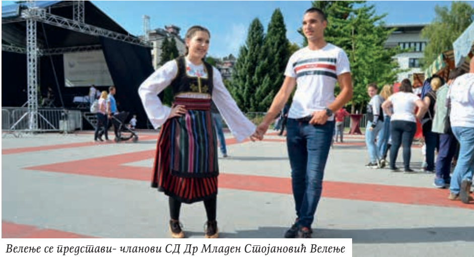
Велење се представља - чланови СД Др Младен Стојановић Велење

Овај пут, 28. септембра 2021, тема је била да представимо традиционална јела. На позив се одазвало наше друштво, албанска заједница и босанска заједница (Ал-