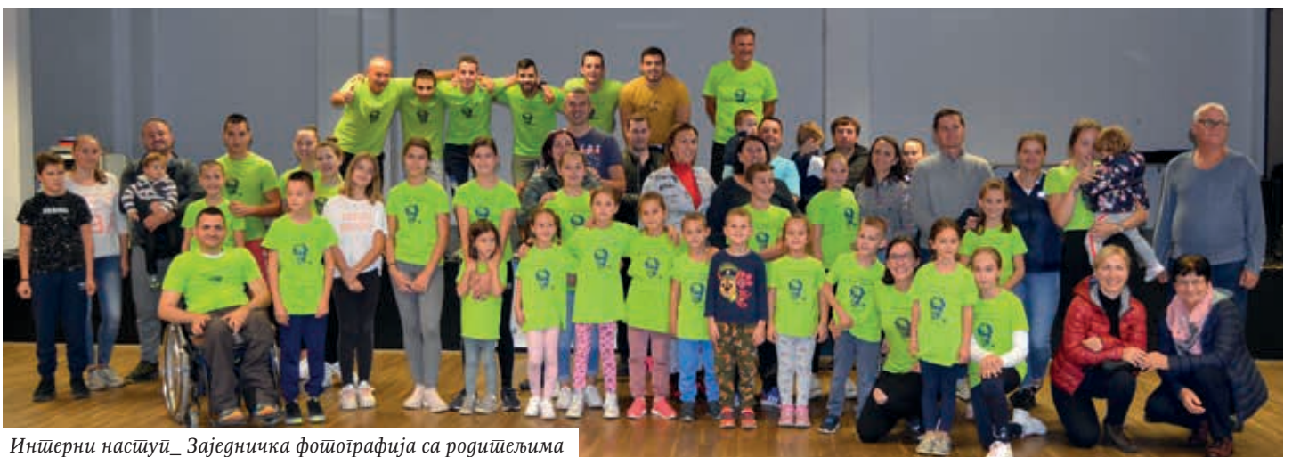
Инштерни настуй_ Заједничка фотјографија са родишељима

Улица плеше – Европска не-дјеља мобилности Двадесета годишњица европске мобилности.