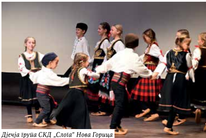
Дјечја група СКД „Слога“ Нова Горица