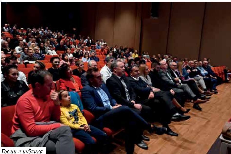
Госћи и публика