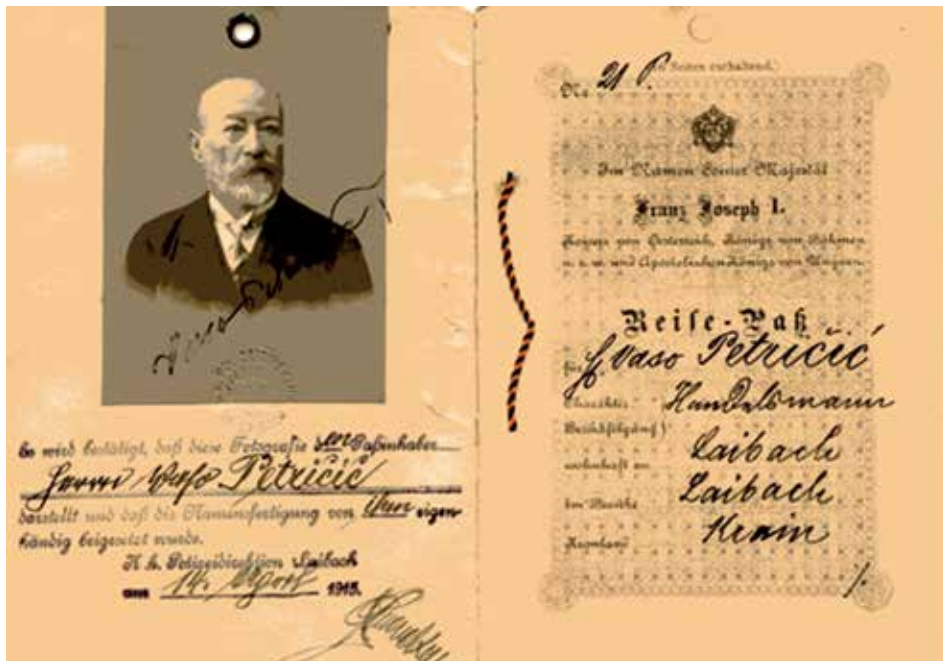
Pasoš Vase Petričića izdan u Ljubljani 1915. godine

1 Većina biografskih podataka navedena je po rukopisu bi-