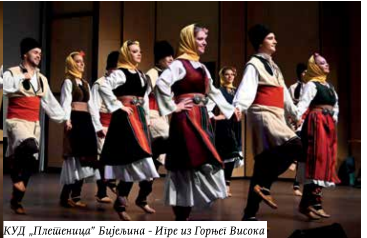
КУД „Плетеница“ Бијељина - Игре из Горње Високе