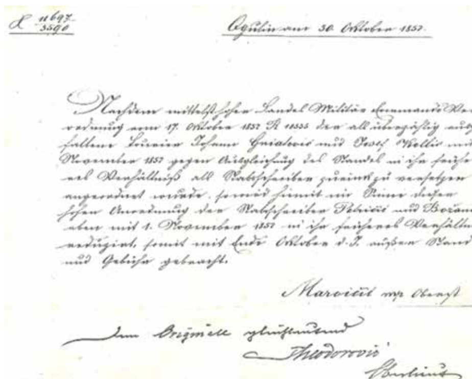
Otpusnica iz službe komande puka u Ogulinu, 30.10.1852.