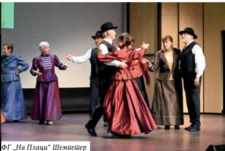
ФГ „На Плаци“ Шемњешер

не стиде за нас. То је наше посланство и ја вјерујем да ћемо сви заједно то посланство одрадити онако како треба и како се од нас очекује да, како рекох, једног дана наши наследици не буду стидјели се за нас. Ја сматрам да је овај вечерашњи догађај изузетно битног значаја за очување идентитета српског народа на овим просторима и због тога честитам Српском културном друштву „Слога“ на одлично одрађеној припреми и извођењу овог значајног пројекта. Велики