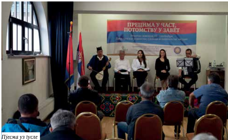
Пјесма уз гусле