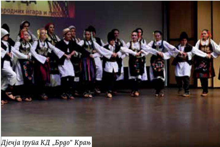
Дјечја група КД „Брдо“ Крањ