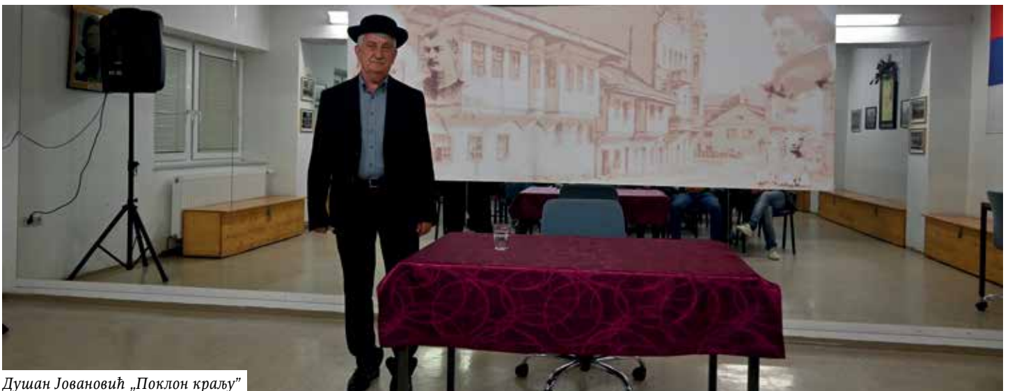
Душан Јовановић „Поклон краљу”