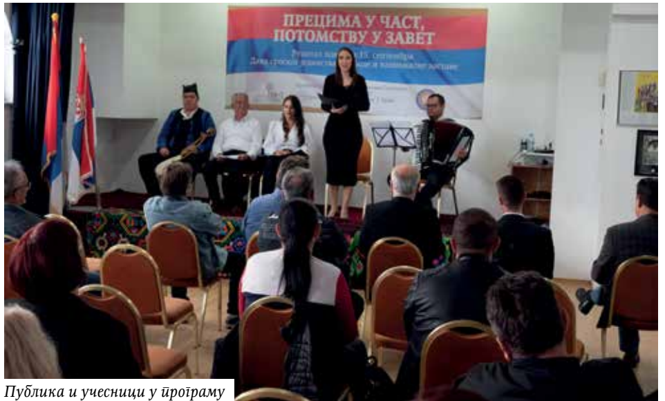
Публика и учесници у програму

Српско јединство је кроз векове било несаломиво управо у најтежим тренуцима, када је постојала опасност од потпуне пропасти српског народа, и да је народ заједно са црквом и државом сачувао то јединство чак и под туђинском влашћу. Јединство које неће бити напуштено, јединство које је претеча многих тежњи.