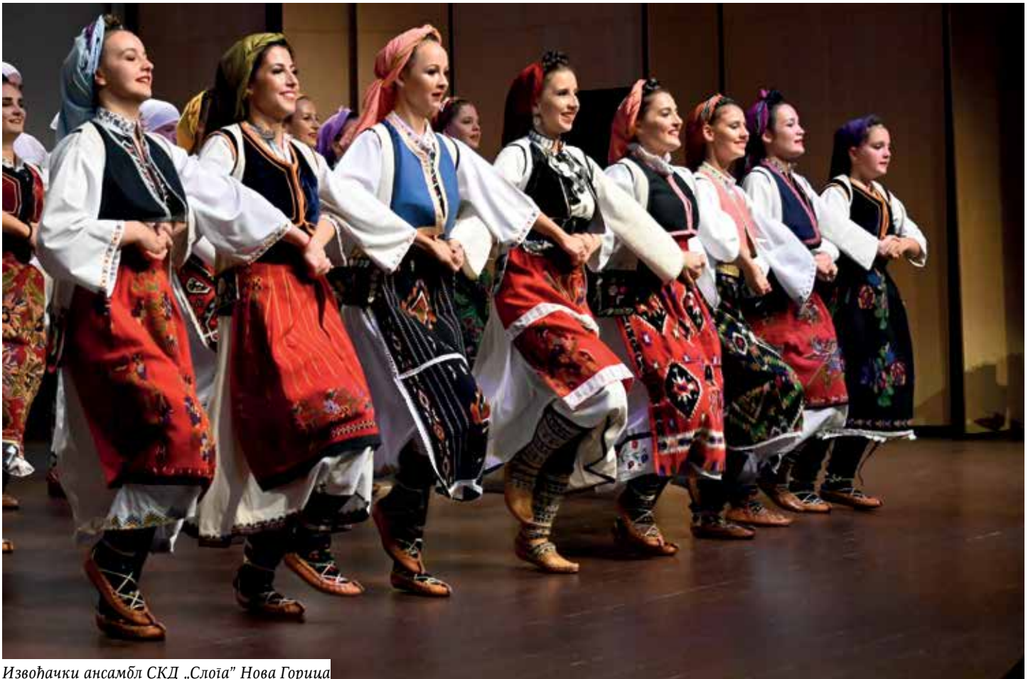
Извођачки ансамбл СКД „Слога“ Нова Горица