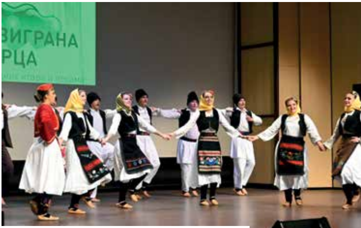
КУД „Плетеница“ Бијељина - Игре из Семберије