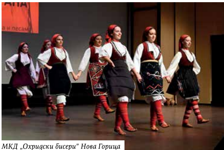
МКД „Охридски бисери“ Нова Горица