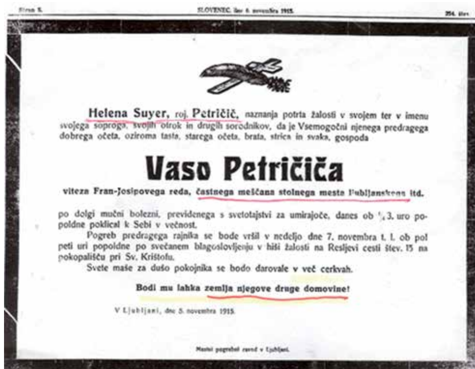
Osmrtnica objavljena u dnevnom listu »Slovenec«, Ljubljana, br. 254, 6. novembar 1915., str. 5

9 „Pogreb Vasa Petričića”, »Slovenski narod«, Ljubljana, broj 256, 7. 11. 1915. godine, str. 3.