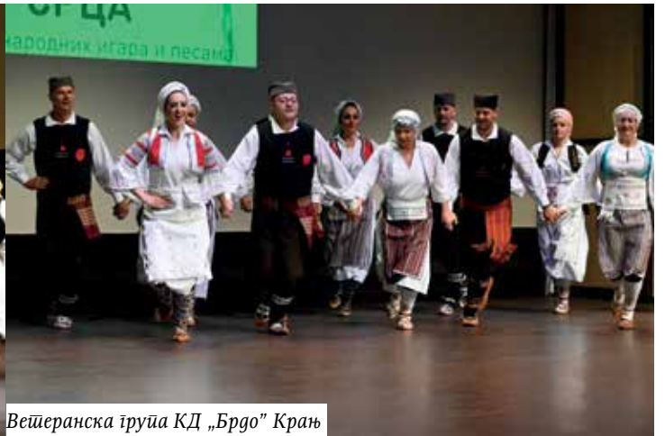
Ветеранска група КД „Брдо“ Крањ