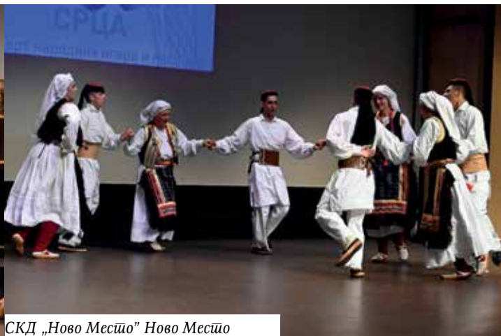
СКД „Ново Месџо“ Ново Месџо