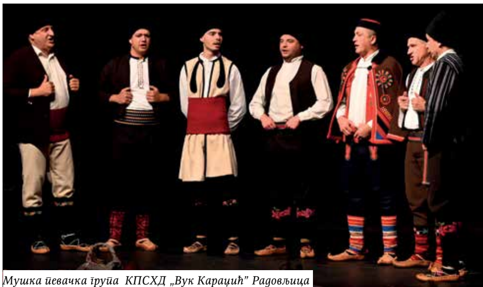
Мушка певачка група КПСХД „Вук Караџић“ Радовљица

омладине, неговање матерњег језика, очување српске културе и традиције. Већ пуних 15 година успешно плету коло, преплићу игру и реч српску, да је сачувају од заборава, да је пренесу онима који се у ово коло хватају. А вечерас их је Вуков пут довео да у колу заиграју и код нас“. Млади фолклораша из Салцбурга представили су се играма из околине Ниша.