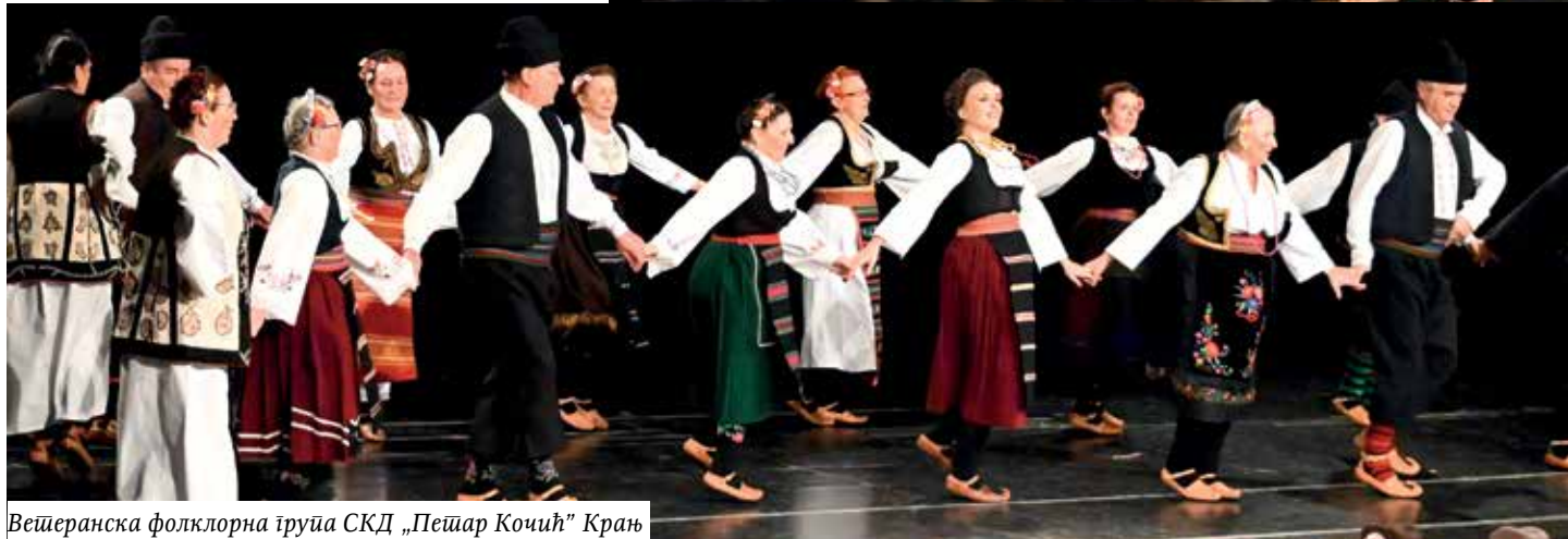
Ветеранска фолклорна група СКД „Пеђар Кочић“ Крањ