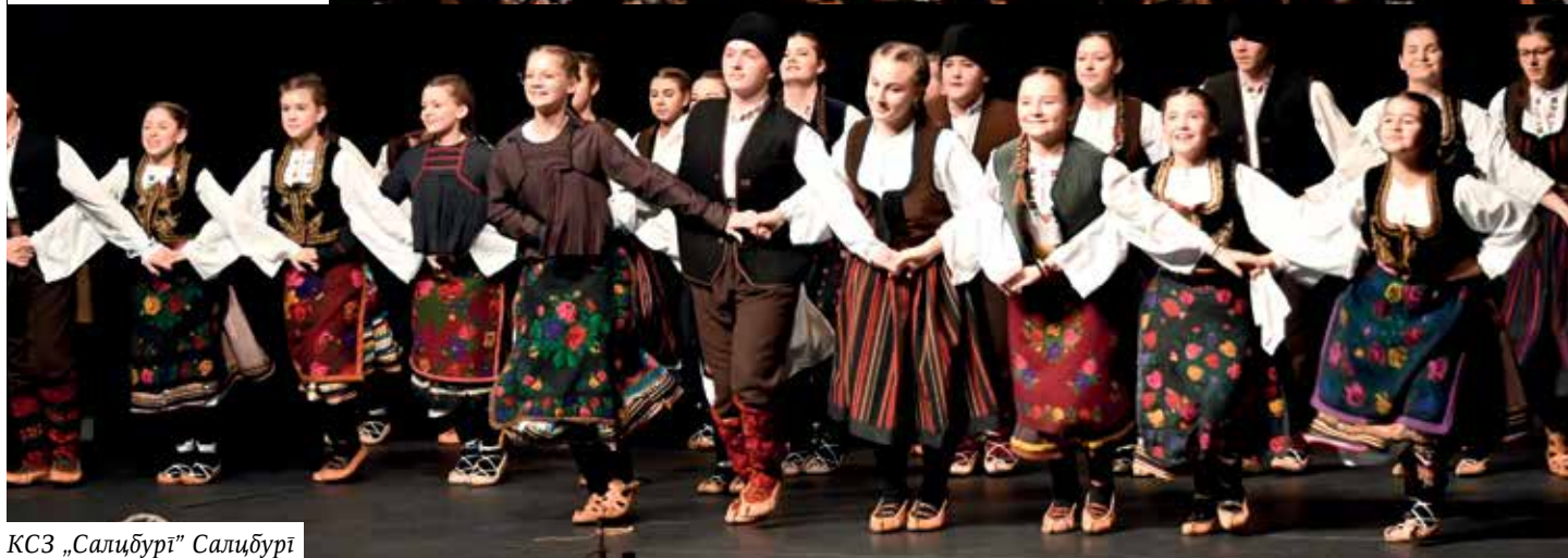
КСЗ „Салибурј” Салибурј