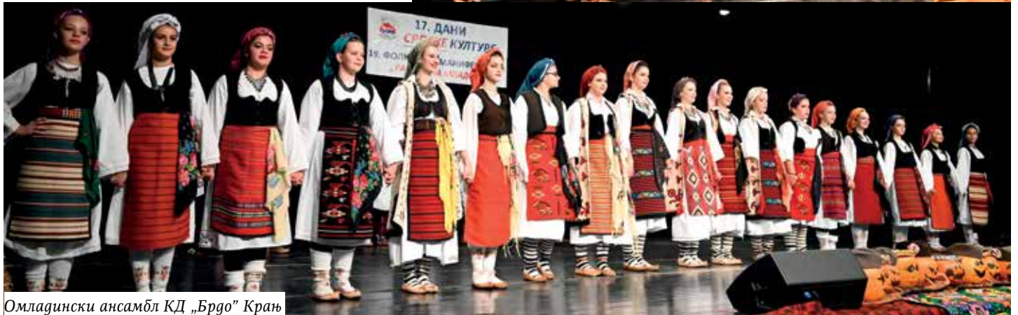
Омладински ансамбл КД „Брдо“ Крањ