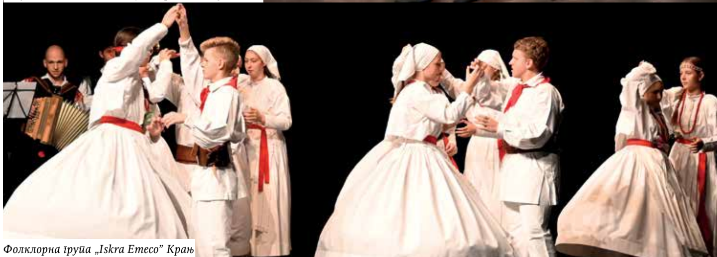
Фолклорна труппа „Iskra Етесо” Крањ