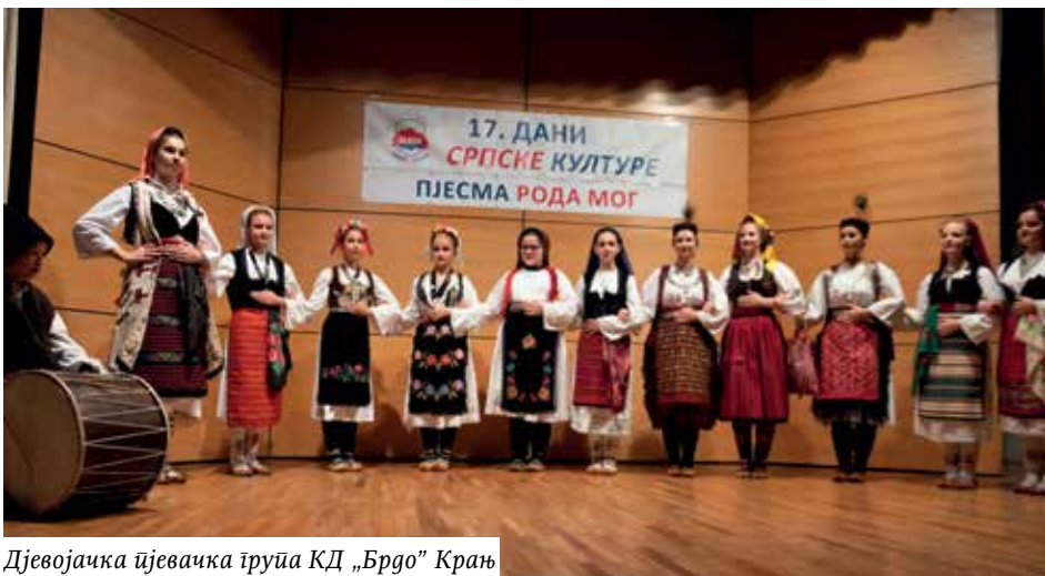
Дјевојачка пјевачка група КД „Брдо” Крањ

У самој завршници, као што се већ уобичајило, опет смо видјели и њихове гласове послушали, старију мушку пјевачку групу организатора догађаја, Културног друштва „Брдо”. Своју наклоњеност пјевача ка Лици исказали су красећи се на бини личким јелесима. Ову групу преводи Радомир Вујановић, а њега бројна публика познаје