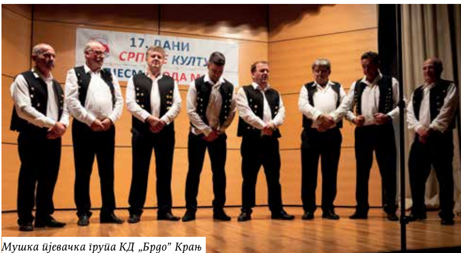
Мушка пјевачка група КД „Брдо” Крањ