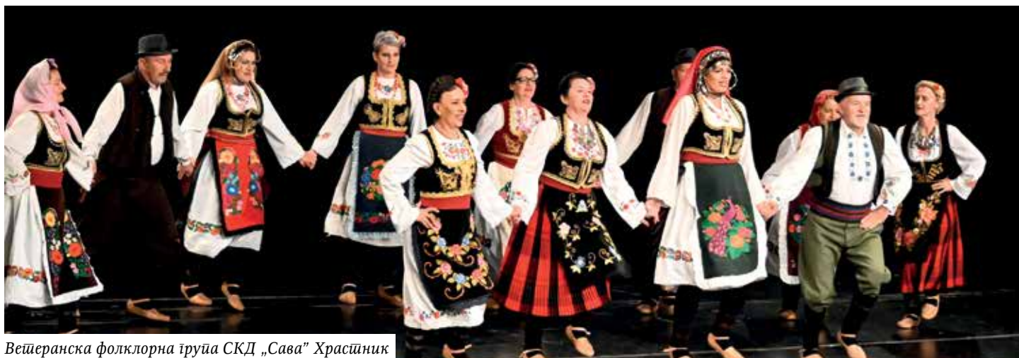
Ветеранска фолклорна група СКД „Сава“ Храсњик