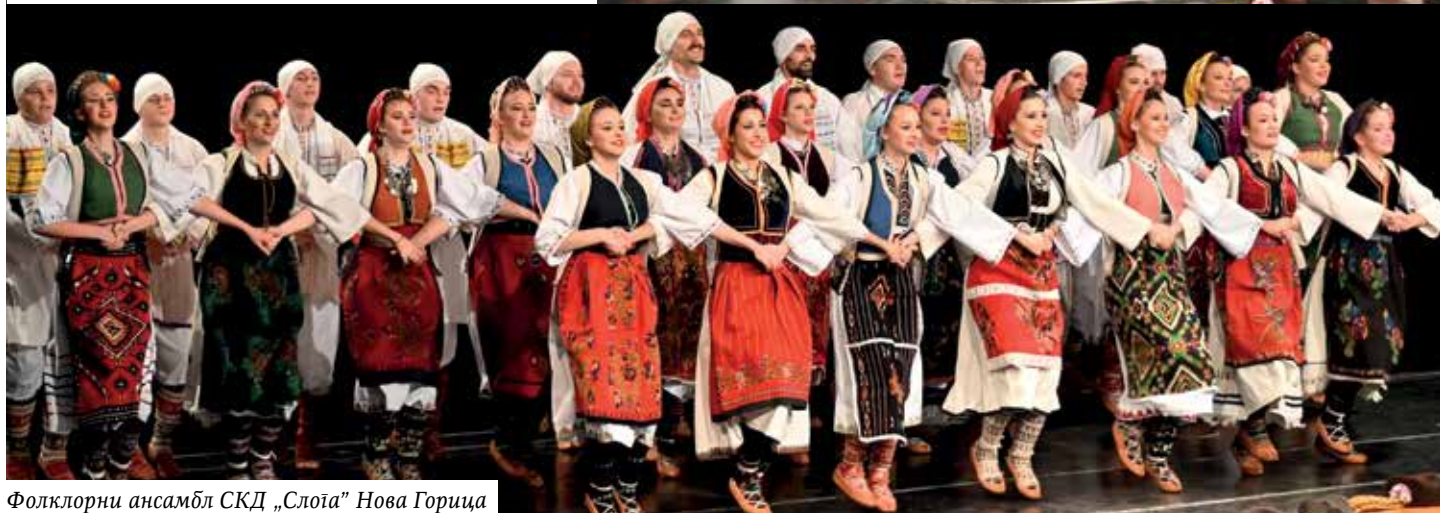
Фолклорни ансамбл СКД „Слоја“ Нова Горица