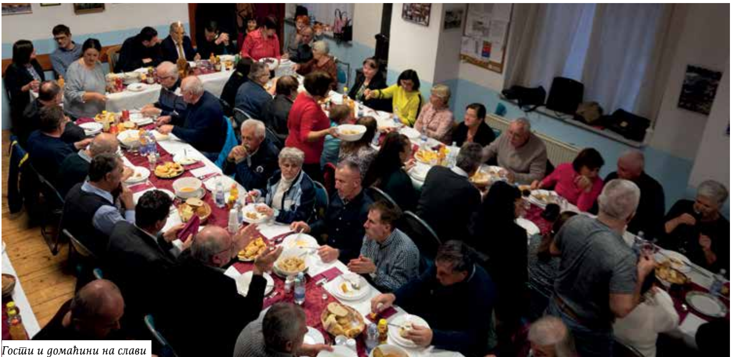
Госћи и домаћини на слави

и над њима црква саграђена. Пострада св. Мина око 304. год. и пресели се у царство Христово. Но би и оста велики чудотворац у обадва живота, и на земљи и на небу. Ко год је св. Мину славио и на невољи у помоћ га са вером призивао, томе је он помагао. Више пута јављао се као ратник на коњу, да помогне вернима или да казни неверне”. За Светог мученика Стефана Уроша III