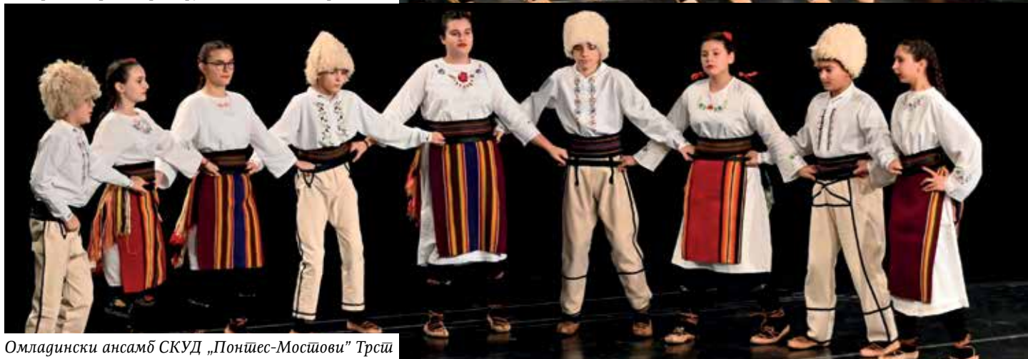
Омладински ансамбл СКД „Понђес-Мосјови“ Трстје