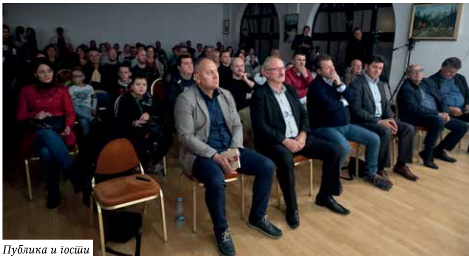
Публика и гост