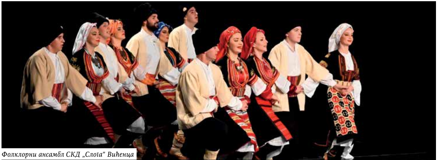
Фолклорни ансамбл СКД „Слоја“ Вићенца