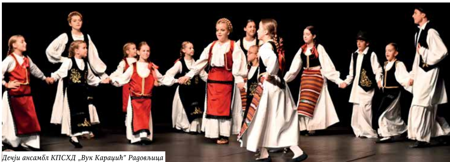
Деци ансамбл КПСХД „Вук Караџић” Радовљица