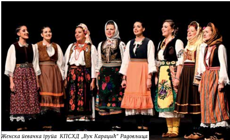
Женска певачка група КПСХД „Вук Караџић“ Радовљица