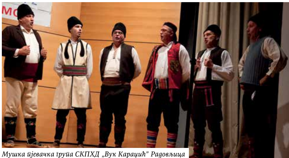
Мушка пјевачка група СКПХД „Вук Караџић“ Радовљица