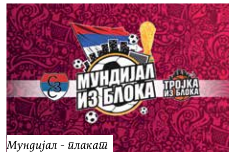
Мундијал - илакаш

Кроз пројекат „Мундијал из блока“ велики број нових људи први пут се упознао са радом Хуманитарне организације Срби за Србе која је од 2005. године до данас прикупила