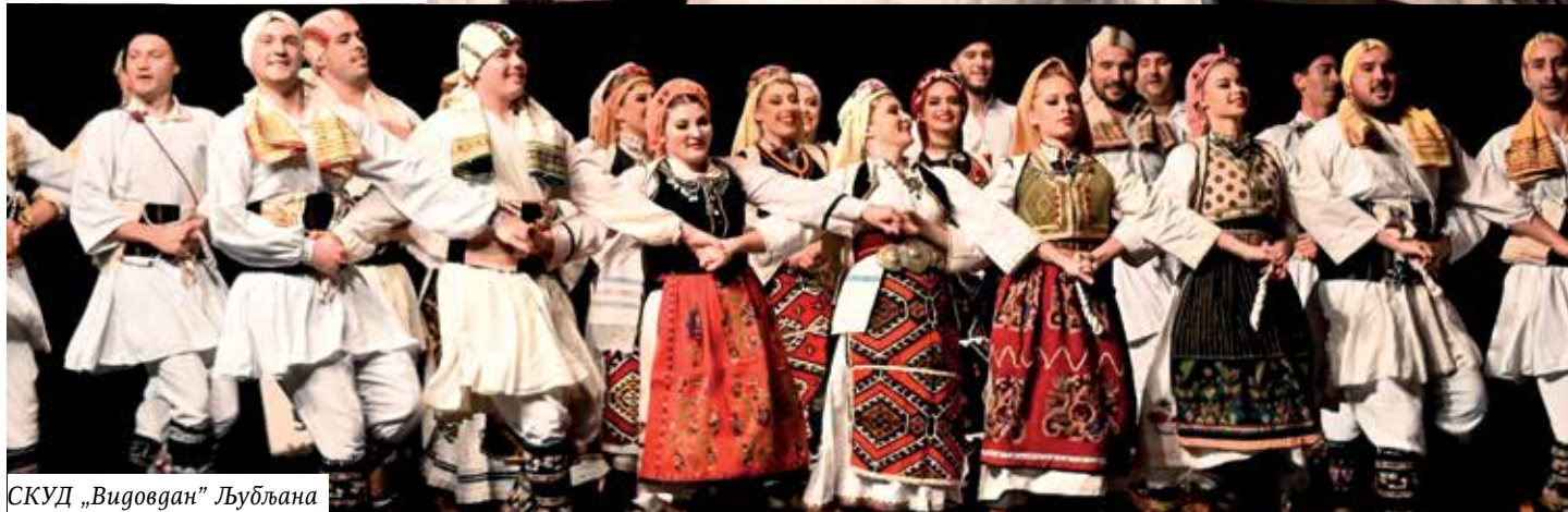
СКУД „Видовдан” Љубљана