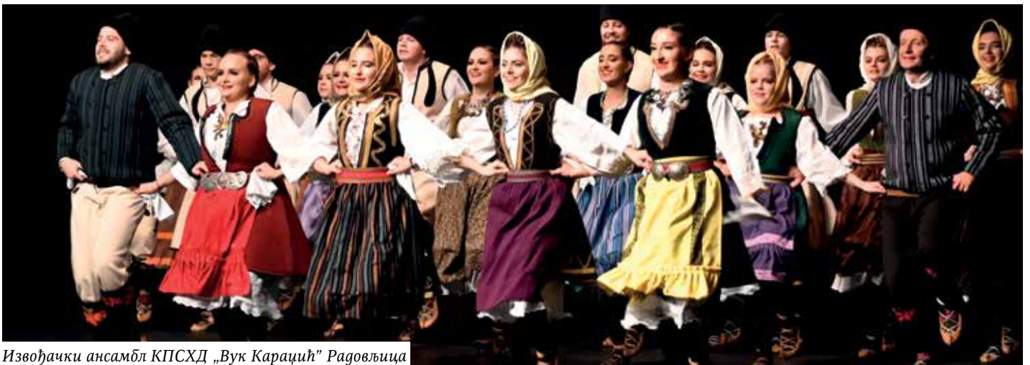
Извођачки ансамбл КПСХД „Вук Караџић” Радовљица

Публика је поново имала прилику да чује певање, овај пут у извођењу женског певачког дуета из Културно просветне заједнице Срба из Салцбурга, а девојке су на веома леп начин отпевале песму „Море сокол пие”.