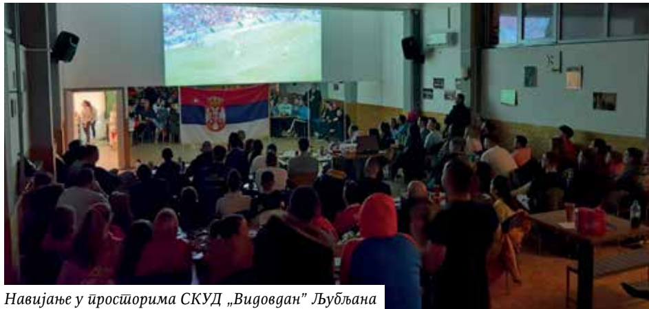
Навијање у просторима СКУД „Видовдан“ Љубљана

За фудбалску репрезентацију Србије се навијало од Аустралије, Русије и Америке, преко бројних европских држава, међу којима је била и Словенија, па до Републике Српске, Србије, Црне Горе и других држава у региону, а паралелно са тим прикупљала се помоћ за угрожене српске породице на Косову и Метохији.