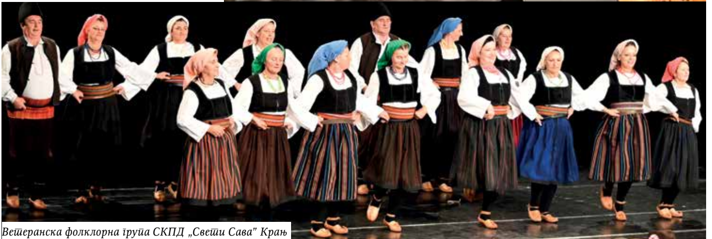
Вешеранска фолклорна група СКПД „Свешти Сава“ Крањ