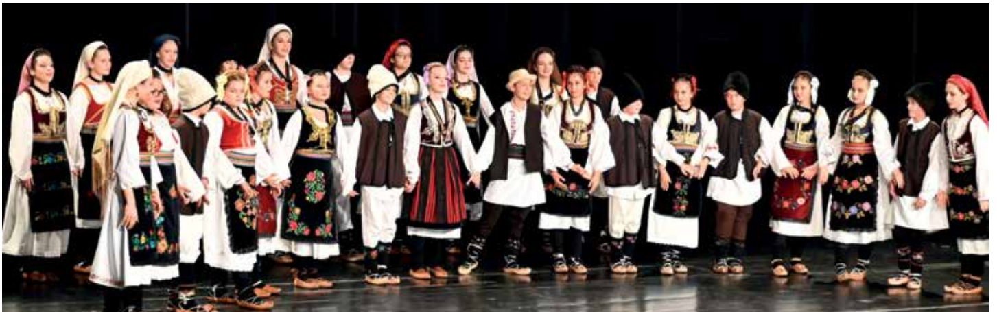
Омлагински фолклорни ансамбл КД „Брдо“ Крањ