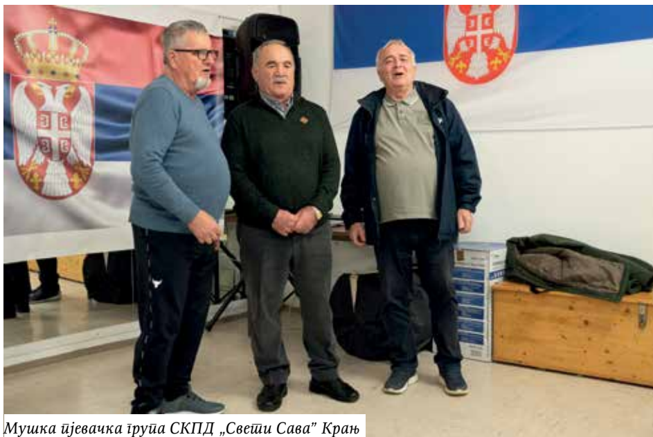
Мушка пјевачка група СКПД „Свети Сава” Крањ