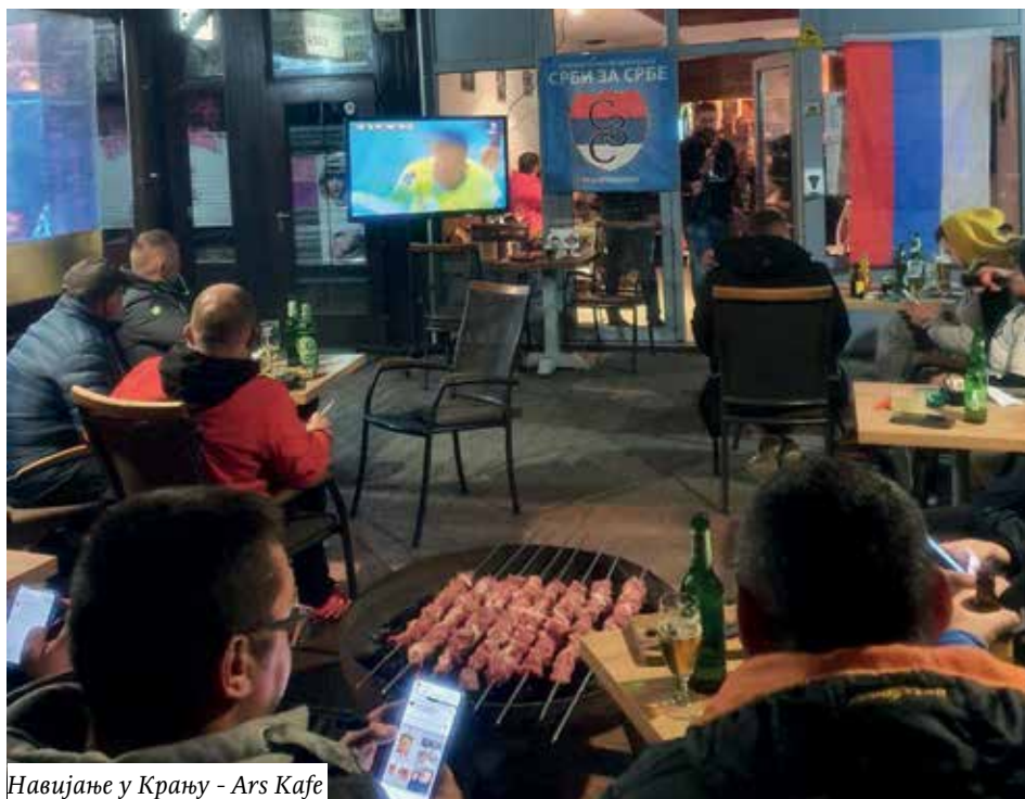
Навијање у Крању - Ars Kafe