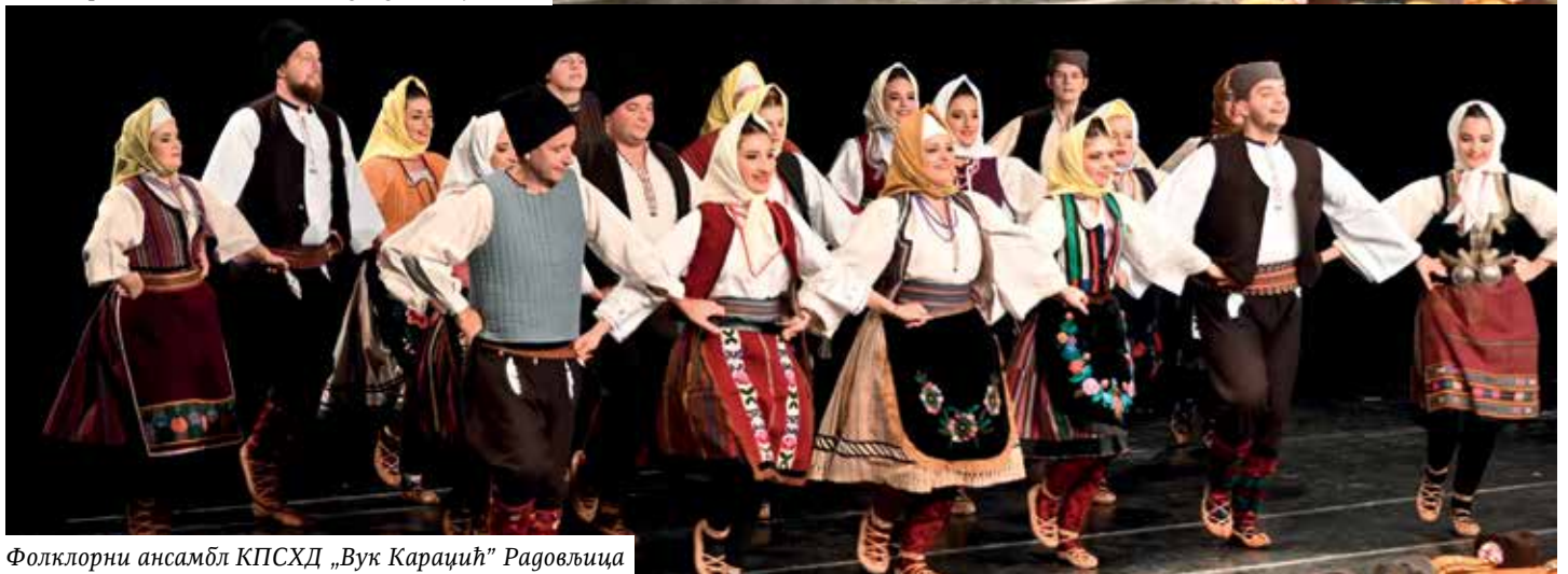
Фолклорни ансамбл КПСХД „Вук Караџић“ Радовљица