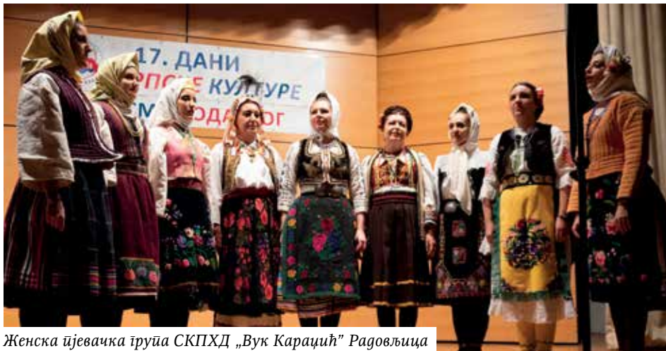
Женска џјевачка џруџа СКПХД „Вук Караџић” Радовљица