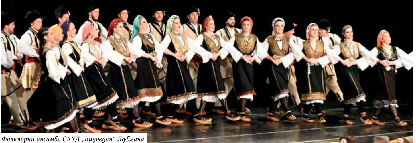
Фолклорни ансамбл СКУД „Видовдан“ Љубљана