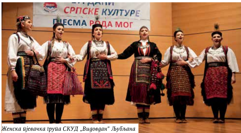
Женска пјевачка група СКУД „Видовдан“ Љубљана