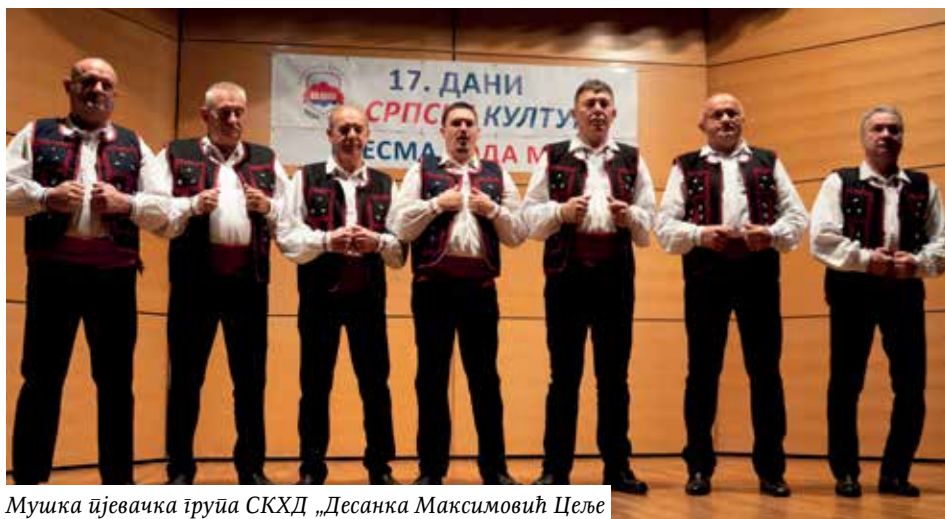
Мушка џјевачка група СКХД „Десанка Максимовић Цеље