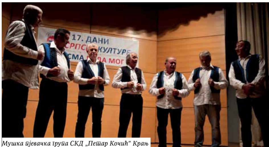
Мушка џјевачка група СКД „Пејшар Кочић“ Крањ