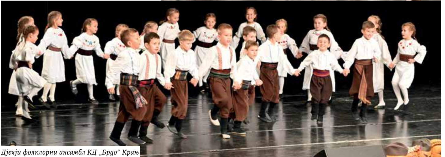
Дјеџи фолклорни ансамбл КД „Брдо“ Крањ