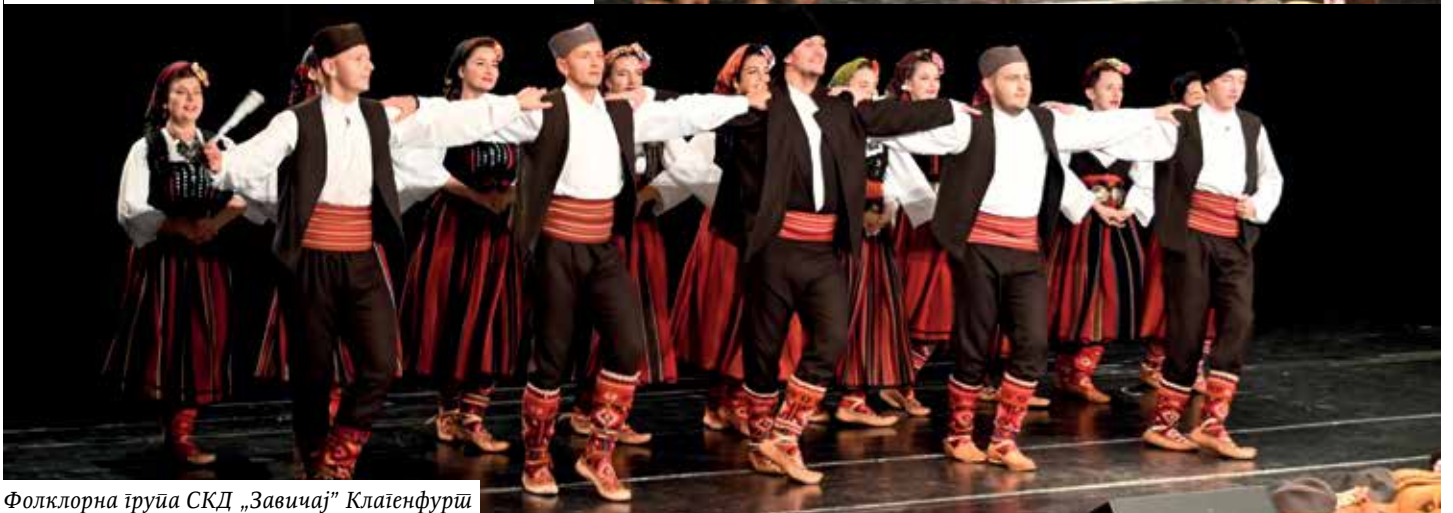
Фолклорна група СКД „Завичај“ Клајенфурт