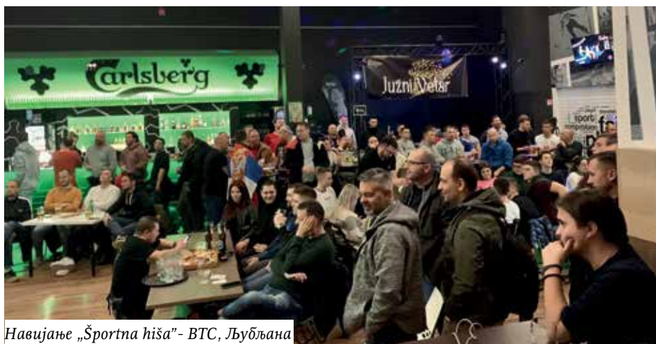
Навијање „Športna hiša“ - ВТС, Љубљана