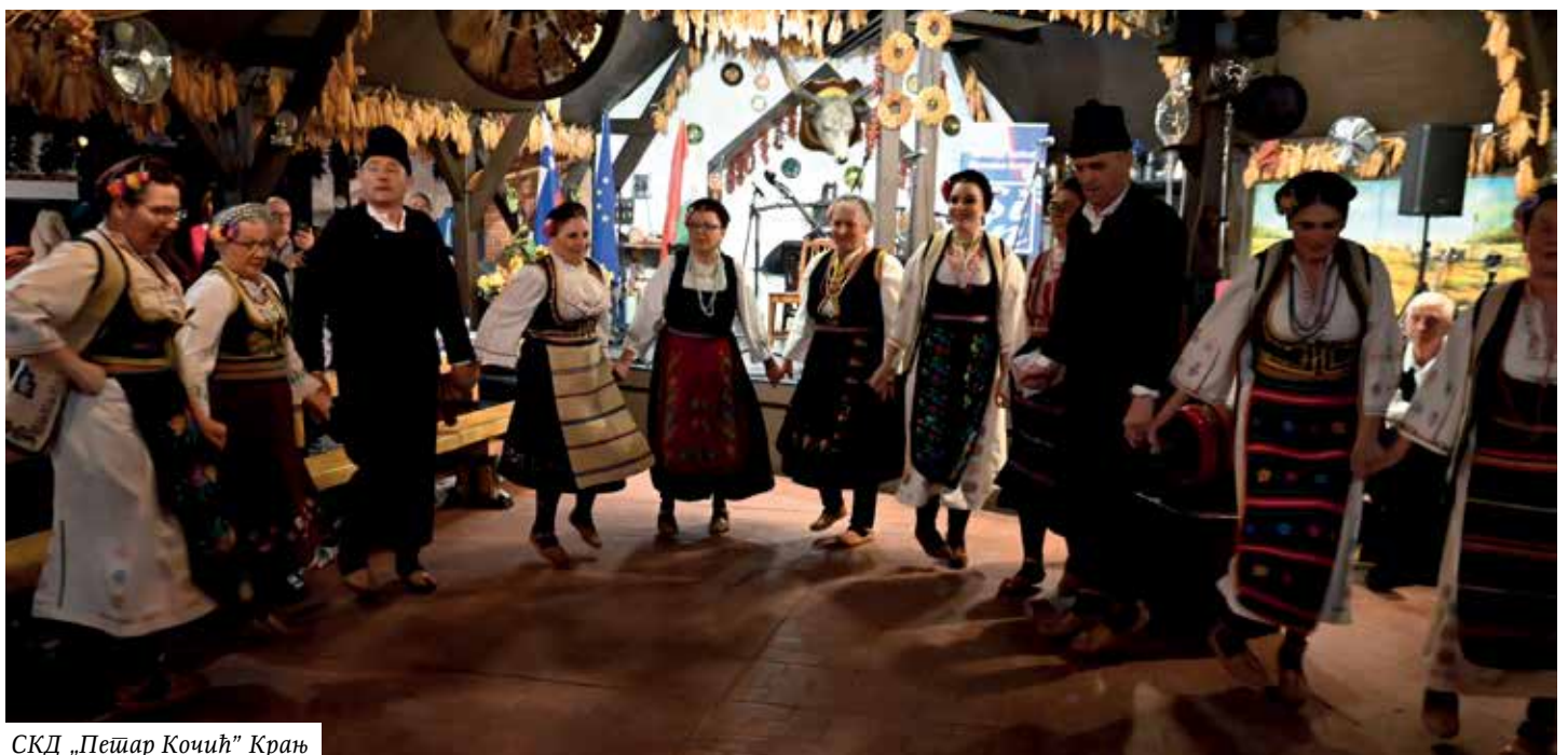
СКД „Петар Кочић“ Крањ

Folklorна skupina KD Bloke, Kulturno društvo folklorа Cerklje na Gorenjskem, Folklorно društvo Bled, Instrumentalna vokalna skupina Halonga Cirkulane, Glasbeno društvo „Deseti brat“, - Oktet „Deseti brat“, ŽKUD Folklorна skupina „Tine Rožanc“ – veterani, Tamburaški orkester FD Kranj i СКД „Петар Кочић“ Крањ. Након представљања услиједио је наступ пјевачких група и инструменталних састава са разноликим словеначким народним и умјетничким пјесмама и мелодијама. После наступа послужена је вечера и пиће, традиционални мађарски гулаш. Импресивна возња бродом по Дунаву, више од три сата, никога није оставила равнодушним. Била је то прилика да се Будимпешта разгледа у ноћном амбијенту, а посебно је била занимљива величанствена зграда мађарског парламента, која у ноћи, обасјана свјетлошћу, изгледа као да је златом обливена. За љубитеље фотографије била је ово изванредна прилика да направе доста лијепих и занимљивих фотографија. Све у свему, било је ово једно незаборавно вече.