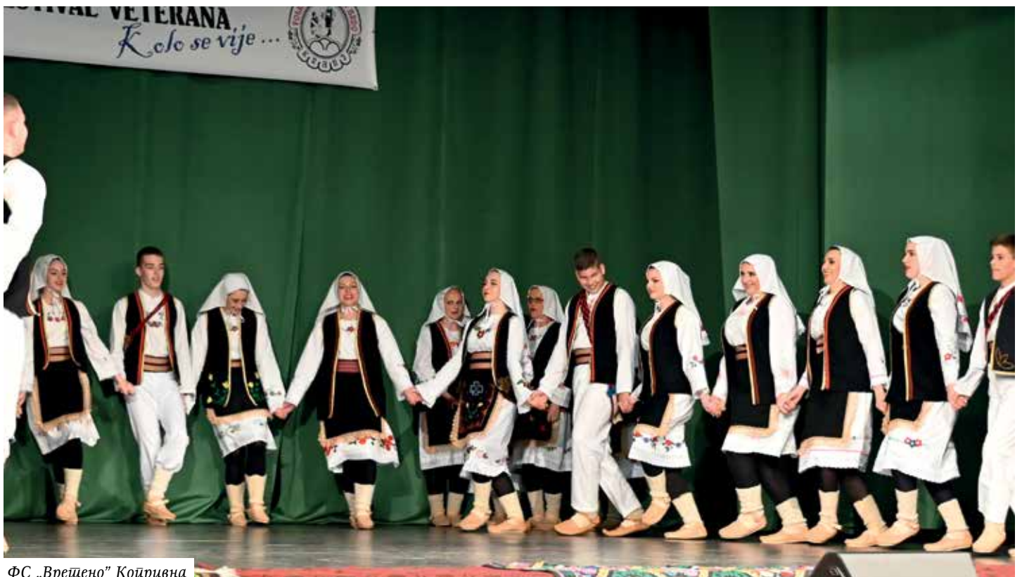
ФС „Вретено“ Копривна