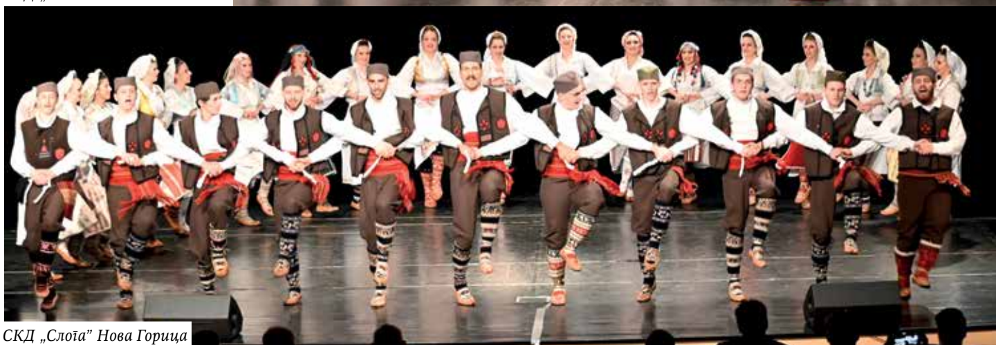
СКД „Слоја“ Нова Горица