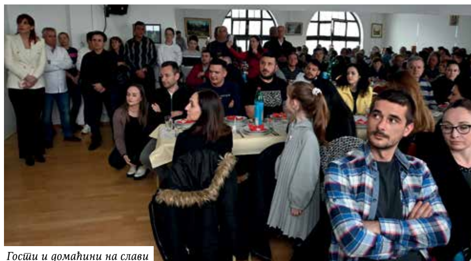
Госћи и домаћини на слави