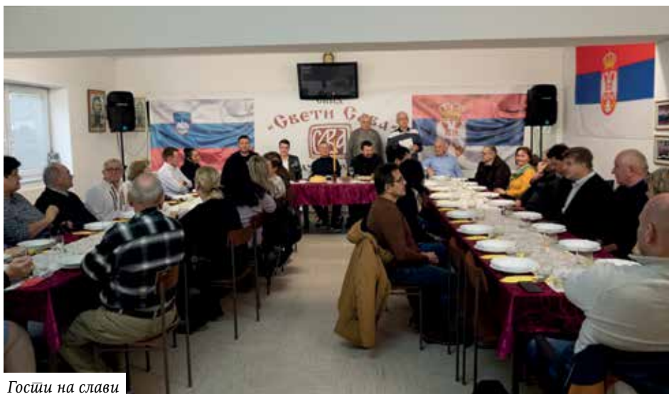
Госћи на слави