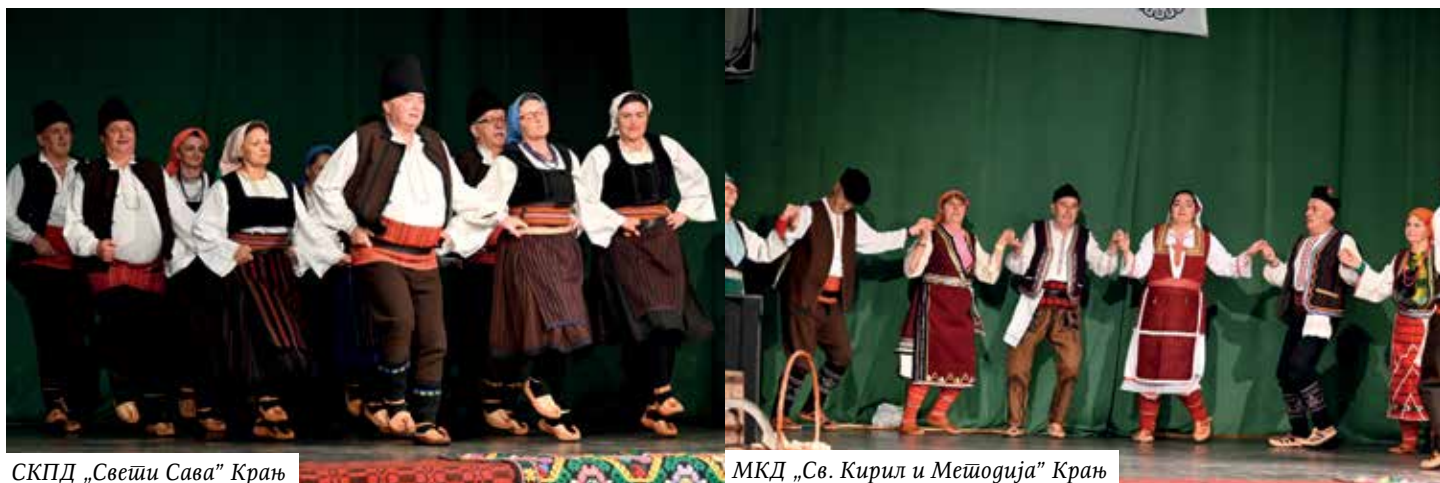
СКПД „Свети Сава“ Крањ