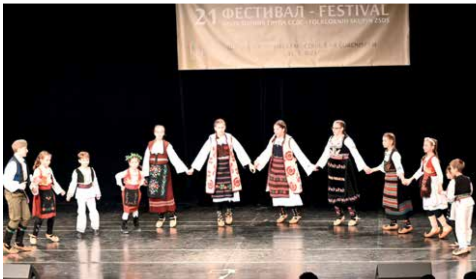
СД „Др Младен Стојановић” Велење

Из Новог Места стигла је још једна фолклорна група, и то извођачки ансамбл Српског културног друштва „Ново Место” Ново Место, који су одиграли „Игре из