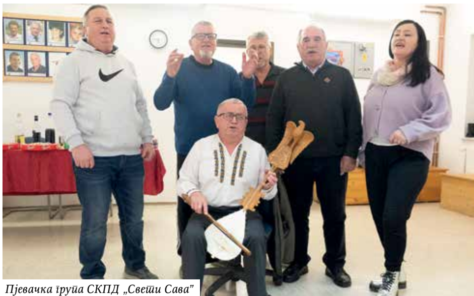
Пјевачка група СКПД „Свети Сава”