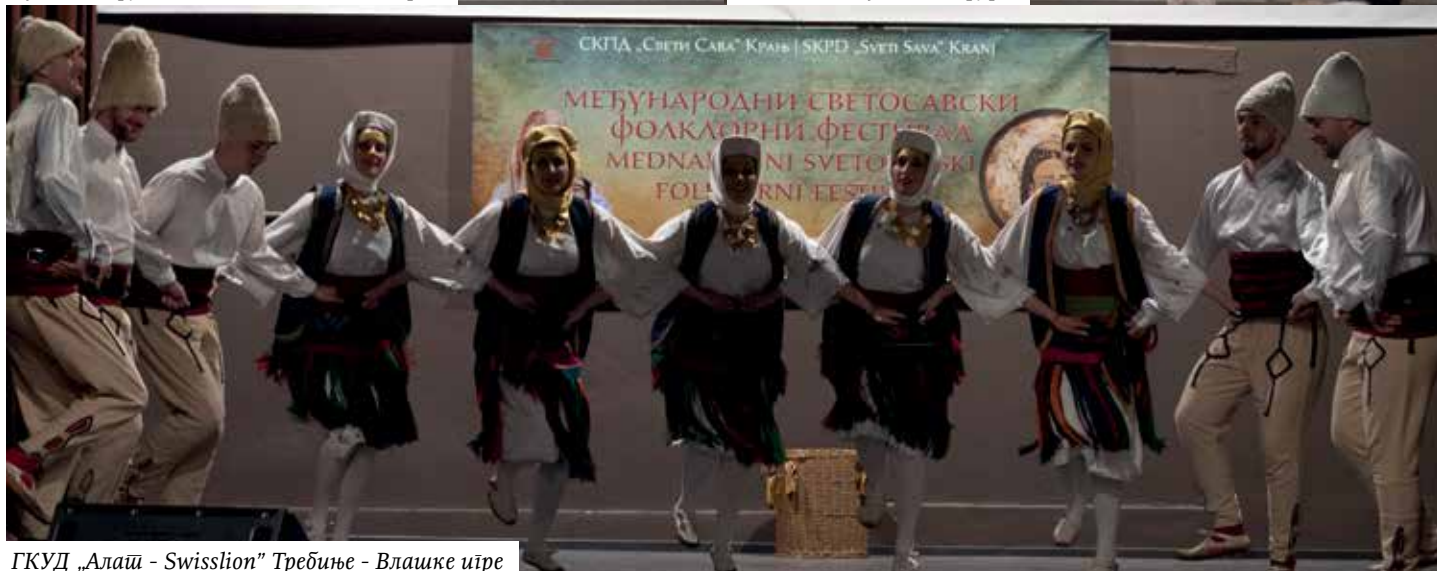
ГКУД „Алаш - Swisslion“ Требиње - Влашке истре