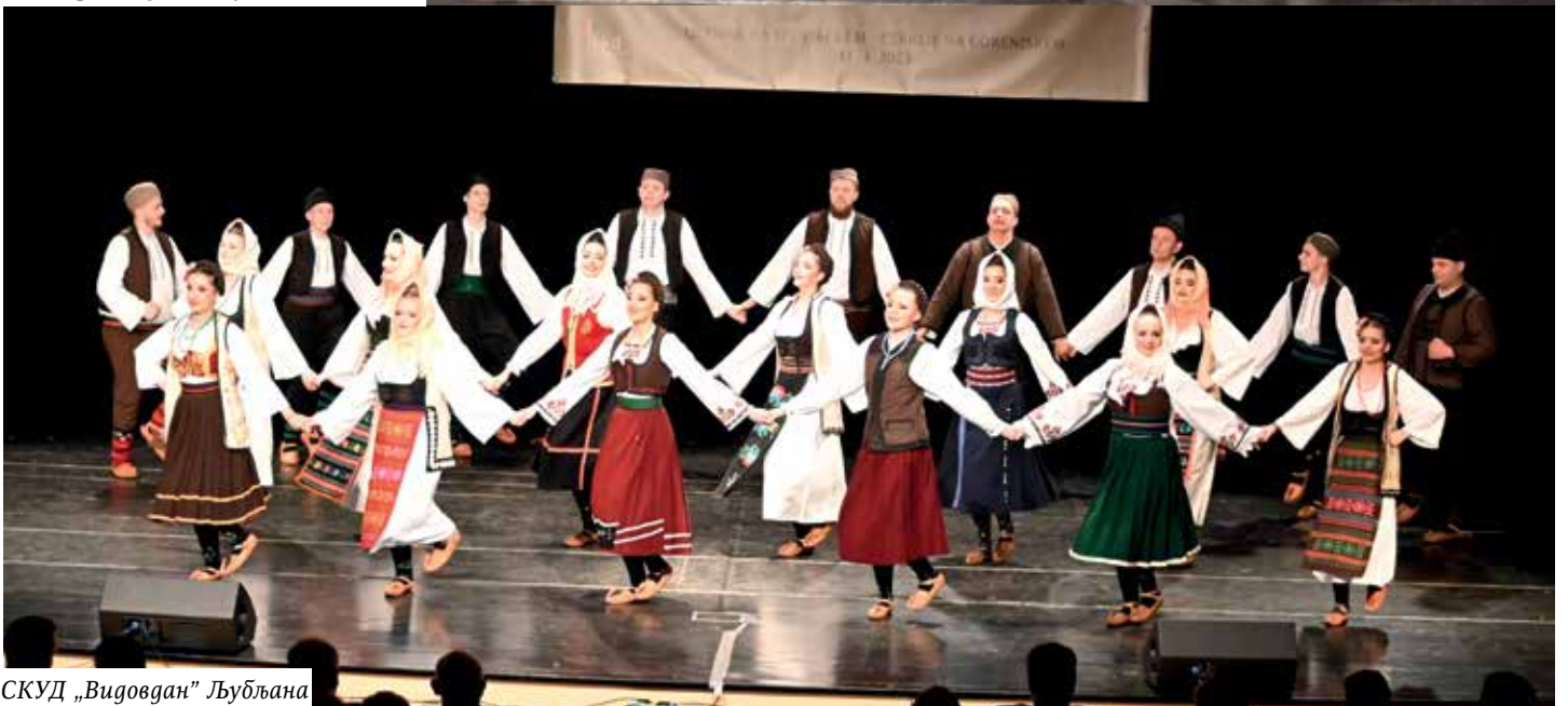
СКУД „Видовдан“ Љубљана