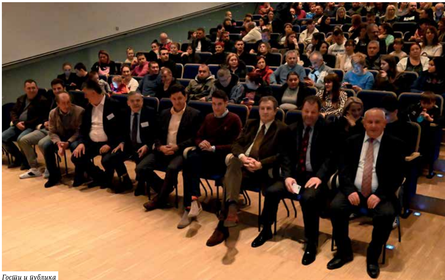
Госћи и љубљика