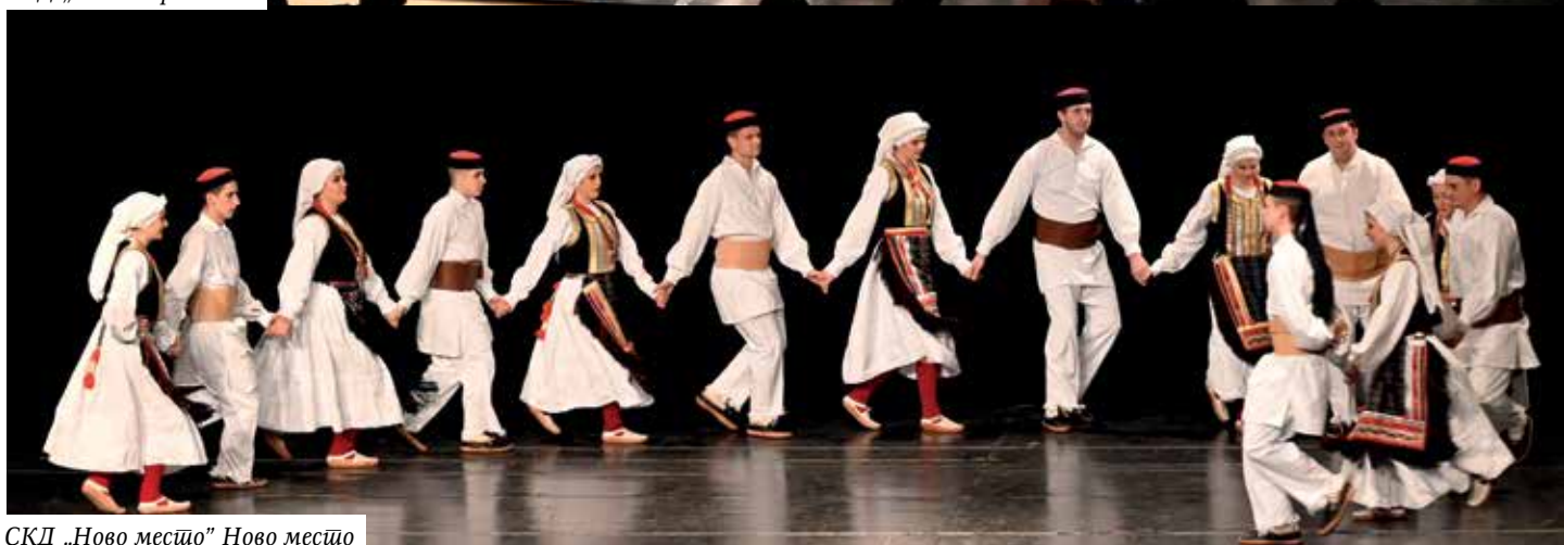
СКД „Ново месџо“ Ново месџо