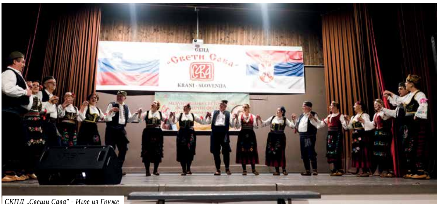
СКПД „Свети Сава” - Игре из Грузе