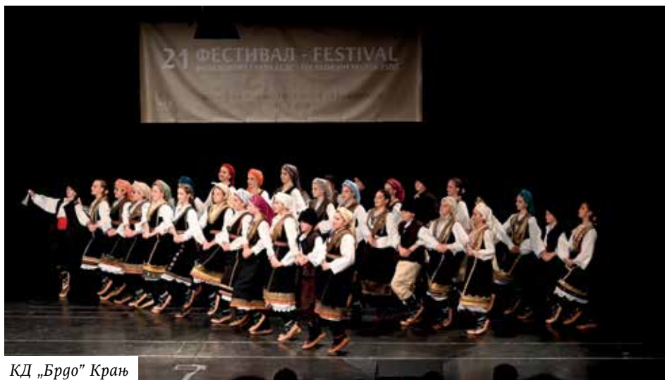
КД „Брдо” Крањ

Старији дечји ансамбл Српског културно уметничког друштва „Видовдан” Љубљана публици се представио кореографијом која носи назив „Влашке игре из Халова”. Аутор