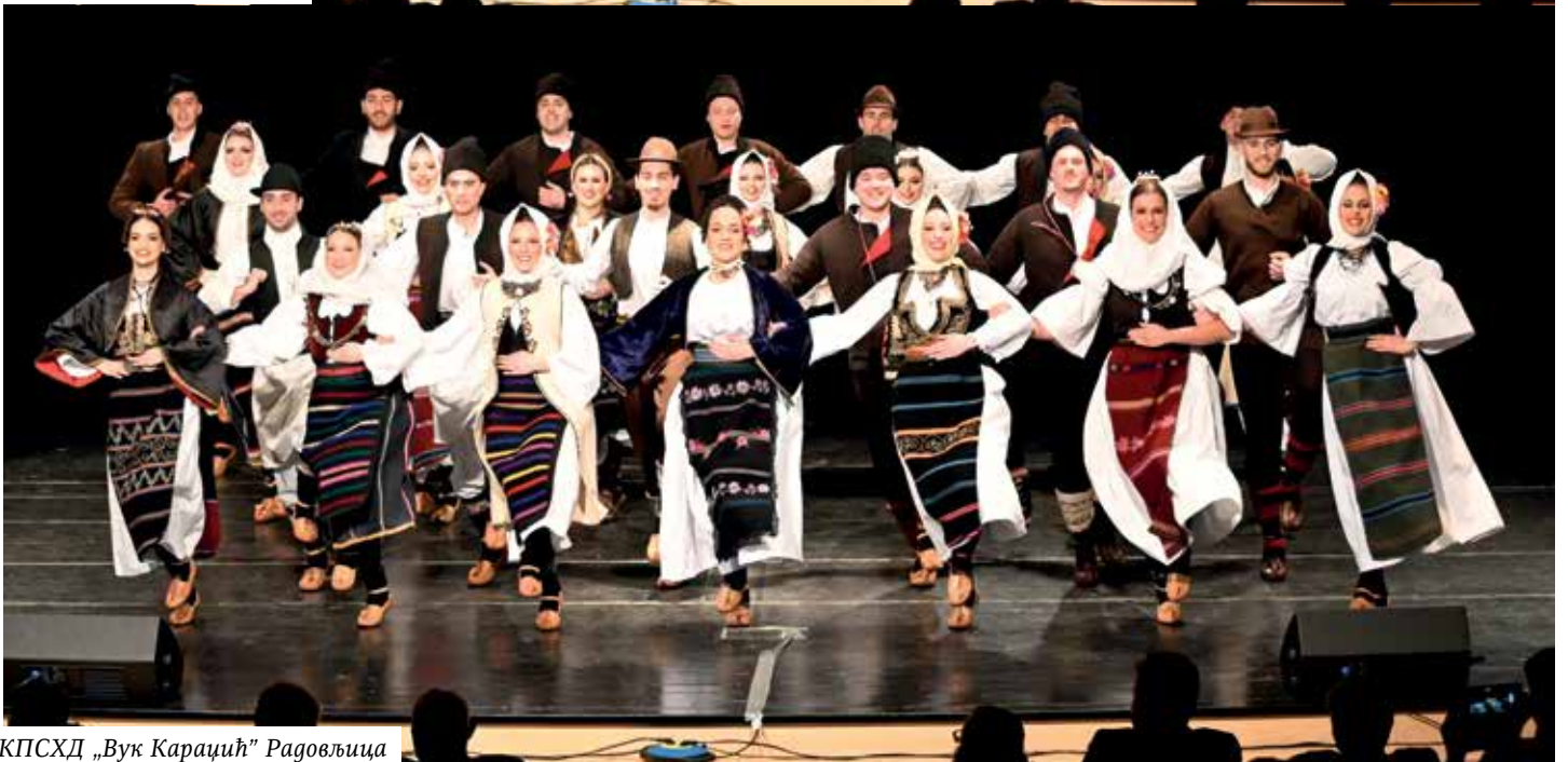
КПСХД „Вук Караџић“ Радовљица