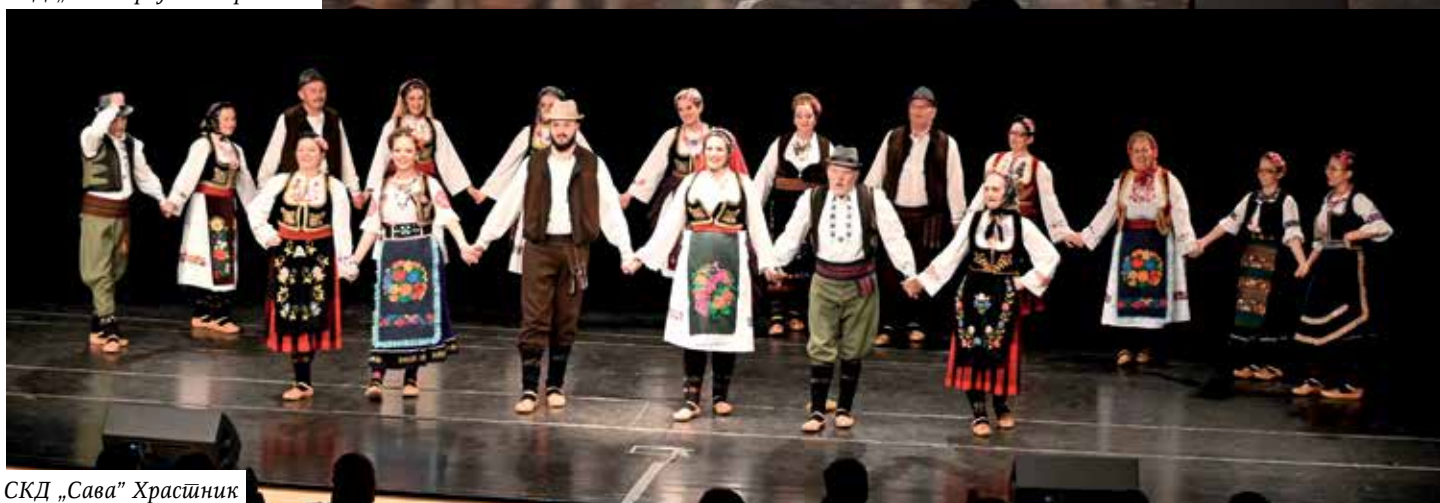
СКД „Сава“ Храсџник