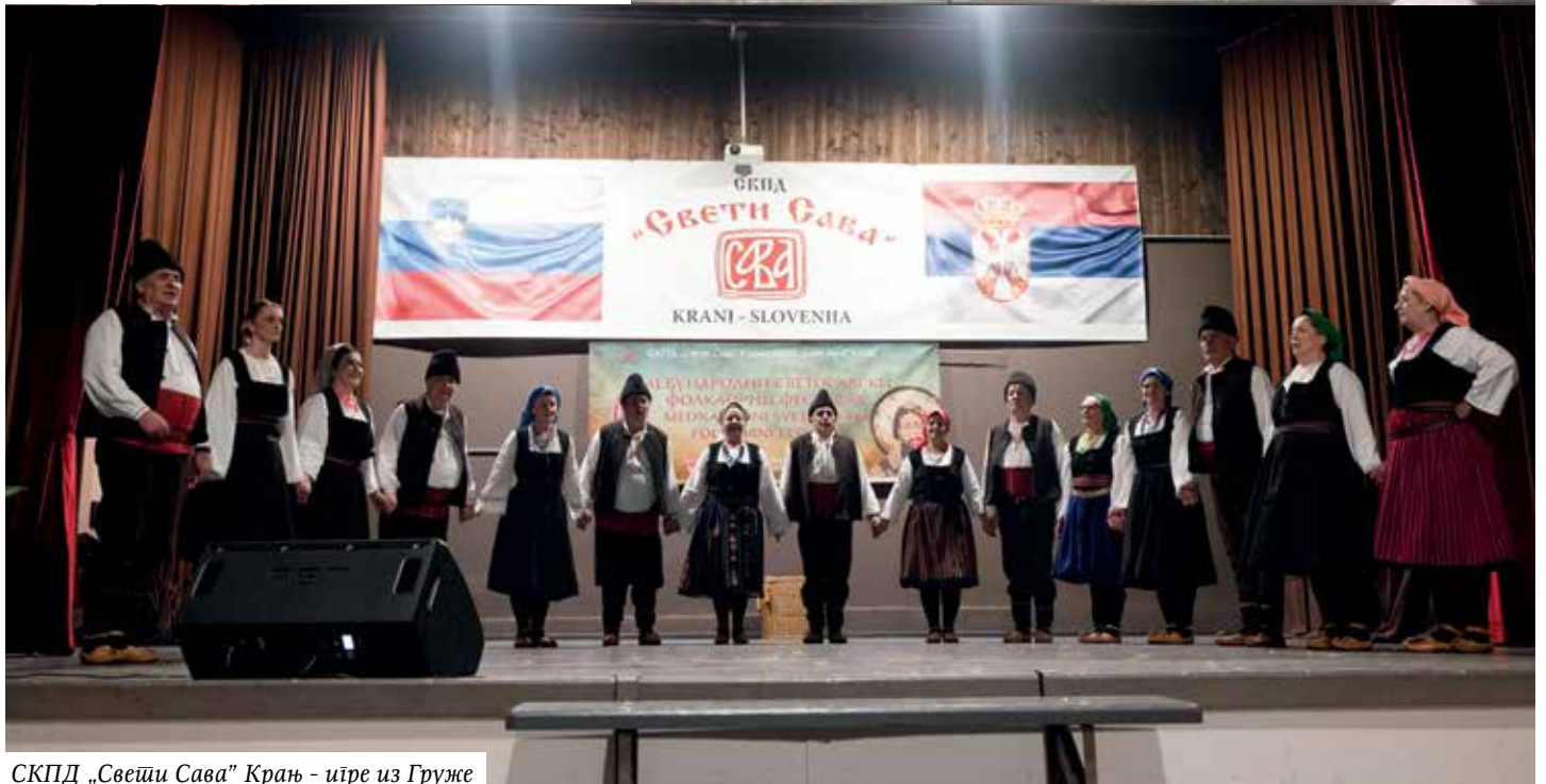
СКПД „Свети Сава“ Крањ - ијре из Грузе