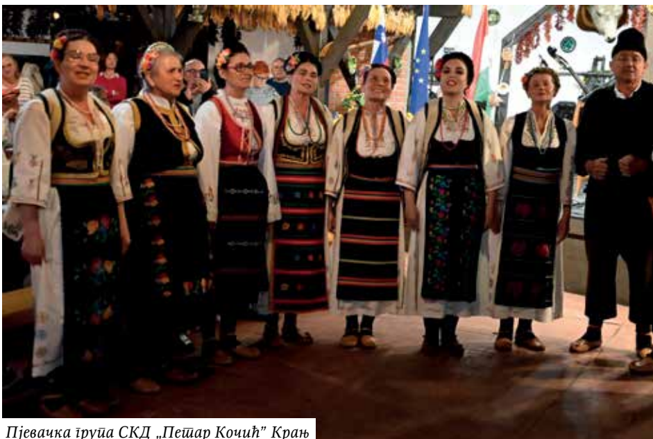
Пјевачка група СКД „Петар Кочић” Крањ

Након тога прешли смо на другу страну Дунава, у Пешту, прошли улицама са старом и занимљивом архитектуром. Посјетили смо још једну велику знаменитост Будимпеште, а то је Трг хероја. Трг хероја (мађ. H sök tere) је један од главних тргова у Будимпешти,