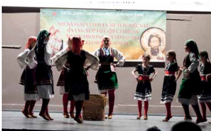
МКД „Св. Кирил и Методија“ Крањ