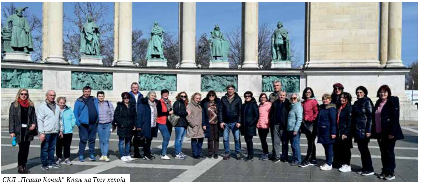
СКД „Петар Кочић” Крањ на Трју хероја