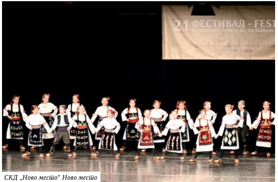
СКД „Ново мeстѝо“ Ново мeстѝо

Кореографијом „Песме и игре из Драгачева“ представили су се фолклораши, чланови извођачког ансамбла, Културно просветног, спортског и хуманитарног друштва „Вук Караџић“ Радовљица. Аутор кореографије