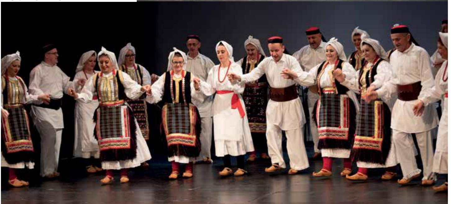
Вешеранска група - ире из Беле Крајине