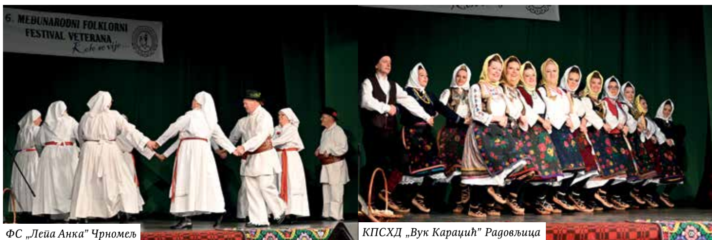
ФС „Лепа Анка“ Чрномељ