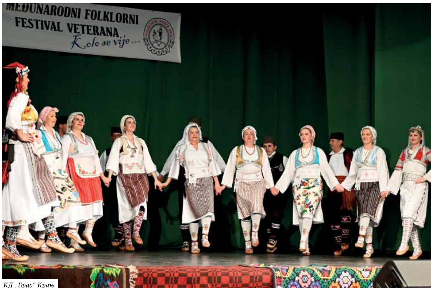
КД „Брдо“ Крањ