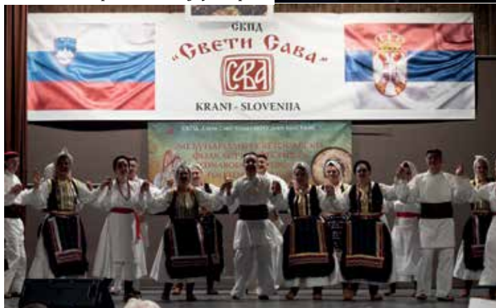
КПСХД „Вук Караџић“ Радовљница