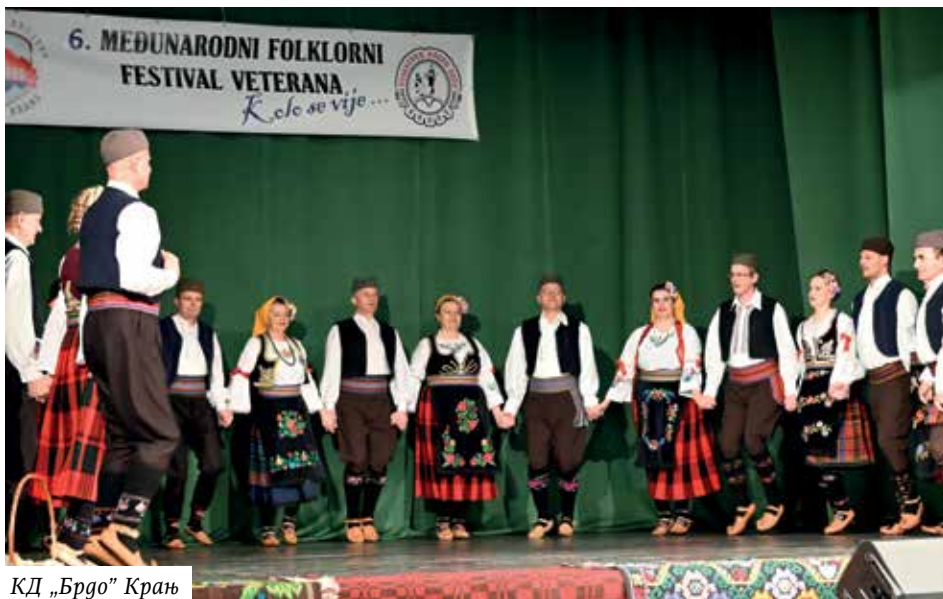
КД „Брдо“ Крањ