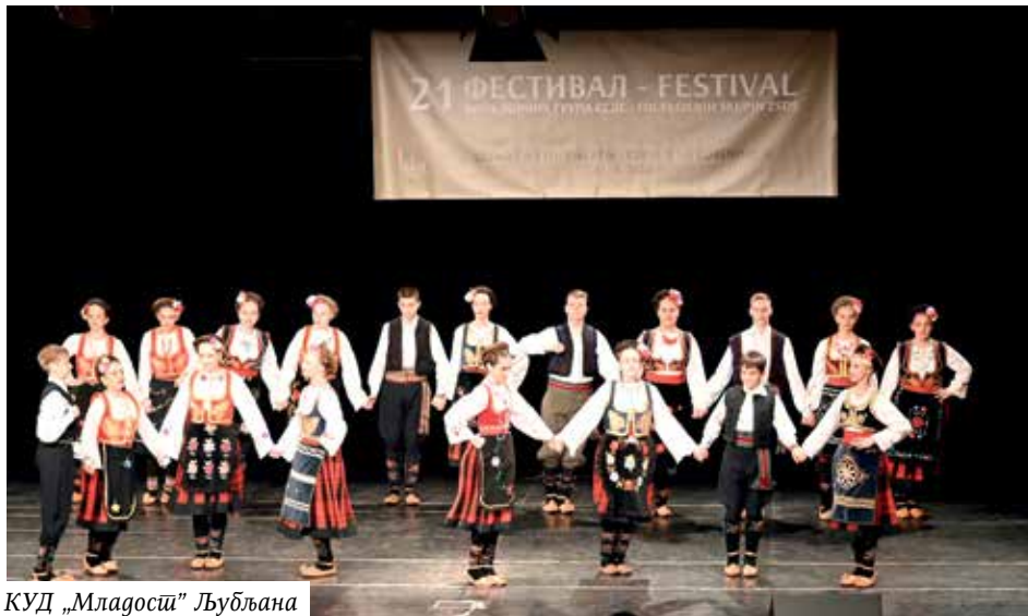
КУД „Младосѝ“ Љубљана