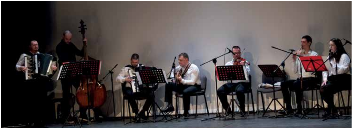
Народни оркестар Банашко Ново Село