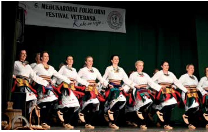
ФС „Врешено“ Коџивна