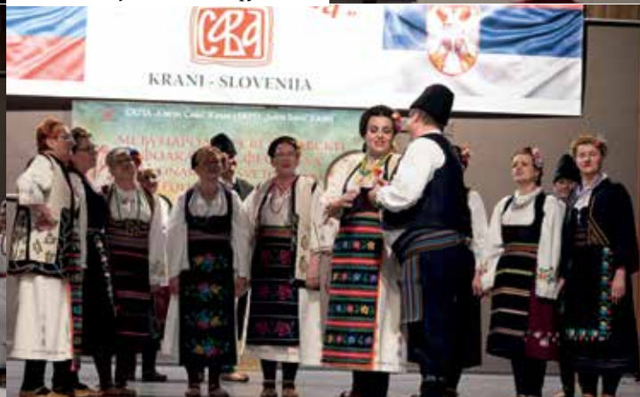
СКД „Петар Коџић“ Крањ