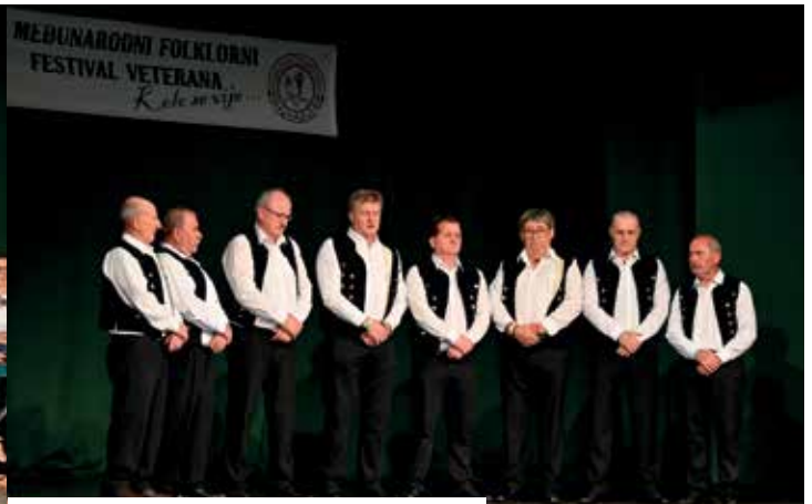
Мушка џевачка група КД „Брдо“ Крањ