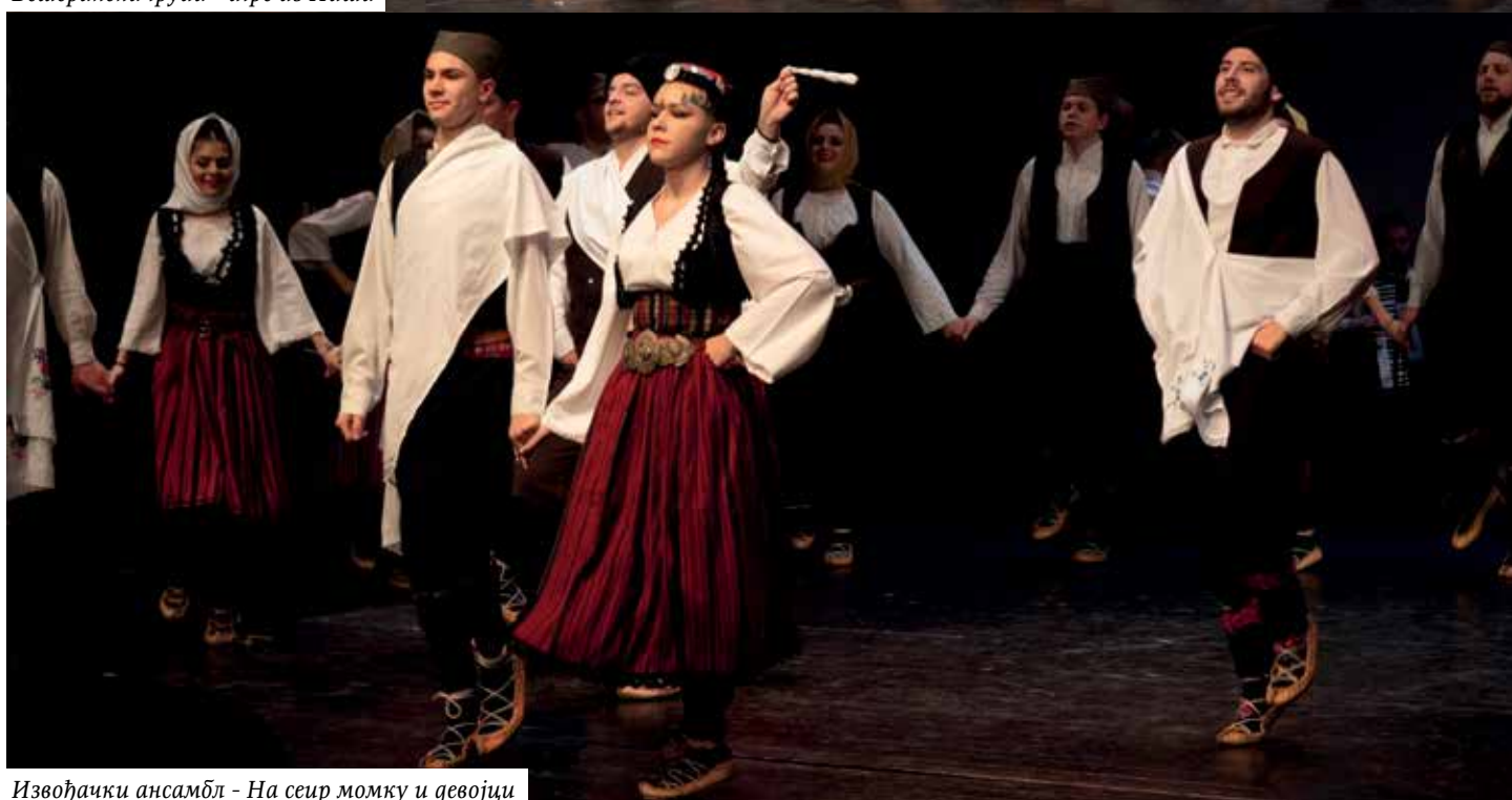
Извођачки ансамбл - На сеир момку и девојци