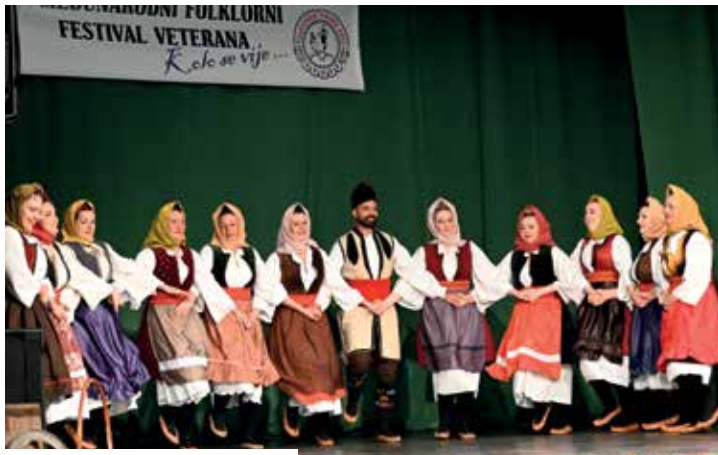
КУД „Коловић“ Градишка