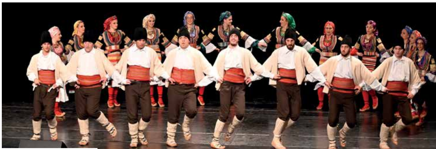
КУД „Бела Крајина“ Чрномељ