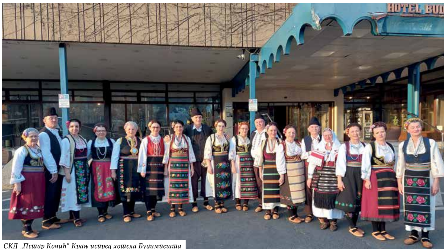
СКД „Пећар Кочић” Крањ испред хошела Будимпешти

У програму су учествовале све фолклорне групе, а неке и са својим пјевачким групама. Иако сам простор није био одговарајући за игру, ипак су се фолклорне групе потрудиле