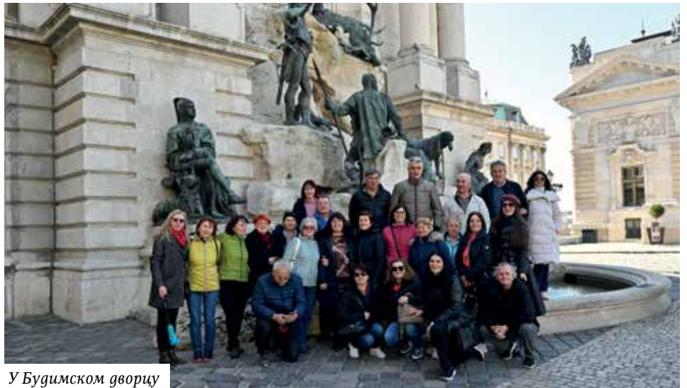
У Будимском дворцу