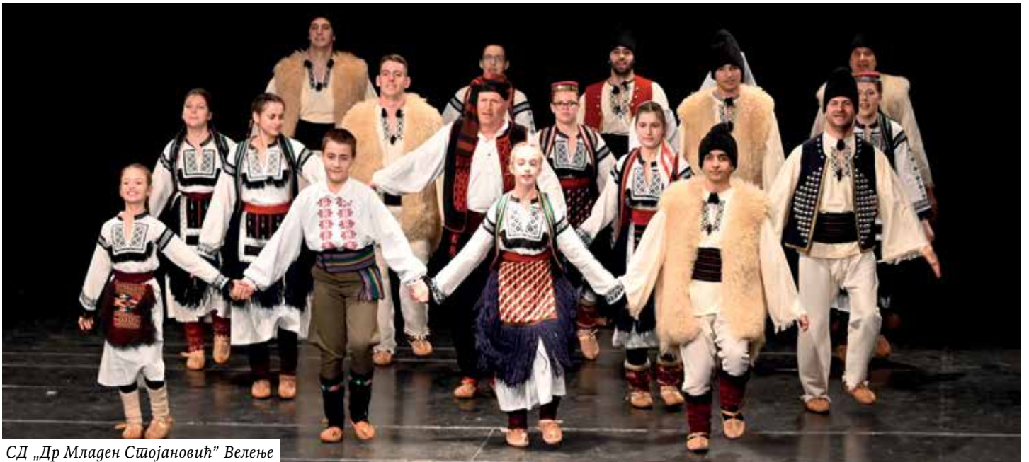
СД „Др Младен Шојановић“ Велење