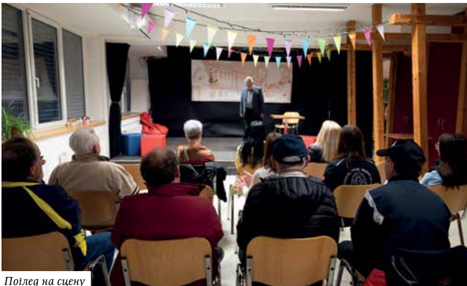
Појед на сцену