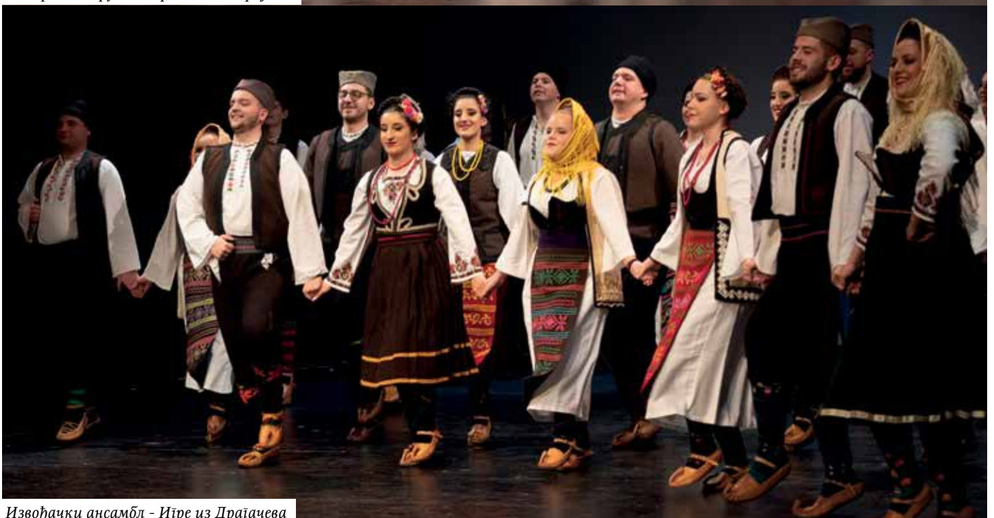
Извођачки ансамбл - Ире из Драгачева