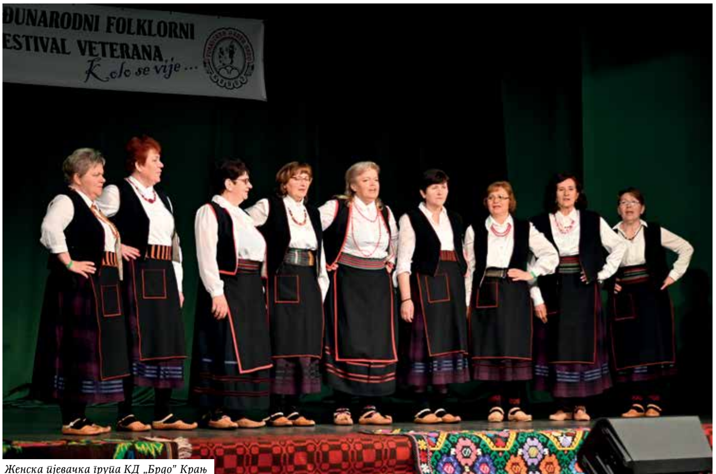
Женска џевачка група КД „Брдо“ Крањ