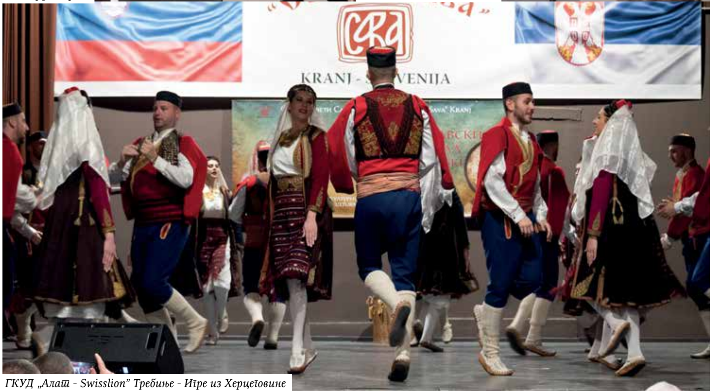
ГКУД „Алаш - Swisliion“ Требиње - Ијре из Херцеговине