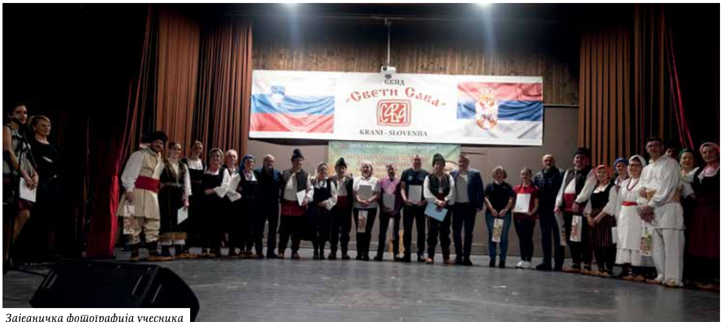
Заједничка фотографија учесника

Посебну пажњу публике изазвао је наступ гостију из Републике Српске, чланова Градског културно умјетничког друштва „Алат - Swisslion“ из Требиња који су приказали игре из Херцеговине, које су на публику оставиле веома јак утисак. Из Херцеговине игром и пјесмом отишло се до ужичког краја, а ветеранска група Српског културног друштва „Петар Кочић“ одиграла је игре из Ужица.