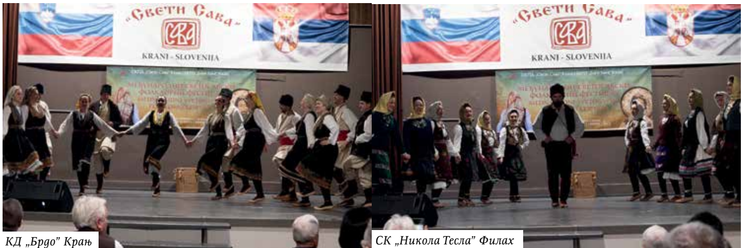
КД „Брго“ Крањ