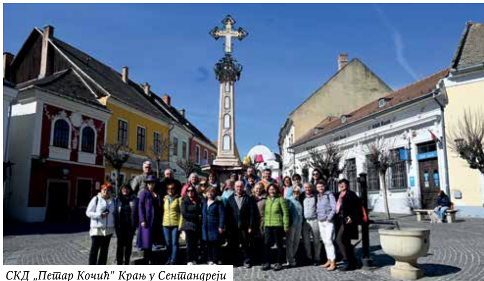
СКД „Пећар Кочић” Крањ у Сентандреји

Нажалост, нисмо имали прилику да посјетимо цркве, а како смо сазнали у Музеју српске православне цркве, за посјету