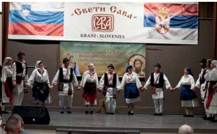
ХКУД „Комушина“ Шкофја Лока