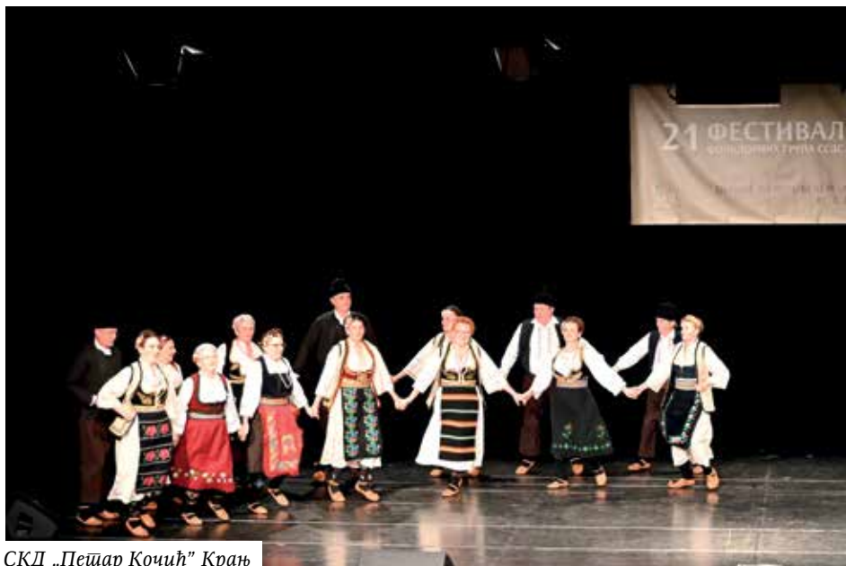
СКД „Пеѝар Кочѝћ“ Крањ