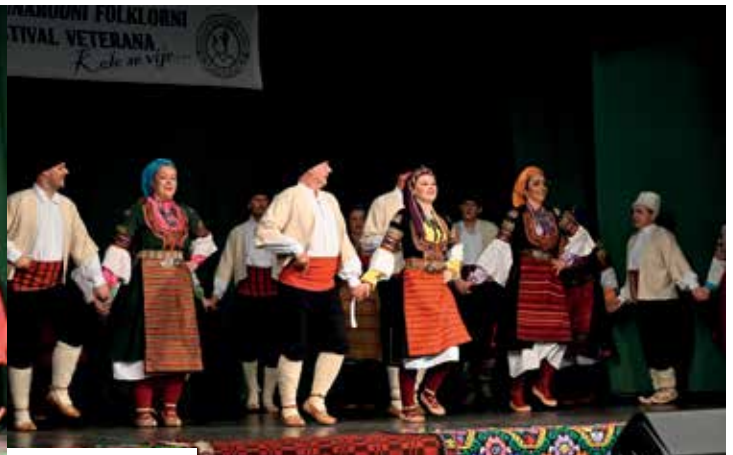
КД „Брдо“ Крањ