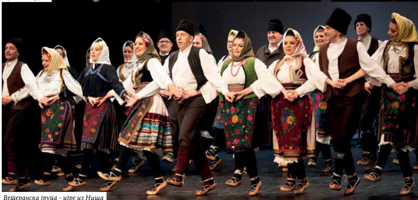
Вешеранска група - ире из Ниша