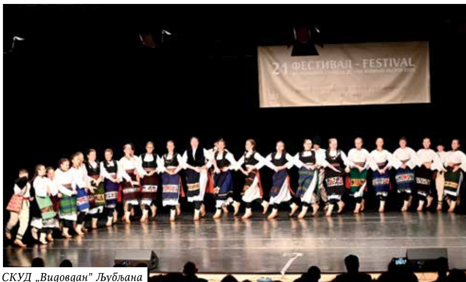
СКУД „Видовдан” Љубљана