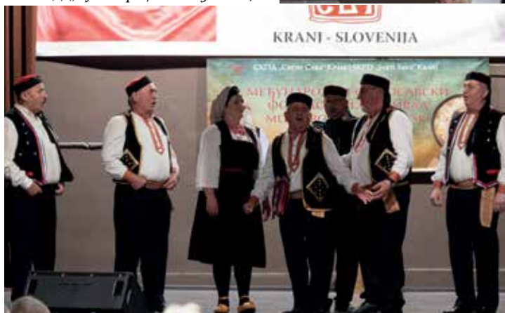
Пјевачка група СКПД „Свети Сава“ Крањ