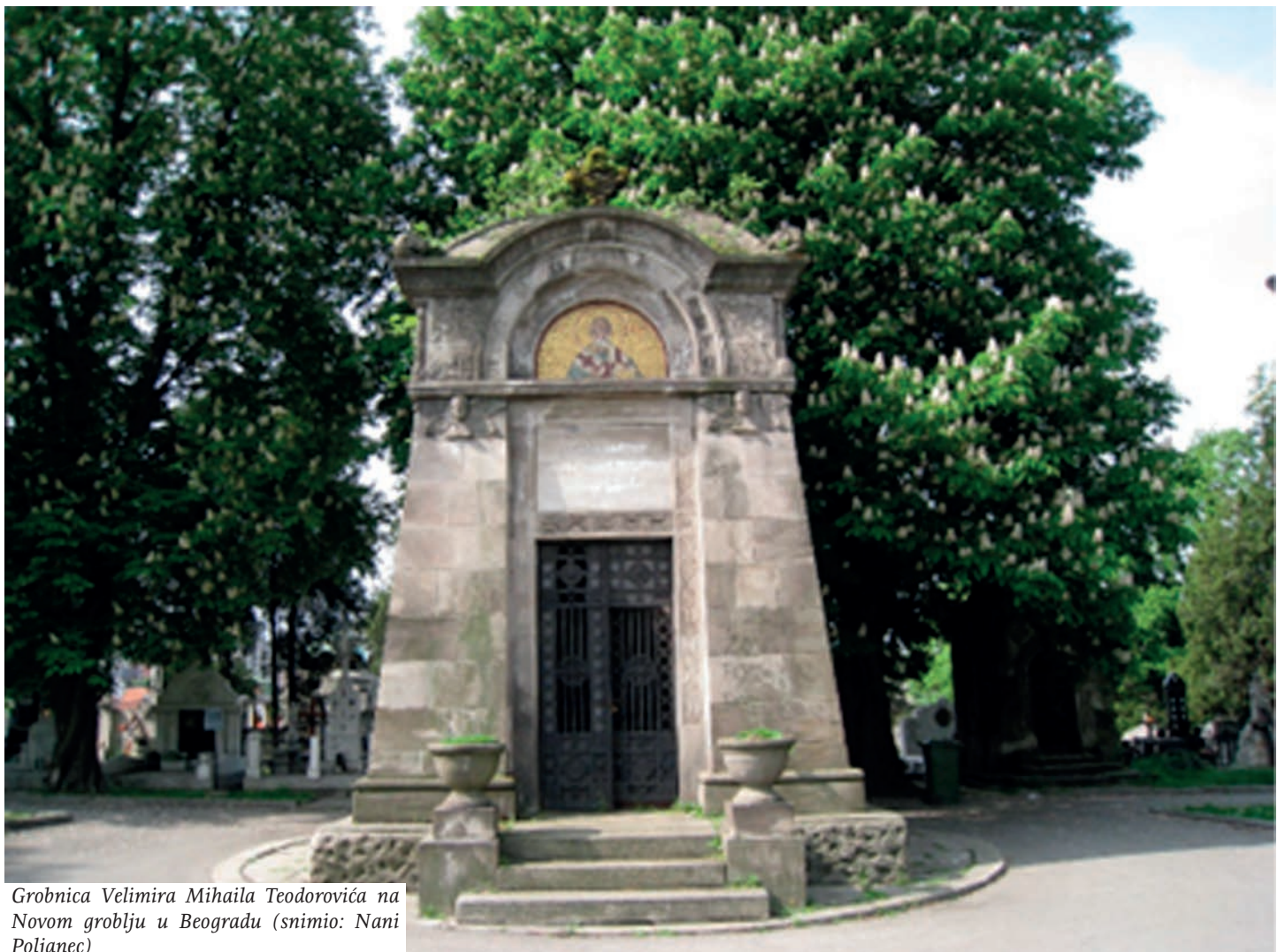
Grobnica Velimira Mihaila Teodorovića na Novom groblju u Beogradu

je u vreme poseta srpskih vladara u XIX i XX veku u Rogašku Slatinu dolazilo na stotine gostiju iz Srbije, najviše iz Beograda. To je svakako preporuka i za današnji provod godišnjeg odmora u ovom slovenskom gradiću, u kome se može istraživati i manje poznata istorija naša dva naroda.