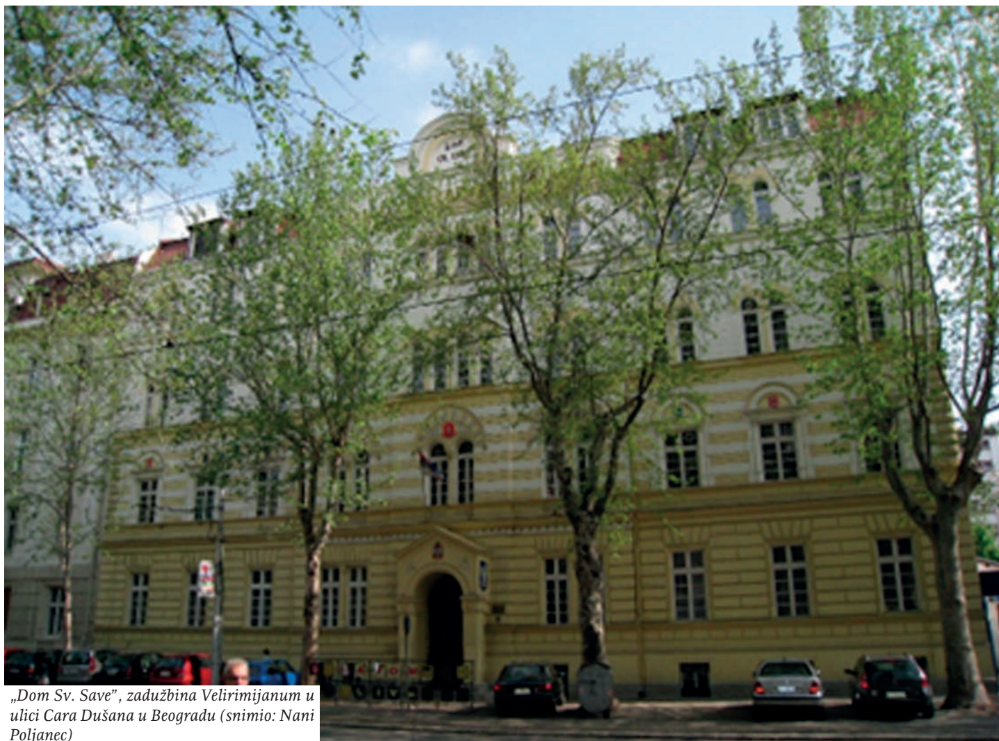
„Dom Sv. Save”, zadužbina Velimirijanum u ulici Cara Dušana u Beogradu