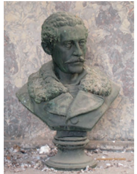
Poprsje Velimira Mihaila Teodorovića na Novom groblju u Beogradu, sadašnje (žalosno) stanje

On je bio prepoznatljiv po svojoj beretki i po čuvenim partijama šaha. Iz ovih podataka je vidljivo da je Rogaška Slatina bila od davnih vremena čuvena banja i znak prestiža. Tako