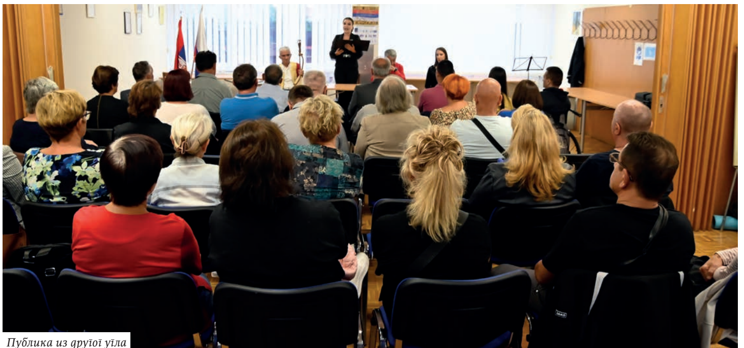
Публика из групој уила

Она нам је често омогућена по логици ствари, да сваки човек треба да буде слободан и самосталан. Кад смо највише слободни и задовољни увек треба да имамо у себи изграђен осећај да слобода има своја ограничења, своје лице и налице.