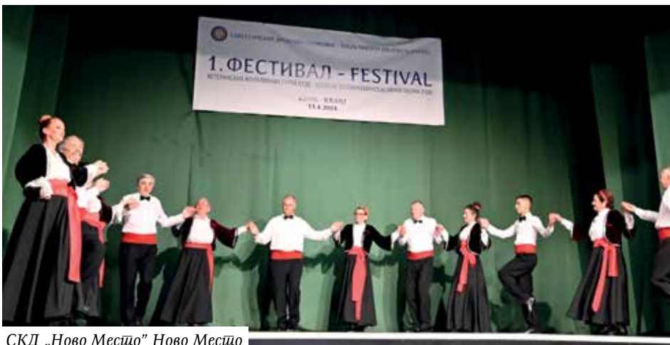
СКД „Ново Месџо” Ново Месџо