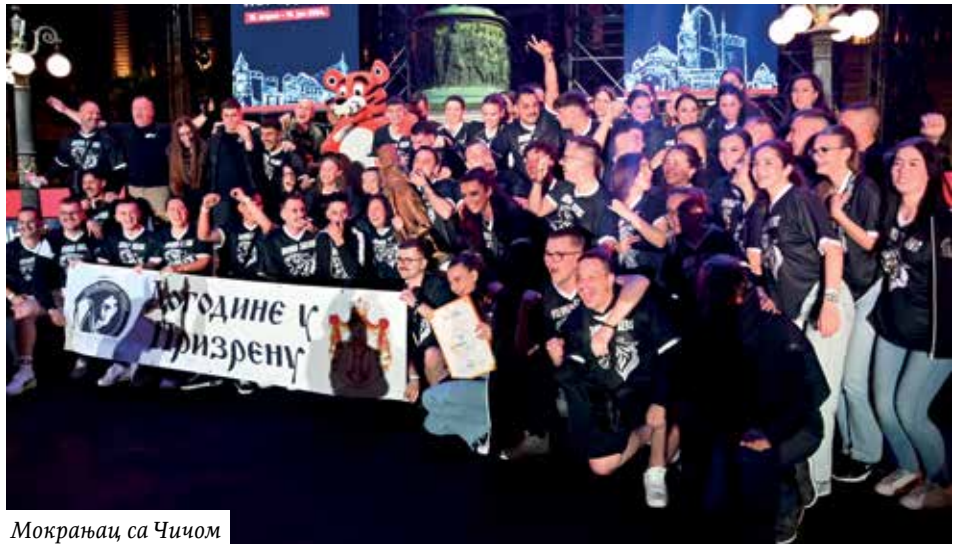
Мокрањац са Чичом

Мокрањац" Беч („Догодине у Призрену" – 100,00 бодова), КУД „Бисери" Дранси („Омиле ми у селу девојче" – 99,133), КУД „Вук Стефановић Караџић" Роршах („Лесковачки коледари" – 98,867), КСД „Бамби" Беч („Било једном у Осипаоници" – 98,433, СЗ „Извор Ној Изенбург („Нунта ин Исаково" – влашке игре из околине Ђуприје – 97,4), КУД „Рас" Луцерн („Насред село тапан чука" – 97,3), СЦ Штутгарт („Сабор у Лесковачкој Морави" – 97,233), КУД „Југос" Минхен („Рајачки првенац" – 97,167) СКД „Завичај" Клагенфурт („Пође дуде за воду" – 96,833) и СКУД „Видовдан" Љубљана („Ајде Радо да легамо" – 96,5 бодова).