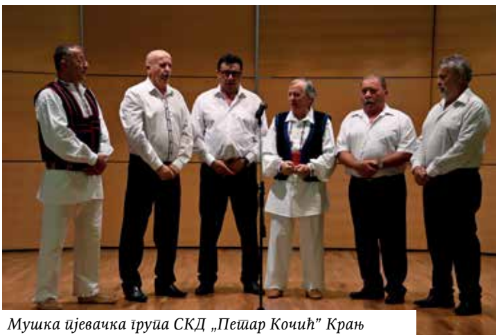
Мушка ђевачка група СКД „Пешир Кочић“ Крањ