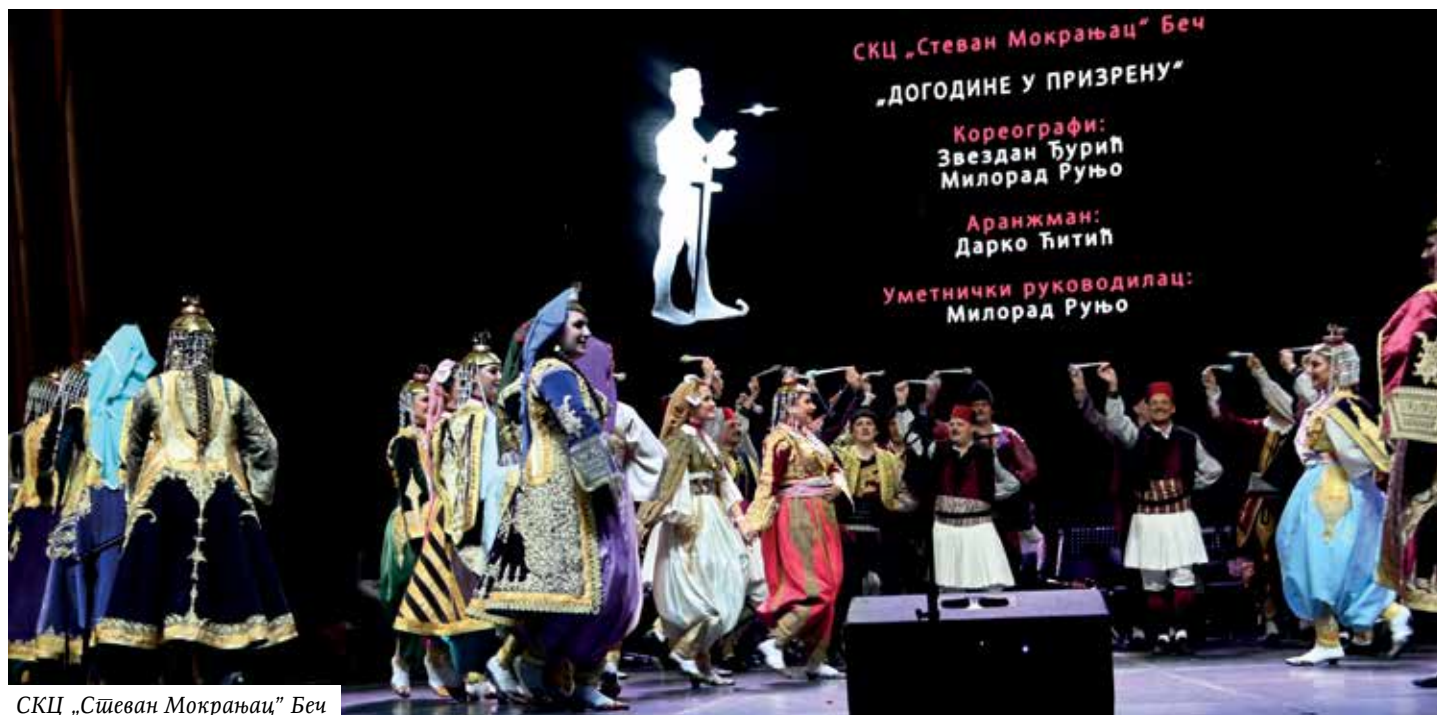
СКЦ „Стеван Мокрањац” Беч