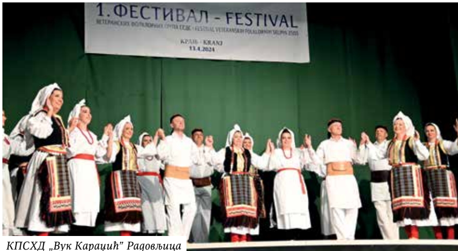
КПСХД „Вук Караџић” Радовљица

Од Беле Паланке отишло се игром и пјесмом на запад Србије, тачније у ужички крај, а за то су се побринули чланови ветеранске фолклорне групе Српског културног друштва „Петар Кочић” из Крања, који су се представили кореографијом под називом „Недељом ми долазио Миле” – Игре и пјесме из