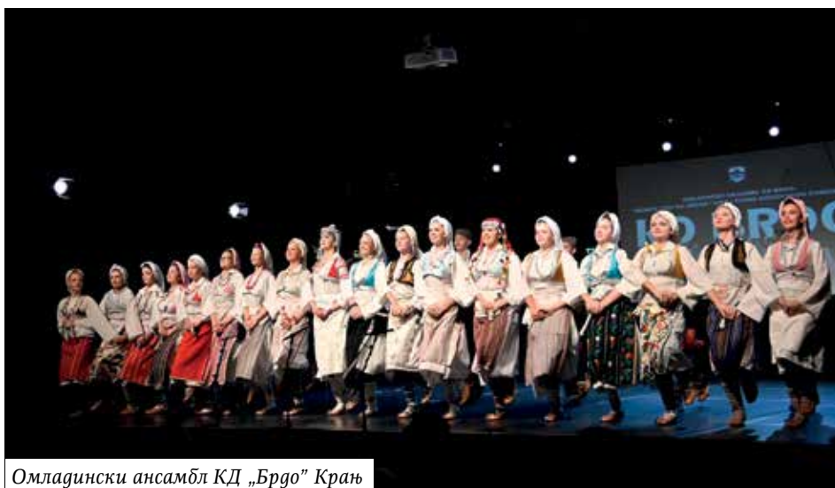
Омладински ансамбл КД „Брдо“ Крањ