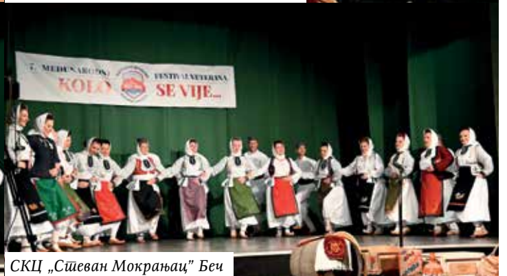
СКЦ „Сшеван Мокрањац” Беч