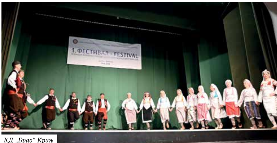
КД „Брдо” Крањ