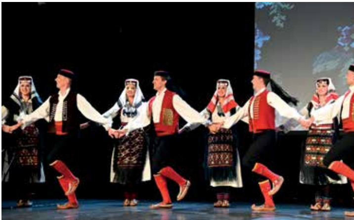
Игре из Подгумеча