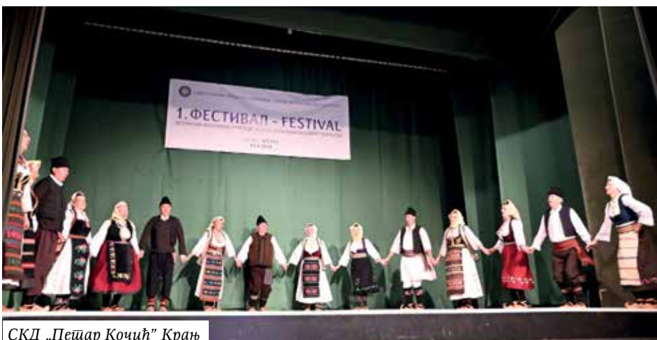
СКД „Пеџар Кочић” Крањ