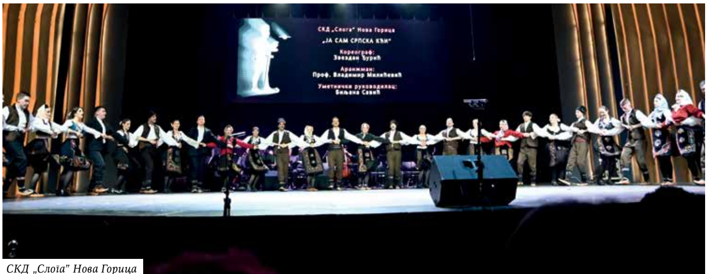
СКД „Слога” Нова Горица