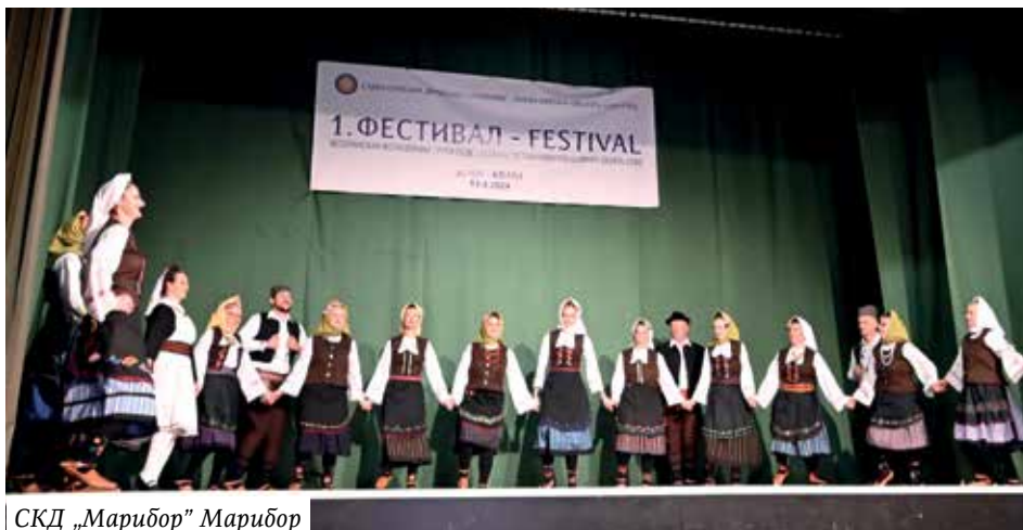
СКД „Марибор” Марибор