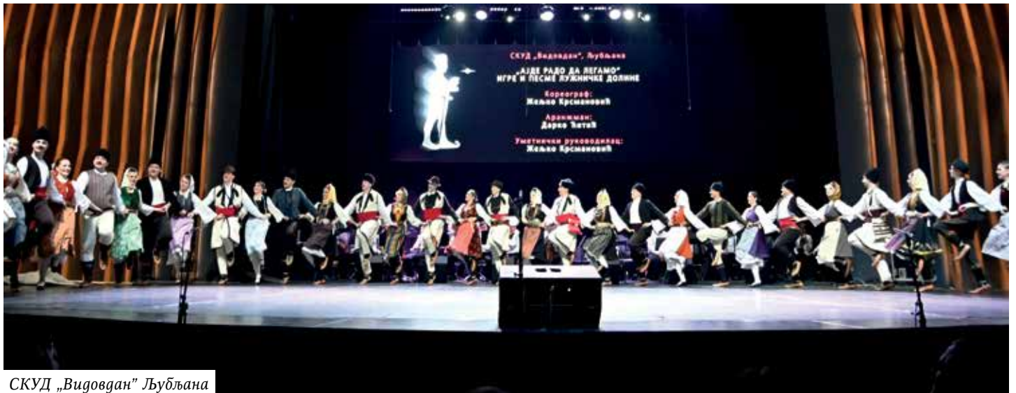
СКУД „Видовдан“ Љубљана