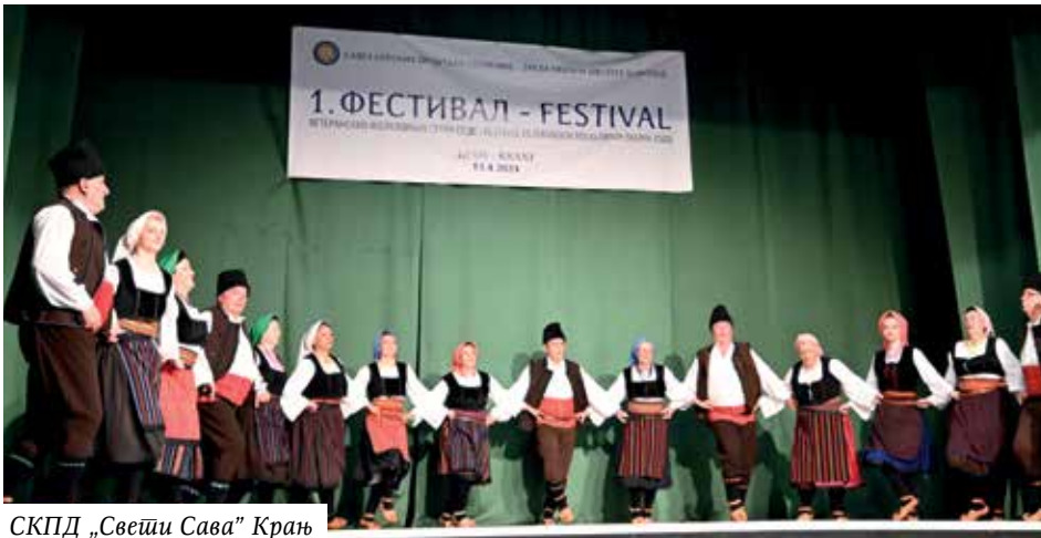
СКПД „Свети Сава” Крањ