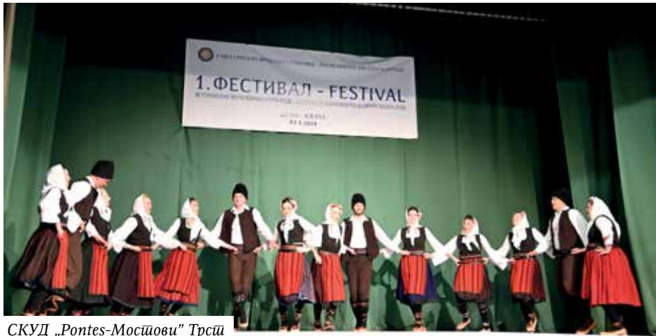
СКУД „Pontes-Mosijови” Трсци