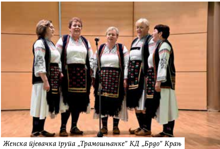
Женска ђевачка група „Трамошњанке“ КД „Брдо“ Крањ