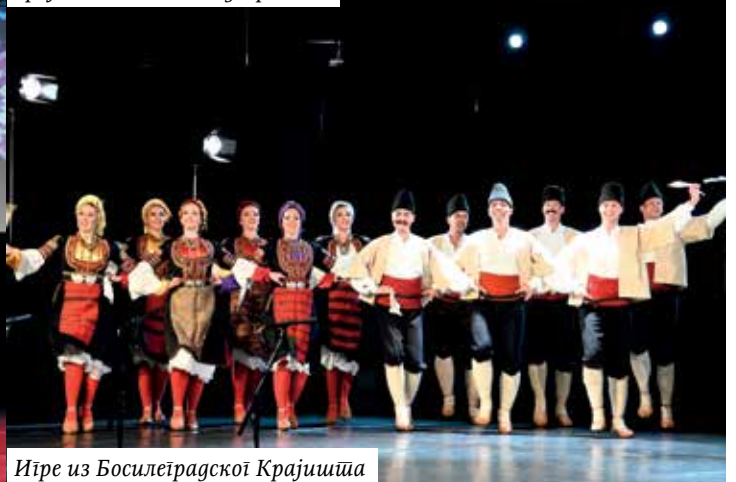
Игре из Босилеградској Крајиштини