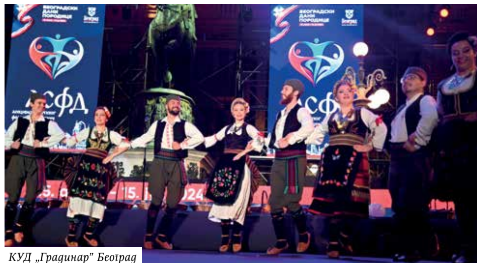
КУД „Градинар" Београд