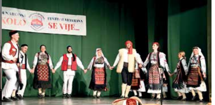
КУД „Уна” Нови Град