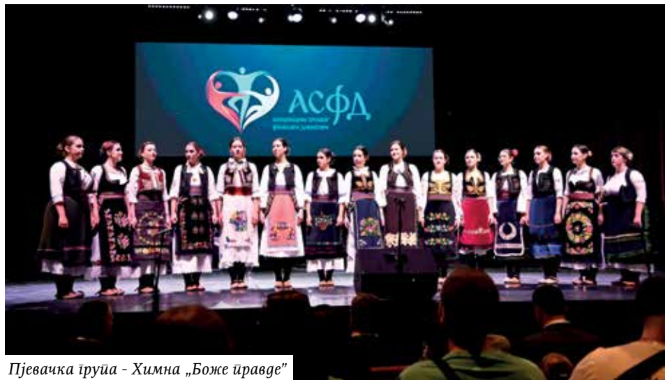
Пјевачка група - Химна „Боже правде”

У другом блоку, другог такмичарског дана учествовали су: КУД „Завичај” Винтертур, Швајцарска, КСД „Бамби” Беч, Аустрија; КУД „Југос” Минхен, Њемачка; СКУД „Петар Кочић” Солотурн, Швајцарска; КУД „Дрина” Аугсбург, Њемачка и Српска заједница „Извор” Нови Изенбург, Њемачка.