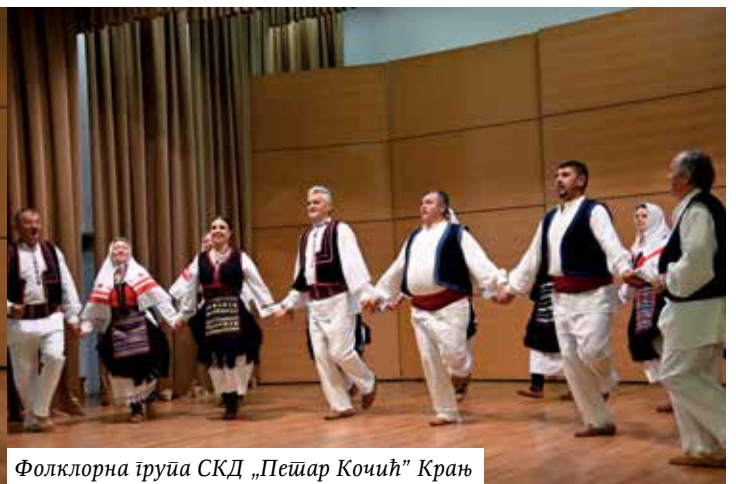
Фолклорна група СКД „Пешир Кочић“ Крањ