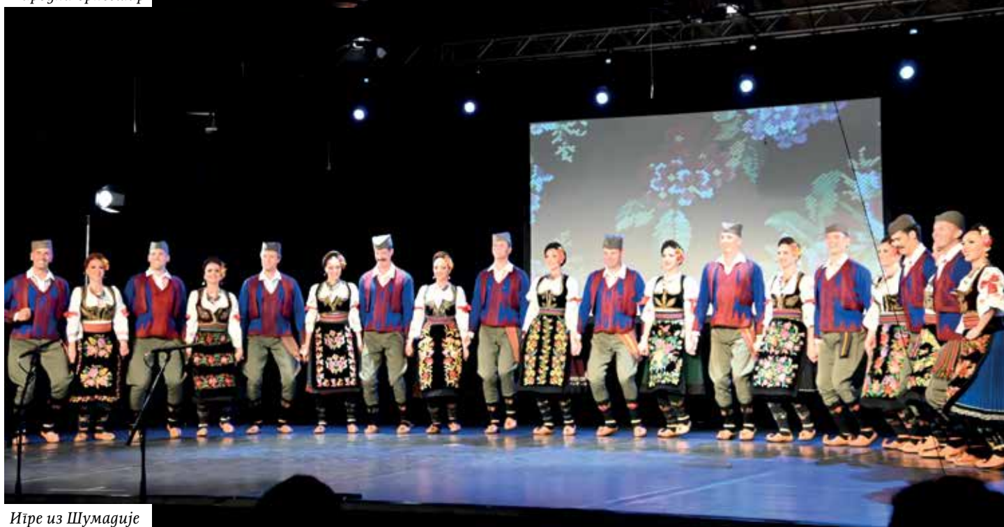
Игре из Шумадије

Прије самог наступа фолклораша Националног ансамбла „Коло” Београд на сцену је ступио Омладински ансамбл Културног друштва „Брдо” из Крања који је одиграо кореографију „Момче седи на брега” – Игре и песме Косовског Поморавља, а затим су фолклораша Националног ансамбла „Коло” Београд одиграли су следеће кореографије: „Висок пенцер, а ја цура мала” – песма забележена од српског становништва у западној Славонији; – „Игре из Беле Крајине” – игре из околине Чрномeља; – „Игре из западне Србије”; – „Озрен гору, пови’ брду гране” – српске игре са Озрена; – „Игре из Подгрмеча”; – „Влашке игре”; – „Игре из Биначке Мораве”; – „Тројно” – чобанско надигравање из источне Србије; – Сплет традиционалних мелодија у извођењу народног оркестра; – „Кој ми те пита” – песма из Велике Хоче, Косово и Метохија; – „Игре из Босилеградског Крајишта”.