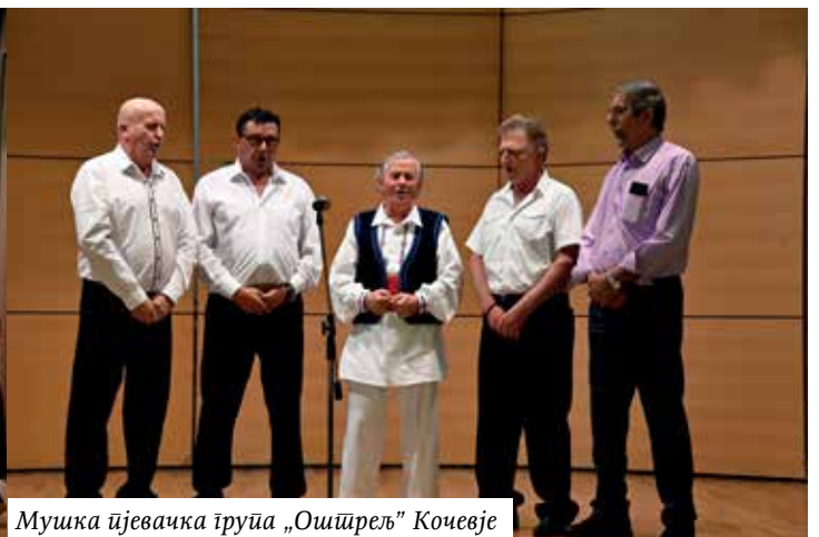
Мушка ђевачка група „Ошџрељ“ Кочевје