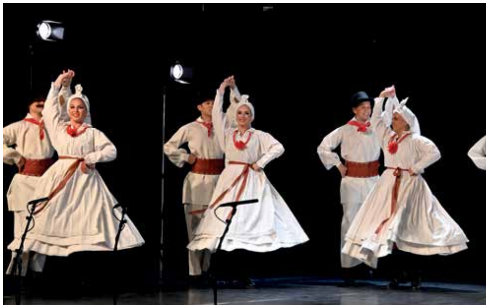
Игре из Беле Крајине - околина Чрномeља