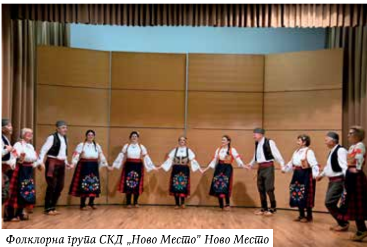
Фолклорна група СКД „Ново Месџо“ Ново Месџо