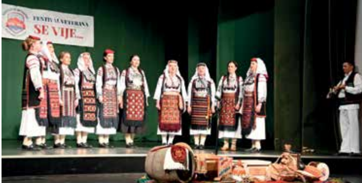
КУД „Уна” Нови Град - Женска пјевачка група