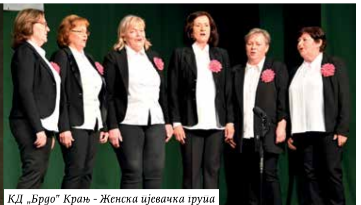
КД „Брдо” Крањ - Женска пјевачка група