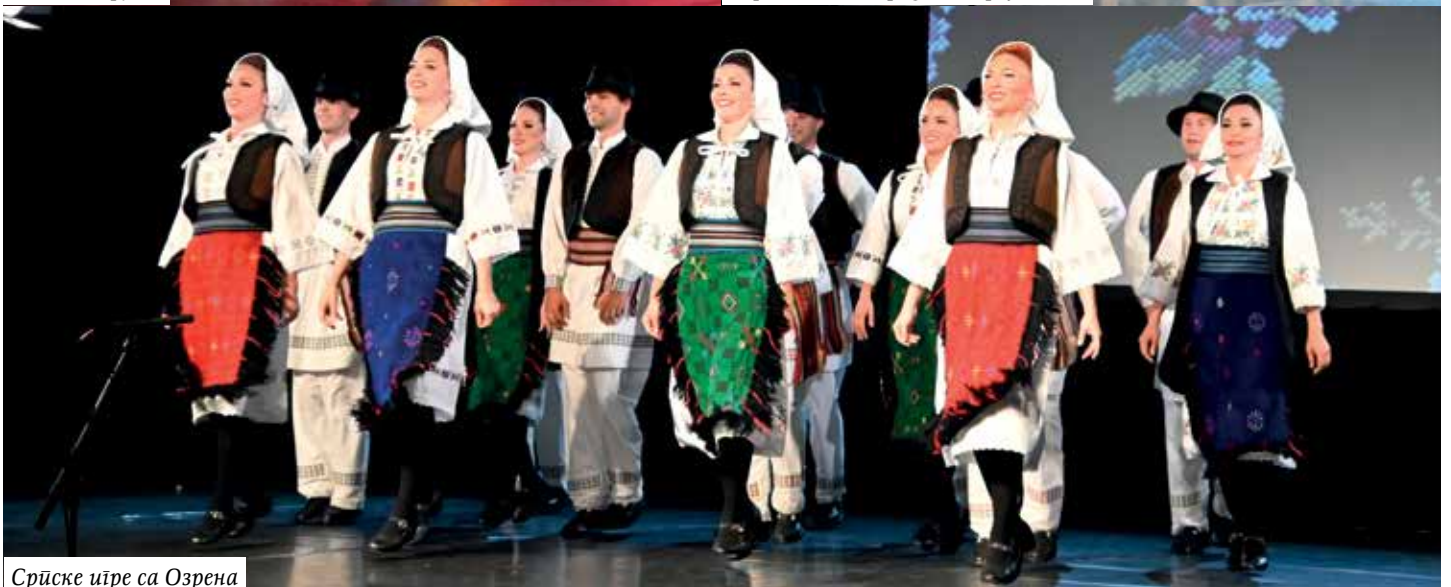
Српске игре са Озрена