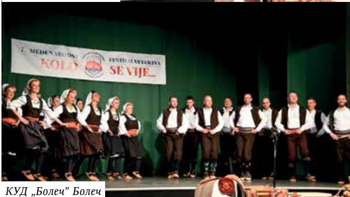
КУД „Болец” Болец