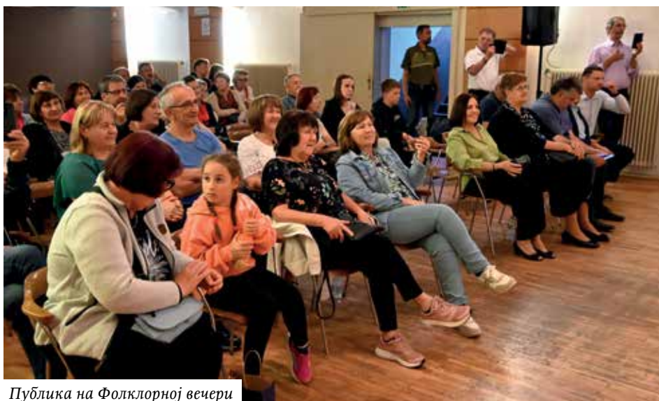
Публика на Фолклорној вечери