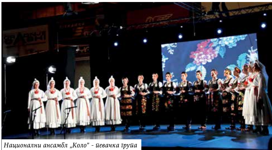
Национални ансамбл „Коло“ - њевачка трија