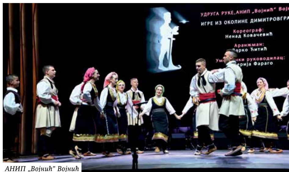
АНИП „Војнић" Војнић