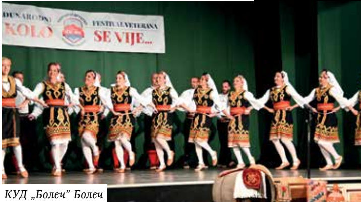
КУД „Болец” Болец