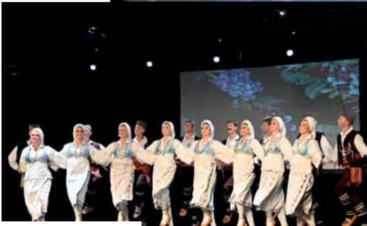
Игре из Биначке Мораве