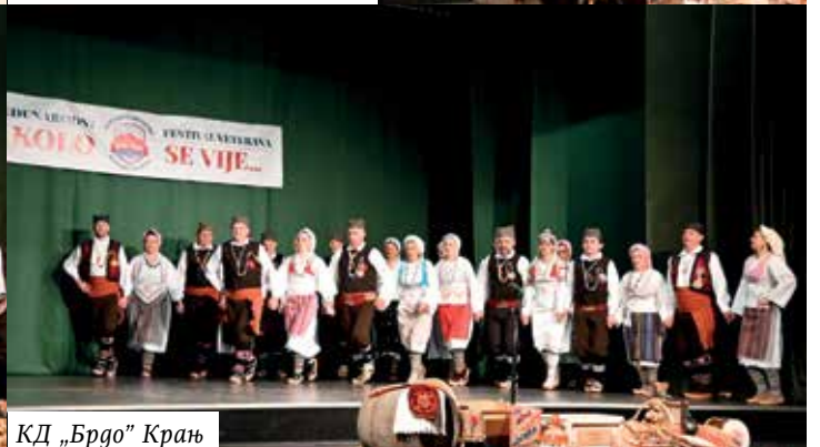
КД „Брдо” Крањ