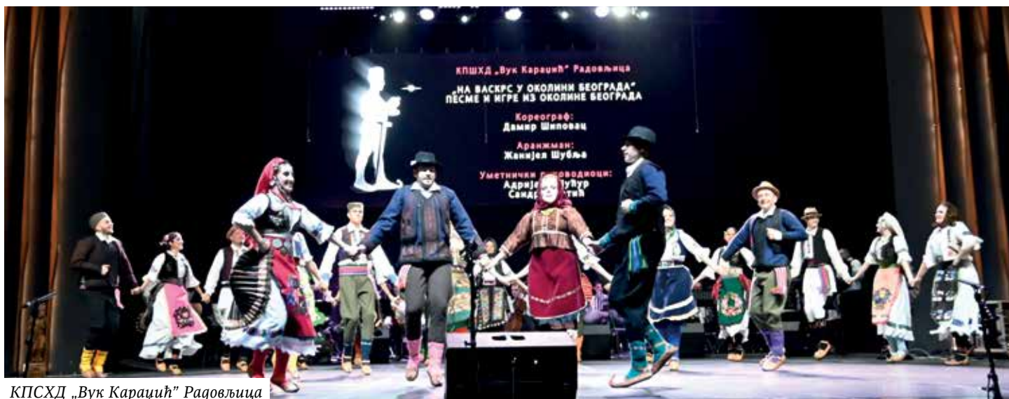
КПСХД „Вук Караџић” Радовљаница