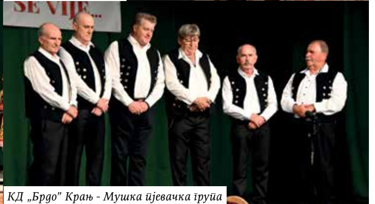
КД „Брдо” Крањ - Мушка пјевачка група