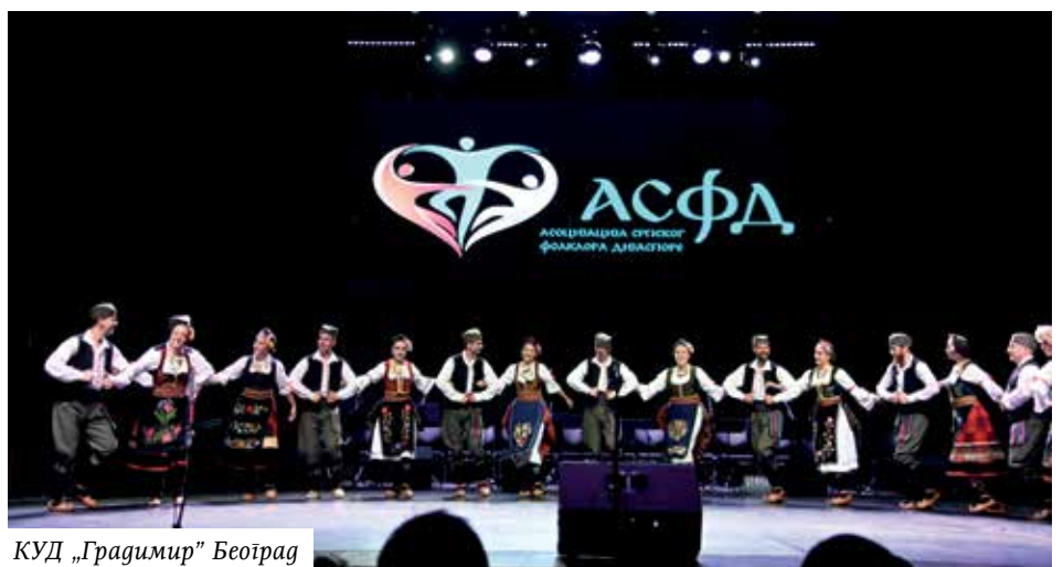
КУД „Градимира” Београд

У трећем блоку, другог такмичарског дана, учествовали су: КУД „Јединство” Беч, Аустрија; КУД „Слога” Цирих, Швајцарска, КУД „Зора” Ратингер, Њемачка; СКУД „Младост” Хамбург, Њемачка, КУД „Бисери” Дранси, Француска и КУД „Вук Стефановић Караџић” Роршах, Швајцарска.