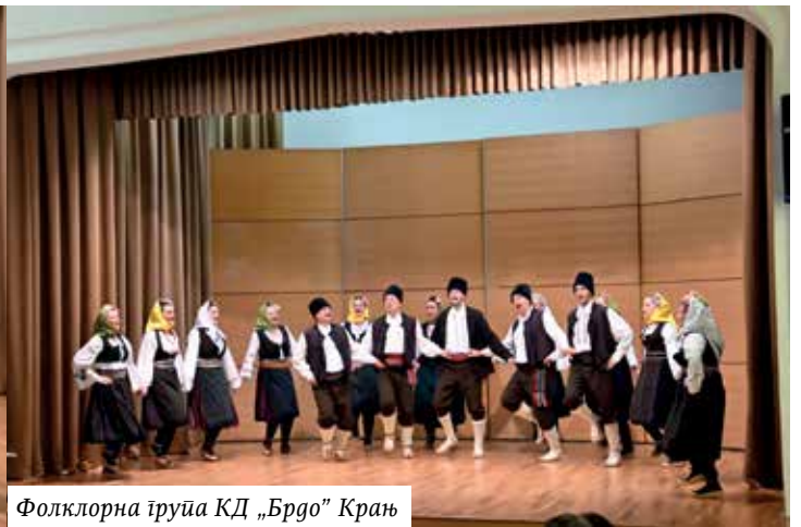
Фолклорна група КД „Брдо“ Крањ