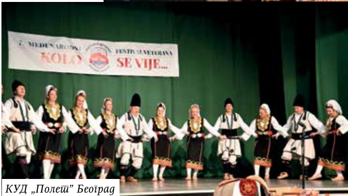
КУД „Полеј” Београд