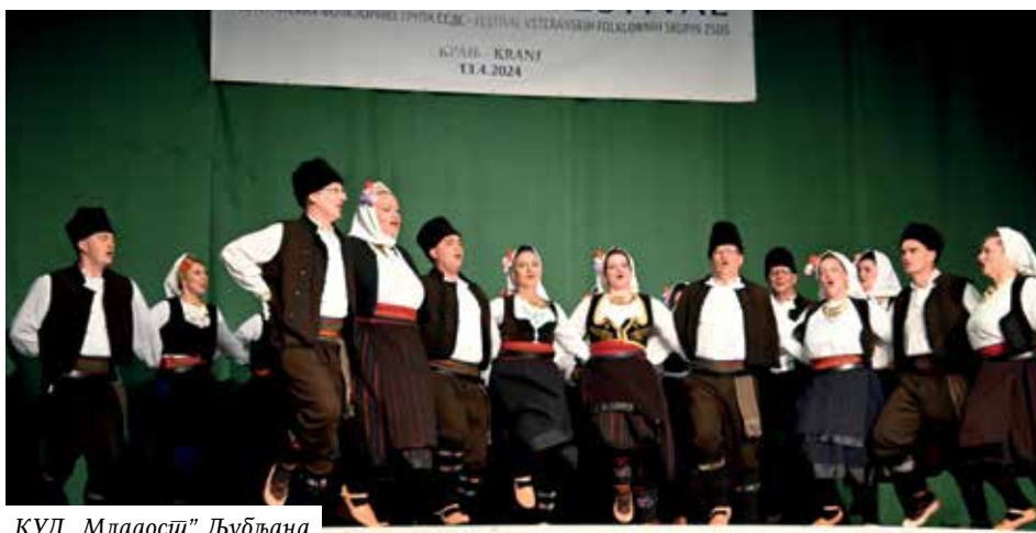
КУД „Младоси” Љубљана