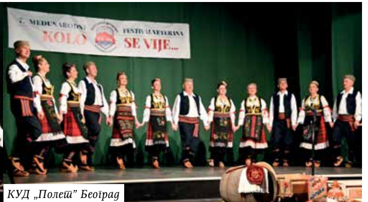
КУД „Полеј” Београд