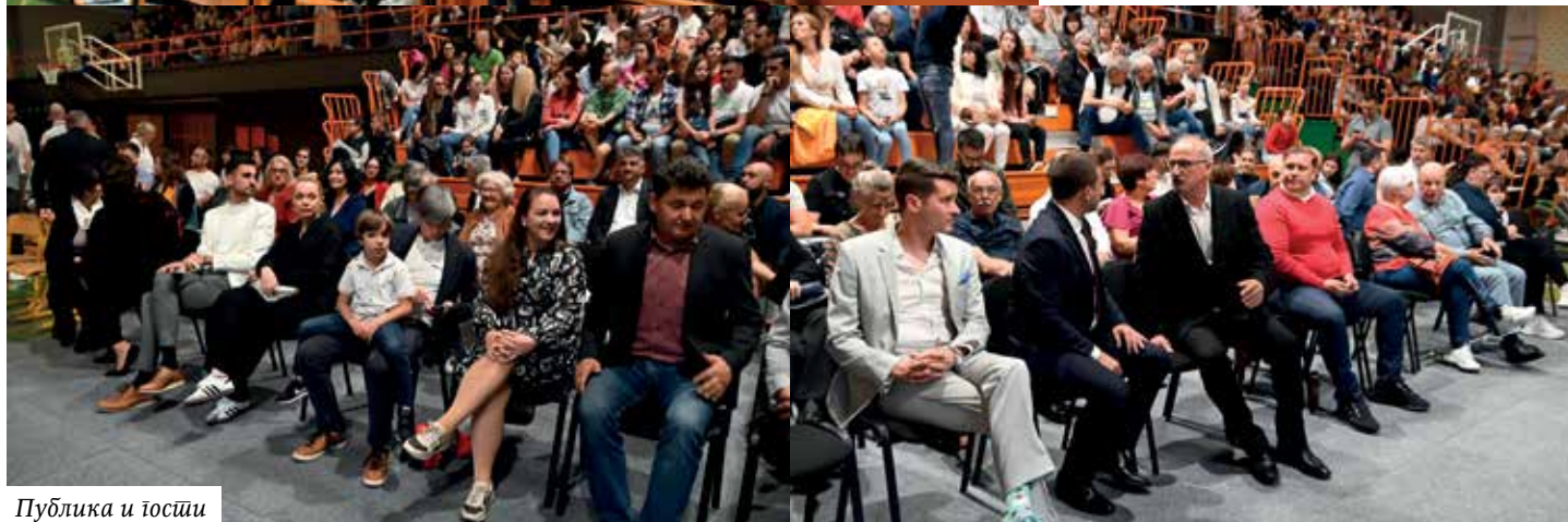
Публика и јосици