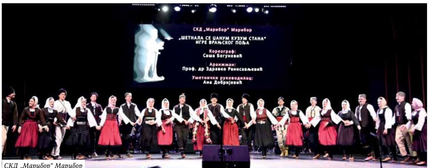
СКД „Марибор” Марибор