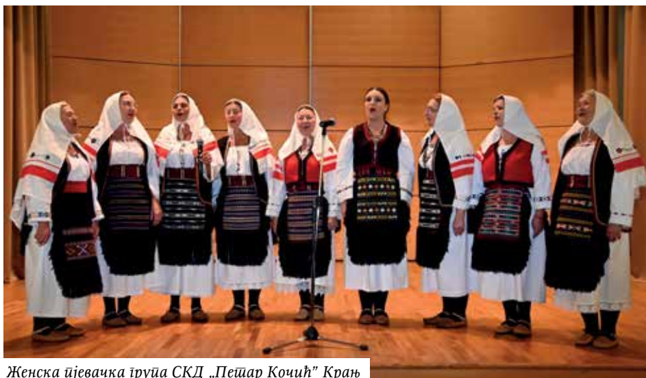
Женска пјевачка група СКД „Петар Кочић“ Крањ