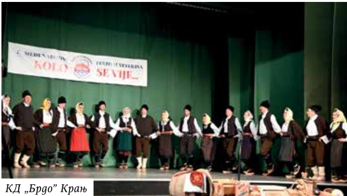
КД „Брдо” Крањ