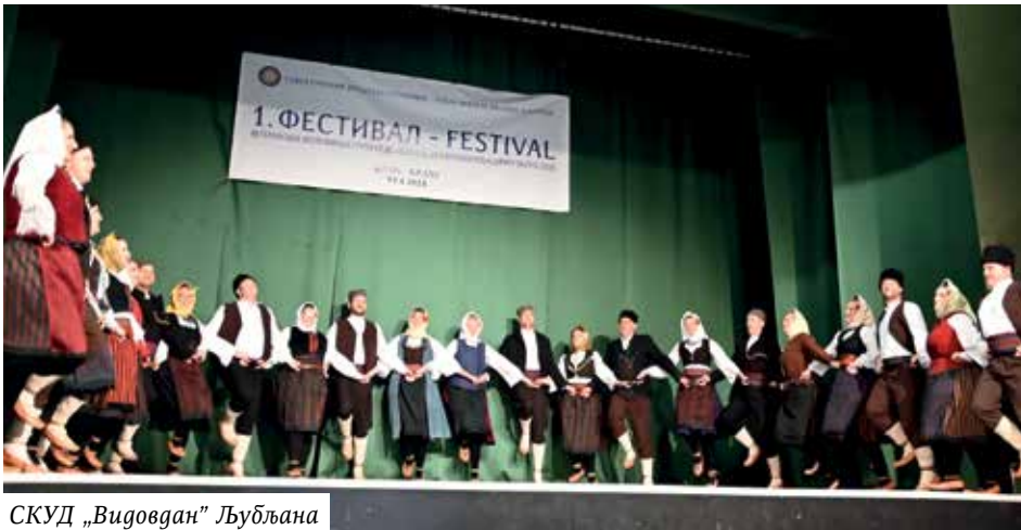
СКУД „Видовдан” Љубљана