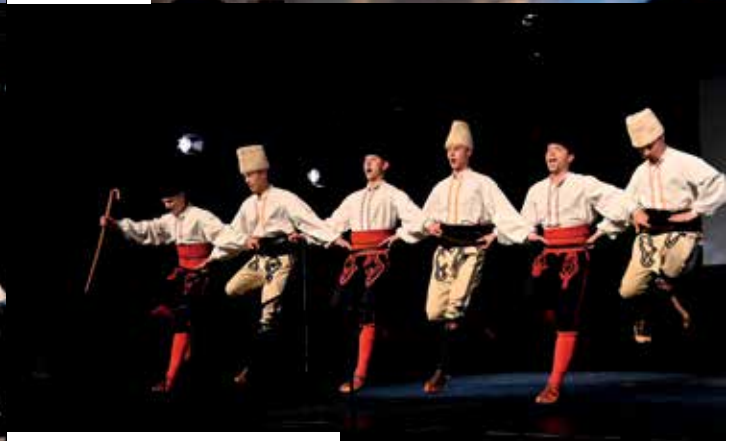
Тројно - чобанско надигравање