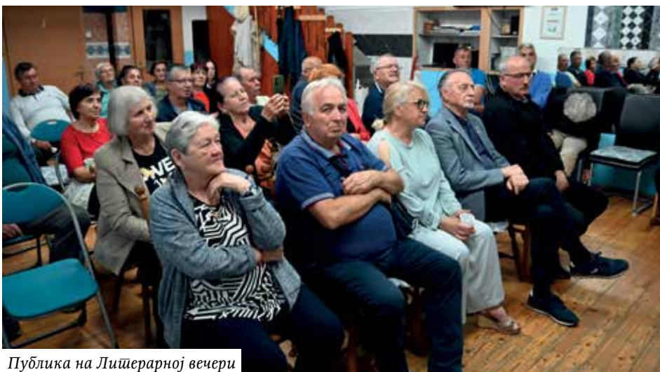
Публика на Литерарној вечери