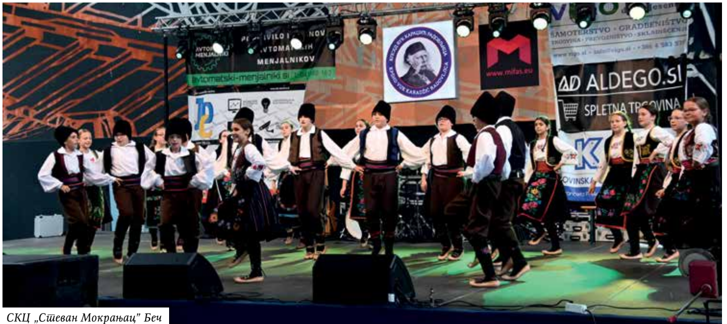
СКЦ „Стеван Мокрањац“ Беч