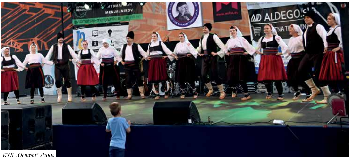
КУД „Острог” Личи