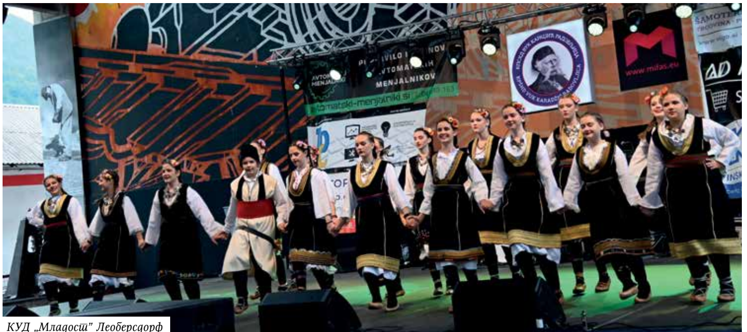
КУД „Младоси“ Леоберсдорф