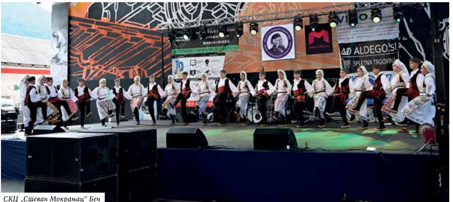
СКЦ „Стеван Мокрањац“ Беч