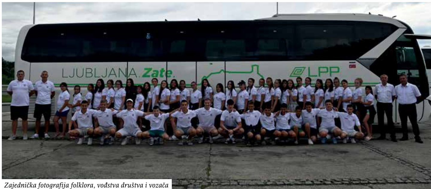
Zajednička fotografija folkloru, vođstva društva i vozača