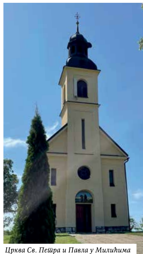
Црква Св. Пејтра и Павла у Милићима

изведбама најмлађе секције, а затим и брижљиво одабраним рецитацијама, које подсећају на блиставу лепоту и поетску снагу српског језика. Показало се и овом приликом да та лепота зари посебном снагом када је озвуче дјеца, чије креације тако лијепо пријањају уз мелодију матерњег језика.