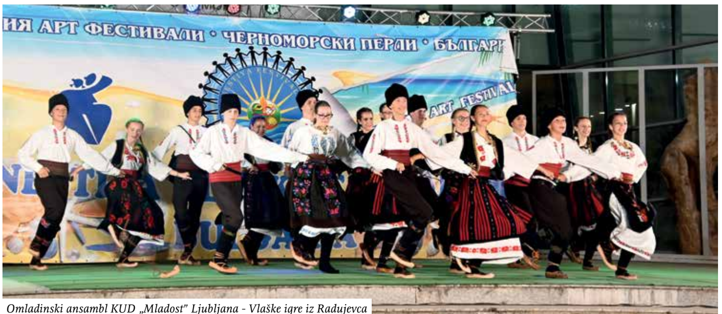
Omladinski ansambl KUD „Mladost” Ljubljana - Vlaške igre iz Radujevca