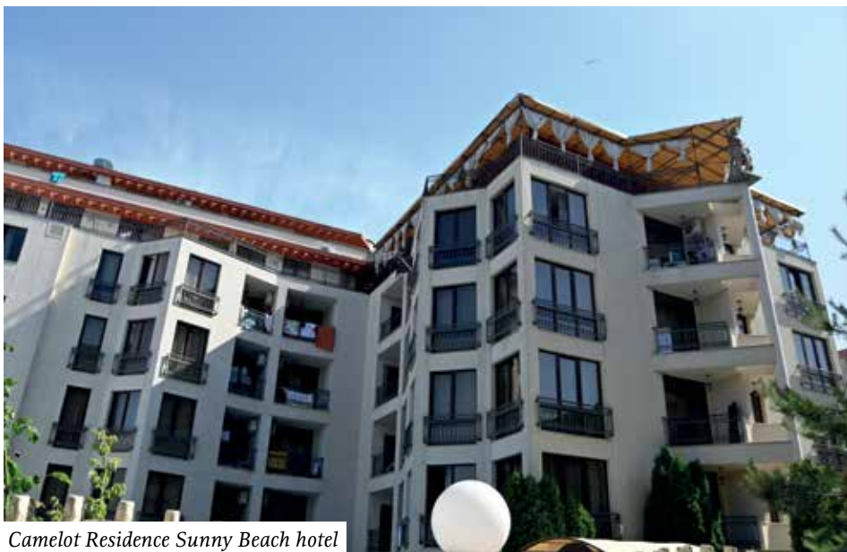
Camelot Residence Sunny Beach hotel

Na daleku put krenuli smo u srijedu, 26. juna 2024. oko pola dva popodne,