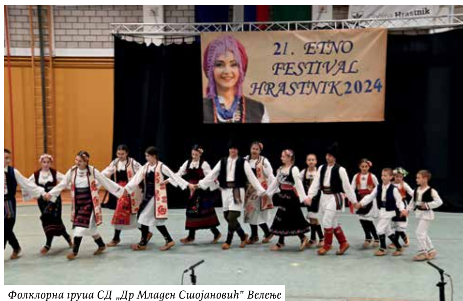
Фолклорна група СД „Др Младен Стојановић” Велење

Представљајући извођачки ансамбл Српског културног друштва „Марибор” речено је следеће: „У програму вечерас видели смо њихов ветерански ансамбл а ускоро ће нам се представити и извођачки СКД „Марибор”. Друштво се већ 25 година успешно труди да у духу међукултурног дијалога сачува језик, традицију и културу српског народа који живи у Словенији. Мисија друштва је стварање додатне вредности у култури која се не мери у материјалном смислу, већ у срећи и задовољству својих чланова. Не штедимо дланове за ансамбл који ниже многе успехе, а највећи међу њима је Златна плакета на Европској смотри 2018. Уживајте у играма Врањског поља.”