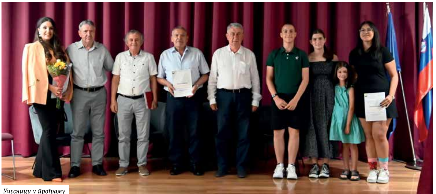
Учесници у програму