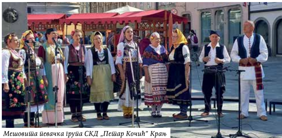
Мешовита певачка група СКД „Петар Кочић” Крањ