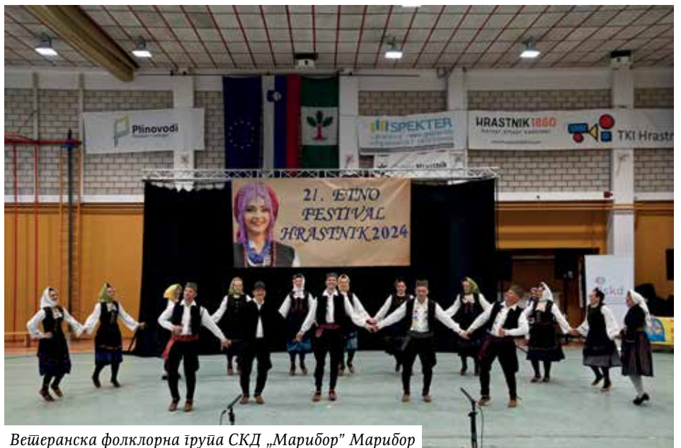
Ветеранска фолклорна група СКД „Марибор” Марибор

нисмо дозволили да песма оде у заборав, прикупили смо материјал, теренске