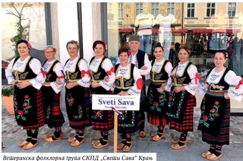
Вешеранска фолклорна група СКПД „Свети Сава” Крањ