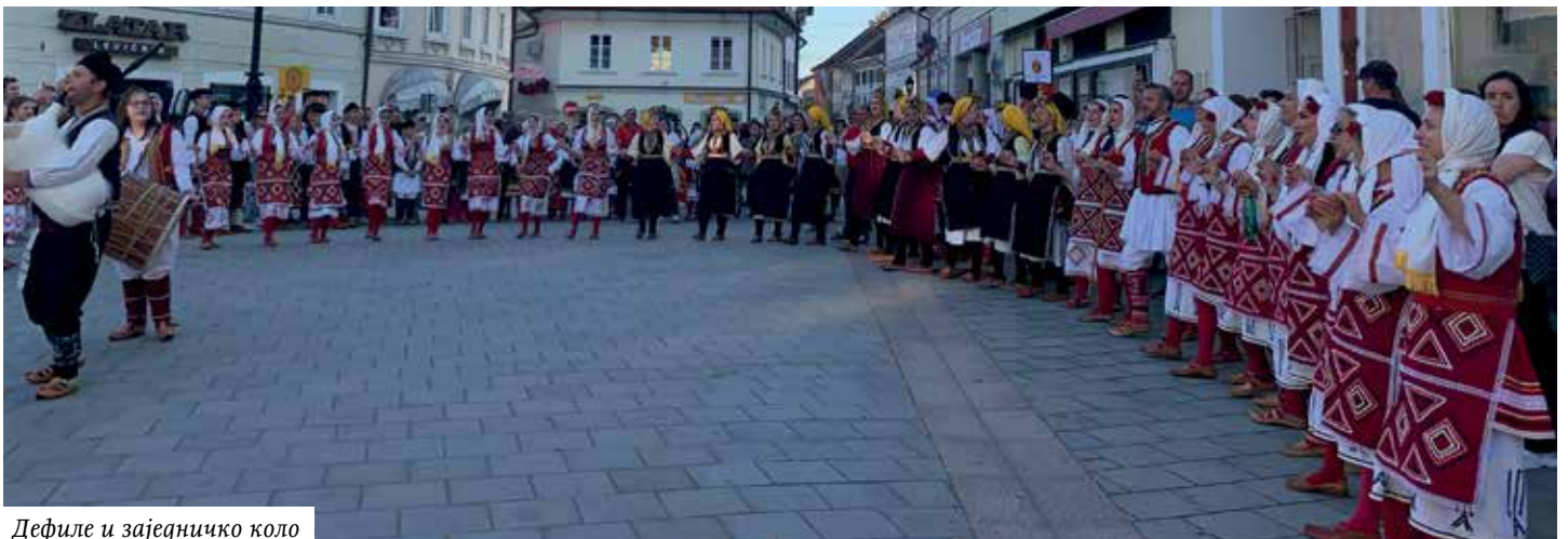
Дефиле и заједничко коло