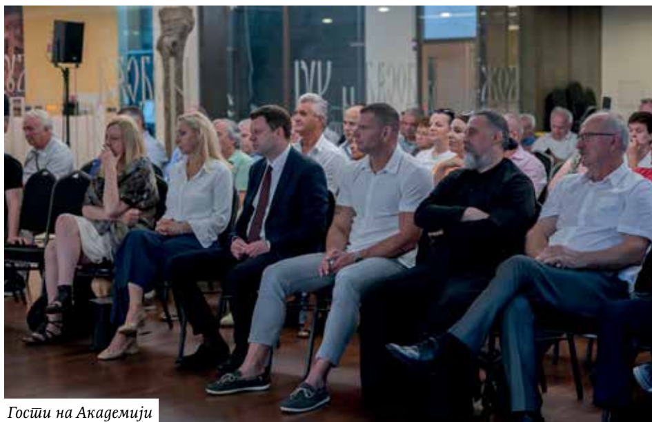
Гости на Академији