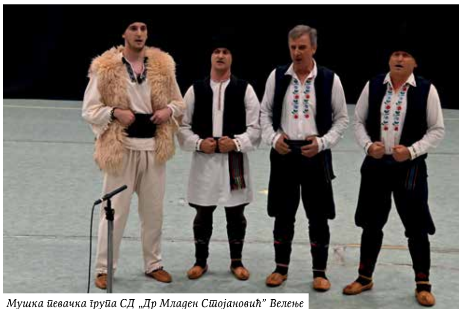
Мушка певачка група СД „Др Младен Стојановић” Велење

је фолклорни ансамбл извео кореографију „Игре из Грузе”.