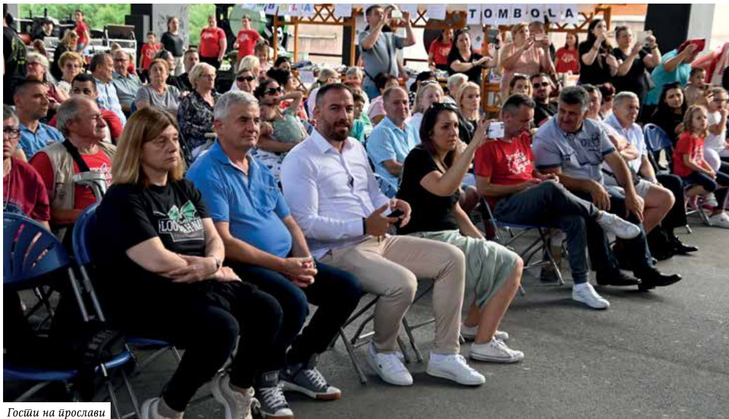
Госћи на прослави

Мокрањац“ Беч: „Игре из Шумадије“. Културно умјетничко друштво „Младост“ Љубљана: „Влашке игре из Радујевца“.