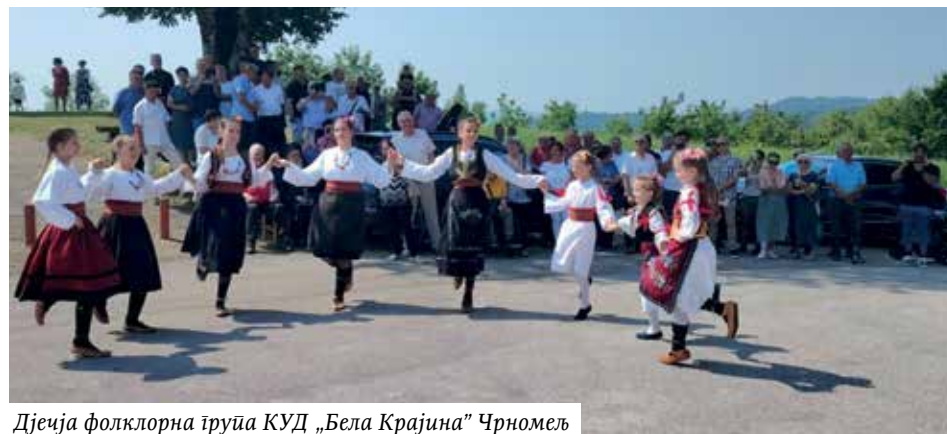
Дјеца фолклорна трупa КУД „Бела Крајина” Чрномел