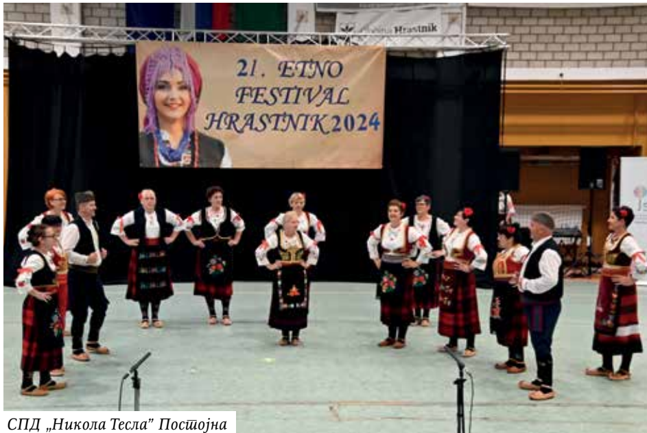
СПД „Никола Тесла” Постојна

У овом делу Етно фестивала први су на сцену изишли чланови ветеранске фолклорне групе Српског просветног друштва „Никола Тесла” из Постојне