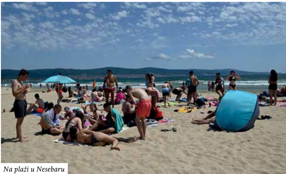
Na plaži u Nesebaru

postavljena takođe u parku. Ove večeri učestvovalo je više folklornih grupa i to su: Zespół Piesni i Tańca, „CHORZÓW” (HOŻÓV), Poljska; „Serpanok”, Lavov i „Namisto”, Hmeljniski, Ukrajina, Ansambl „Momavali” Tbilisi, Gruzija KUD „Izvor” Stari Banovci, i KUD „Kupinik” Kupinovo, Pećinci, Srbija, kao i KUD „Mladost” Ljubljana sa omladinskim i pripremnim ansamblom.