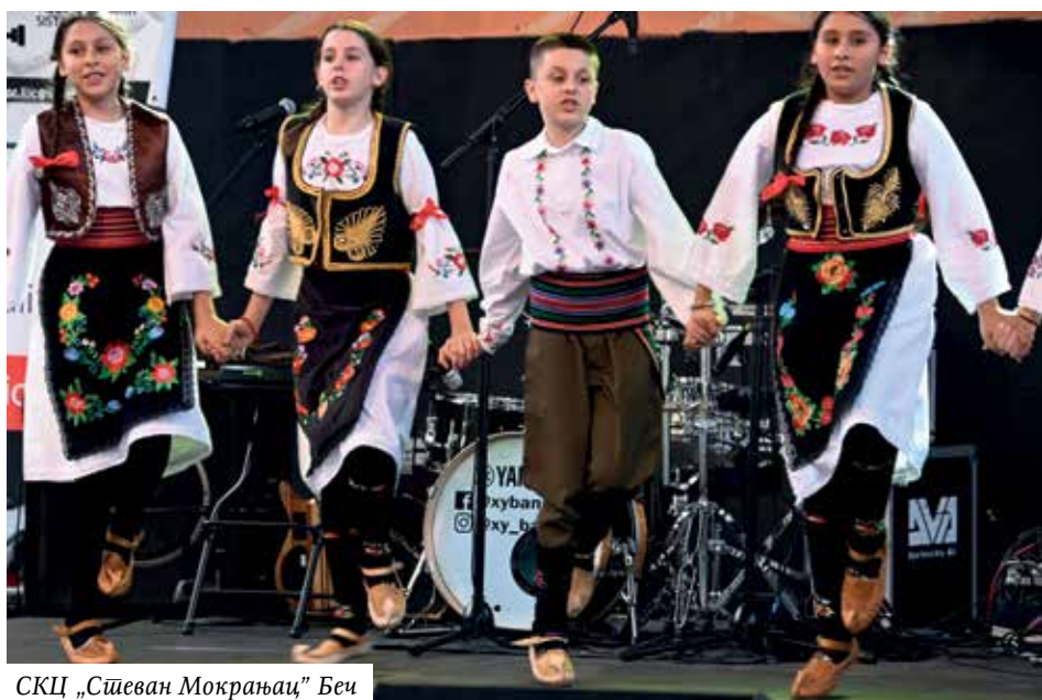
СКЦ „Стеван Мокрањац“ Бео