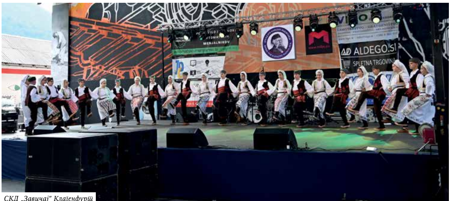
СКД „Завичај“ Клајенфурт