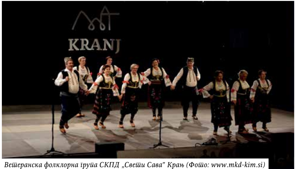
Ветеранска фолклорна група СКПД „Свети Сава” Крањ