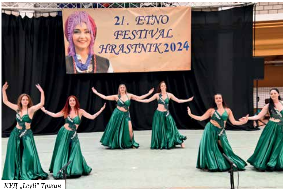
КУД „Leyli” Тржич

записе, учили на семинарима, а то певачко богатство наши момци вечерас деле са вама.”