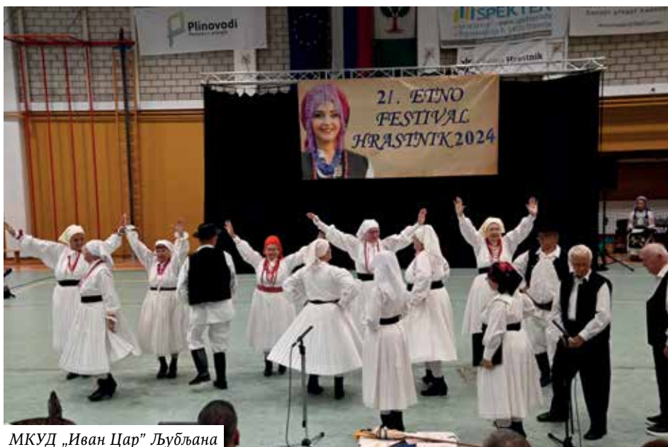
МКУД „Иван Цар” Љубљана