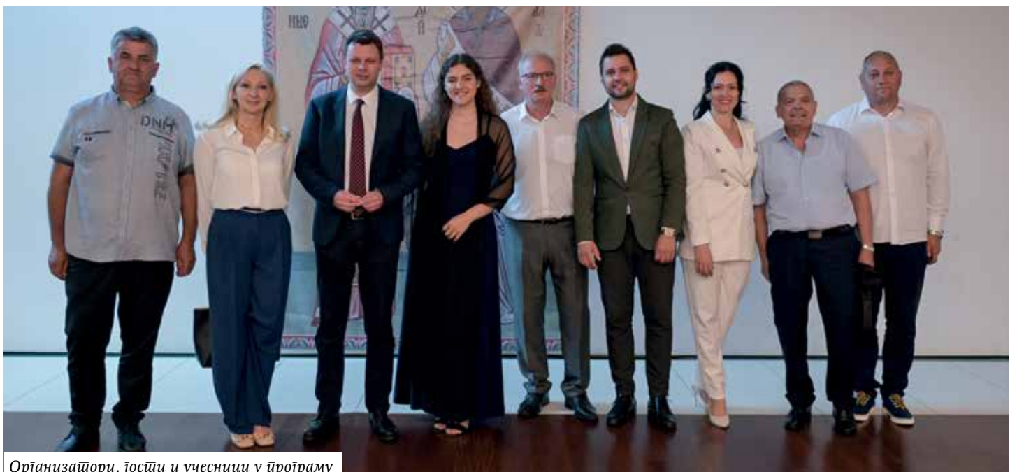
Организатори, гости и учесници у програму

Текст: Златомир Бодирожа