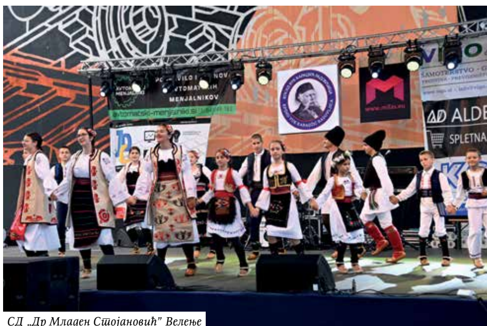
СД „Др Младен Стојановић“ Велење