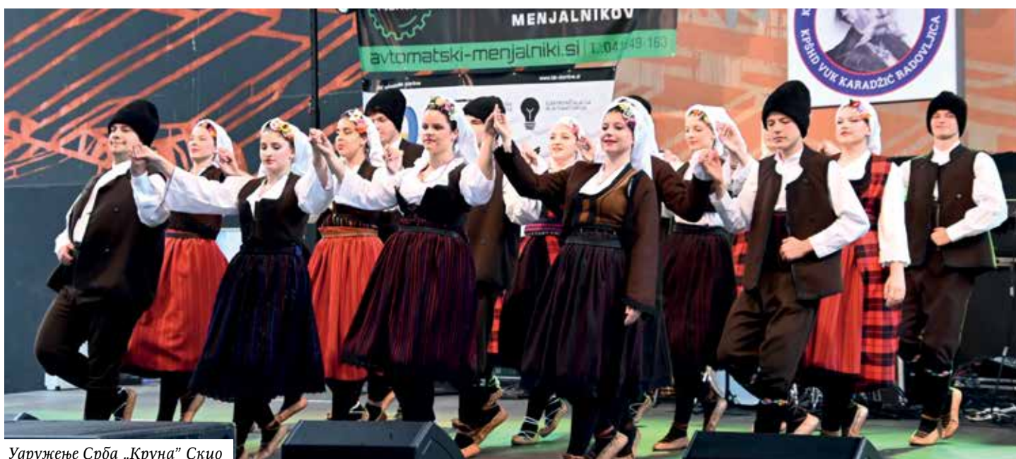
Удружење Срба „Круна” Скио