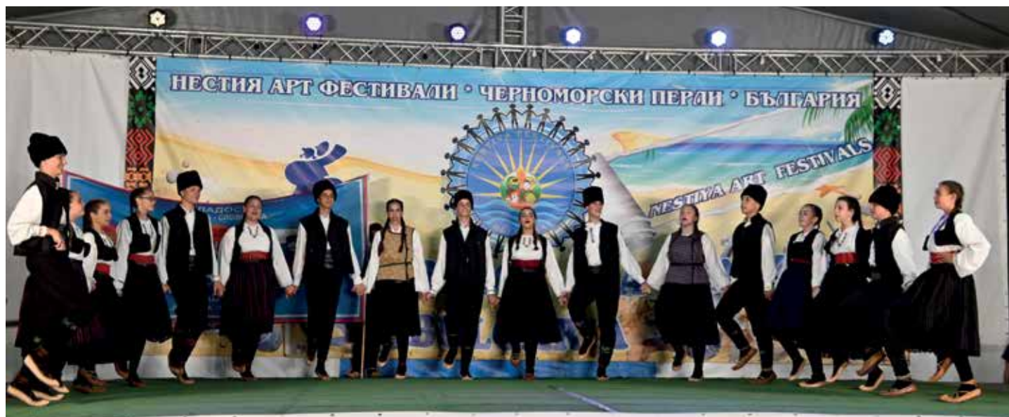
Omladinski ansambl KUD „Mladost” Ljubljana - Igre iz Vladičinog Hana

Vlas, a publika je izvođače pratila iz parka koji je odmah uz binu.