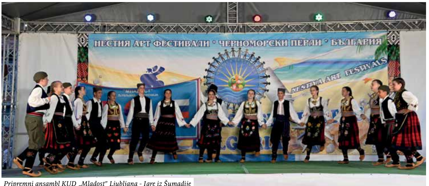
Pripremni ansambl KUD „Mladost” Ljubljana - Igre iz Šumadije

da zamijenimo evre u leve, a onda otišli do plaže, koja se nalazi oko petnaestak minuta pješačenja od hotela. Plaža pješčana, pijesak do gležnjeva, na nju se nadovezuju druge plaže „Sunčanog brijega”, do beskraja. Nešto zaista veličanstveno.