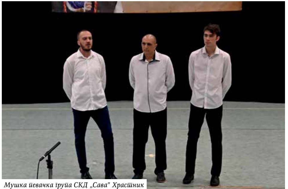
Мушка певачка група СКД „Сава” Храстник

У најави мушке певачке групе Српског културног друштва „Сава” Храстник речено је: „Како наше старе песме на глас и на бас све више тону у заборав, а ми то желимо да спречимо, поред фолклорне оформили смо и певачку групу. Свесни да је у СКД „Сава” српска традиционална песма огроман део нашег народног стваралаштва, којег смо као потомци наших предака наследили и