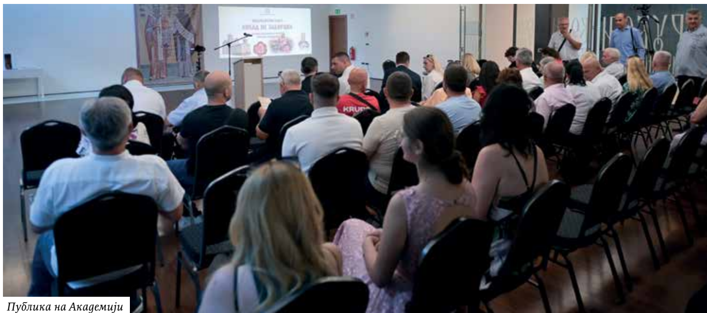
Публика на Академији