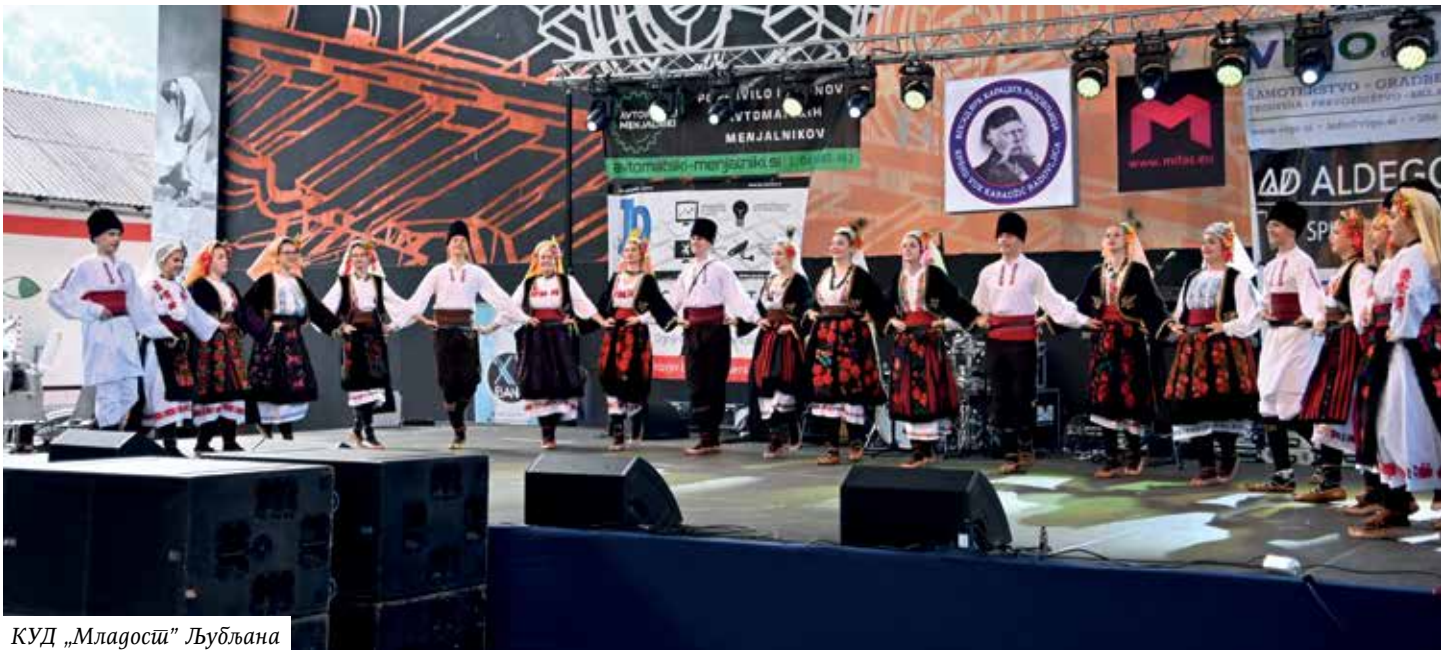
КУД „Младоси“ Љубљана