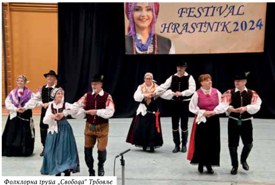
Фолклорна група „Свобода” Трбовље

Српско друштво „Др Младен Стојановић” Велење дугогодишњи је учесник Етно фестивала Храстник, а то је водитељка потврдила овим речима: „Они су од српских друштава редовна група на нашем фестивалу. Упркос томе што се баве различитим професијама спаја их једино љубав према српској култури, љубав према фолклору и љубав према своме друштву. То су доказали многим учешћима и организовањем разних концерата. Своје корене чувају од заборава и млађе веома успешно подучавају о томе одакле долазе. Иза сцене се спрема да запева и заигра СД „Др Младен Стојановић” из Велења.” Прво је Мушка певачка група отпевала неколико песама а затим