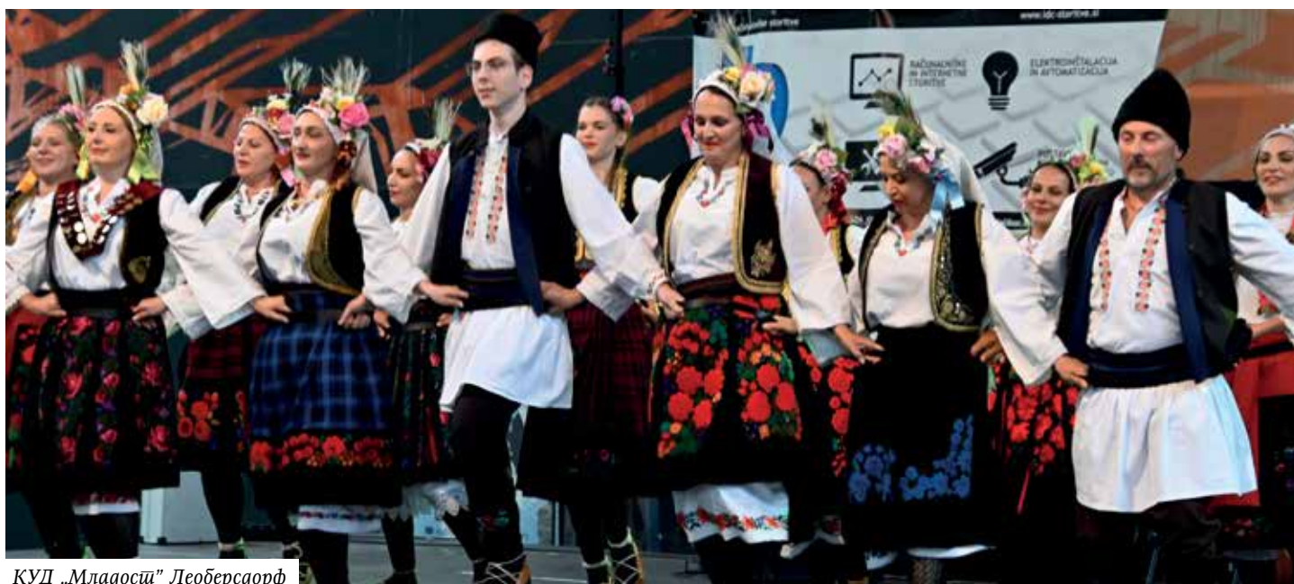
КУД „Младоси” Леоберсдорф