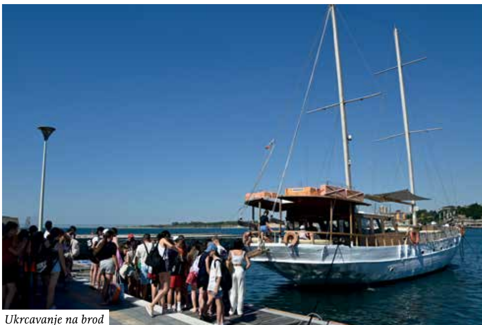
Ukrcavanje na brod

Poslije večere krenuli smo autobusom prema Svetom Vlasu, gdje se održavalo