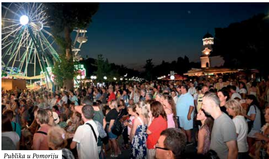
Publika u Pomoriju