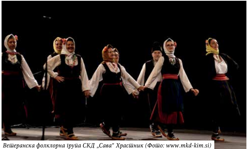
Ветеранска фолклорна група СКД „Сава” Храстник