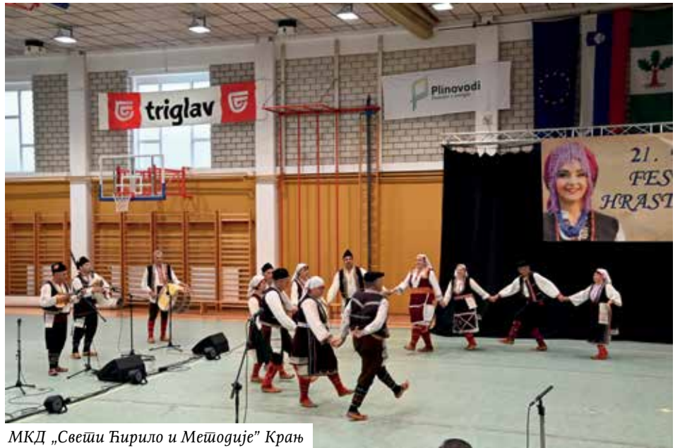
МКД „Свети Ђирило и Методије“ Крањ

Овако је најављена наредна тачка програма: „Увек драги пријатељи и већ редовни гости нашег фестивала, и они су се вечерас одазвали позиву. Поред