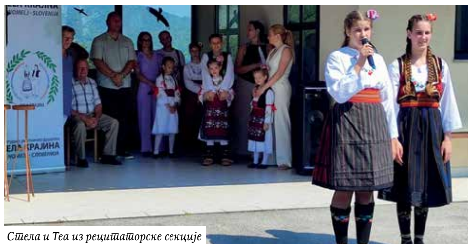
Сћела и Теа из рецитацијорске секције

Аутор текста: гост на Петровданском сабору и пријатељ КУД „Бела Крајина” Чрномел