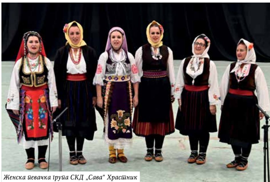
Женска певачка група СКД „Сава“ Храстник