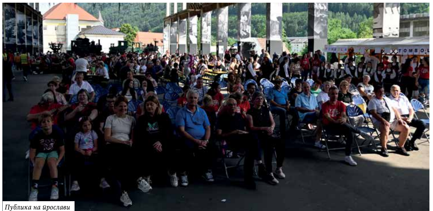
Публика на йрослави