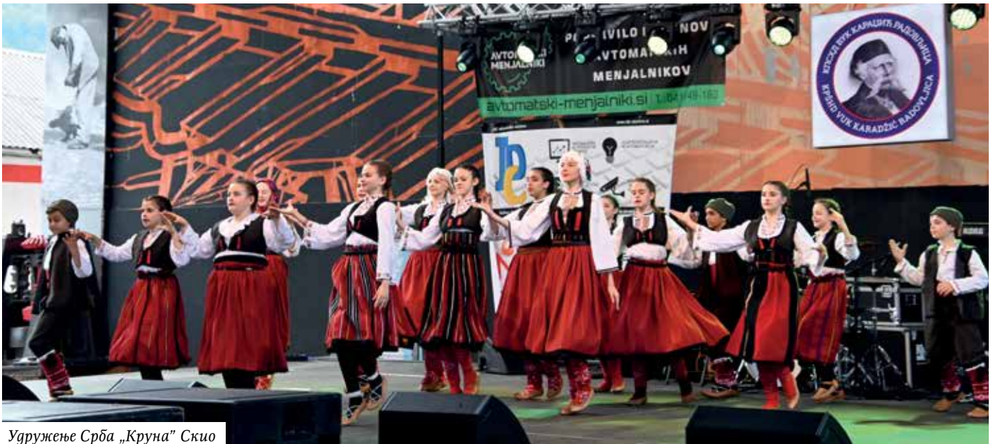
Удружење Срба „Круна“ Скио