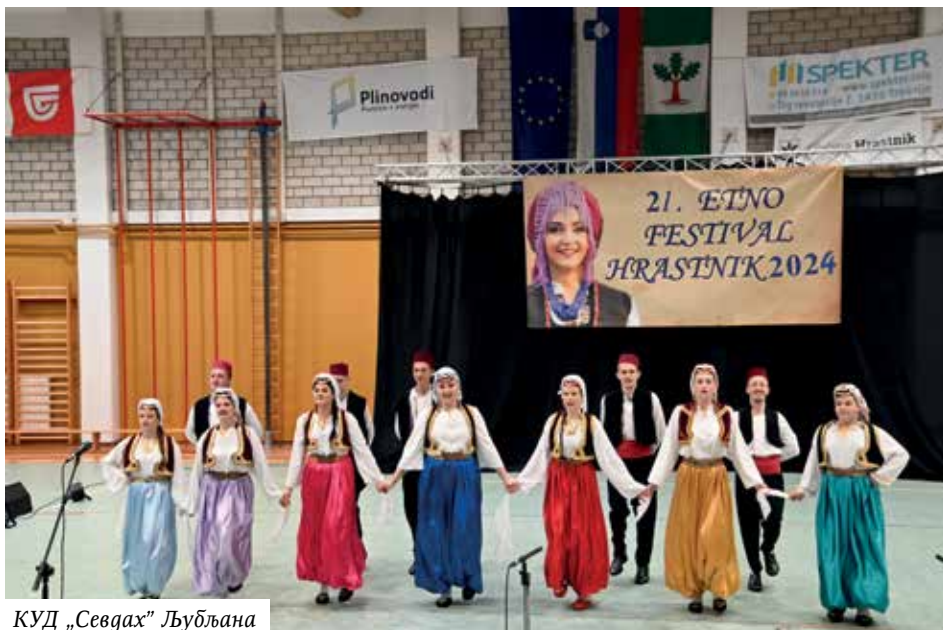
КУД „Севдах“ Љубљана