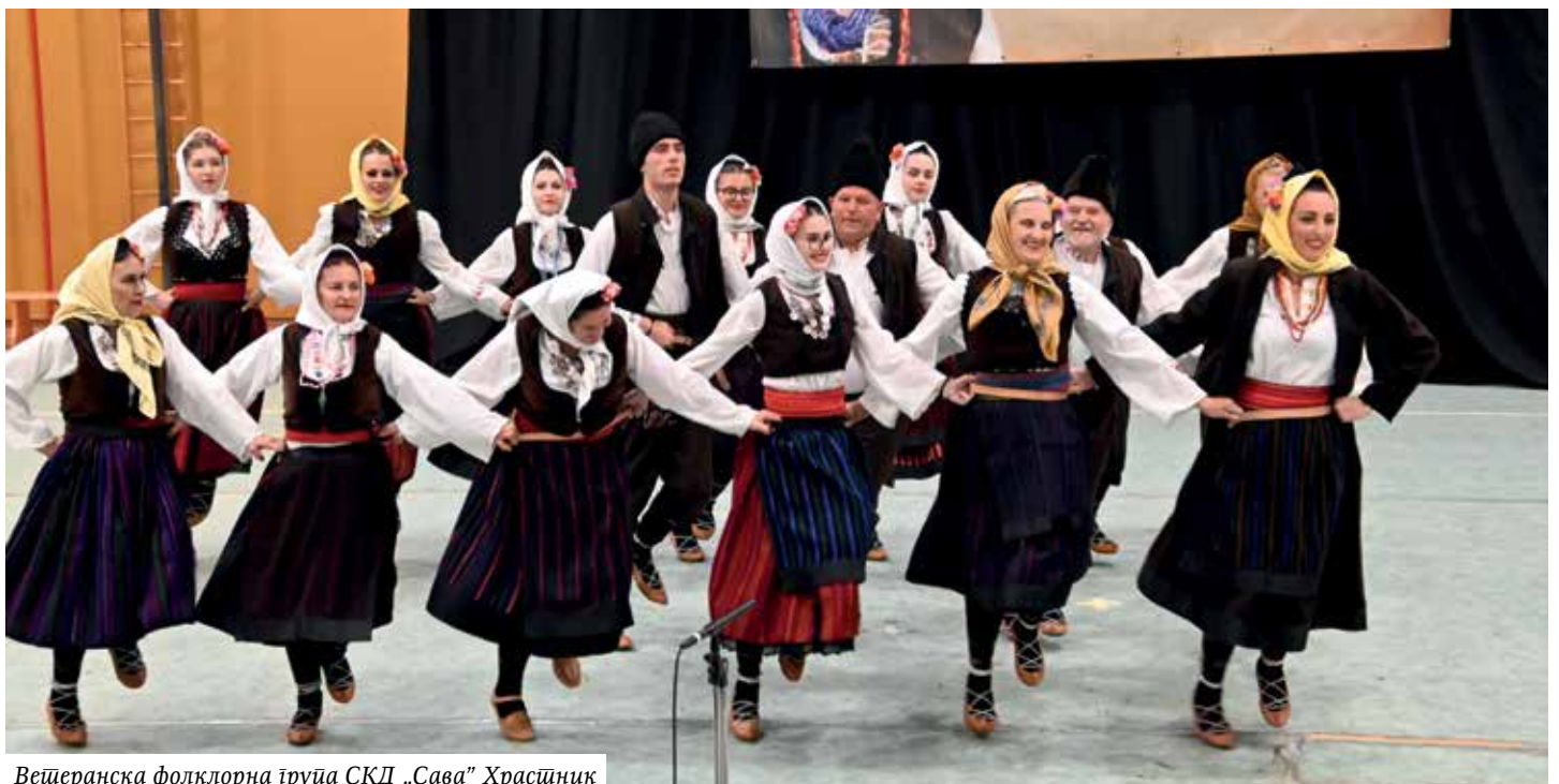
Ветеранска фолклорна група СКД „Сава” Храстник