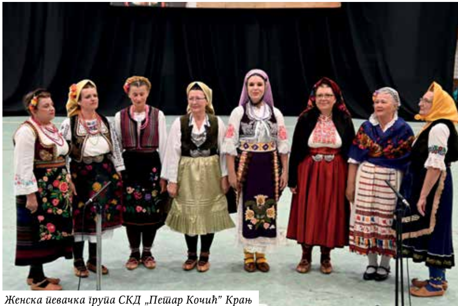
Женска певачка група СКД „Петар Кочић“ Крањ

који не одступају од своје традиције. Заједничком снагом и љубављу према македонским народним играма, они показују македонске обичаје и навике у земљи и иностранству. За вас су одабрали венац македонских игара из источне Македоније. МКД „Свети Ђирило и Методије“ Крањ.“