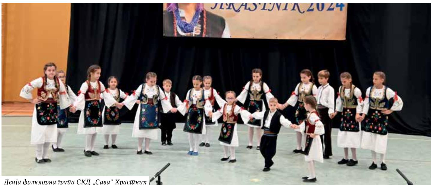
Дечја фолклорна група СКД „Сава“ Храстник

месту, на Етно фестивалу којег организује Српско културно друштво „Сава“ из Храстника. Нисмо одмарали за све