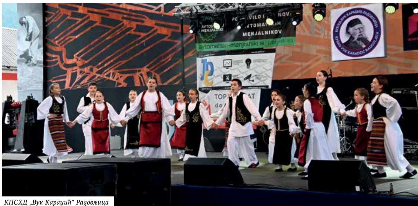
КПСХД „Вук Караџић“ Радовљица