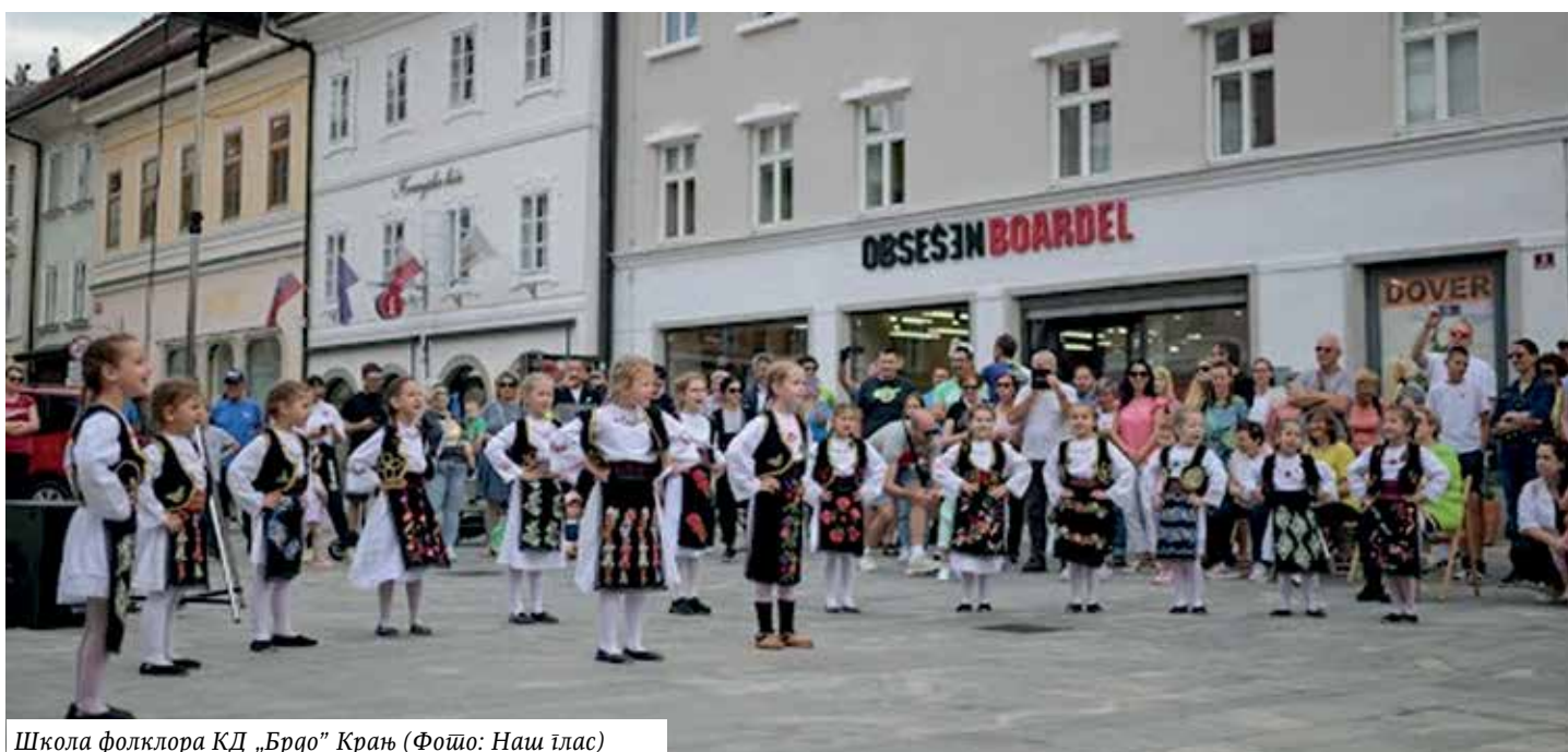
Школа фолклора КД „Брдо” Крањ