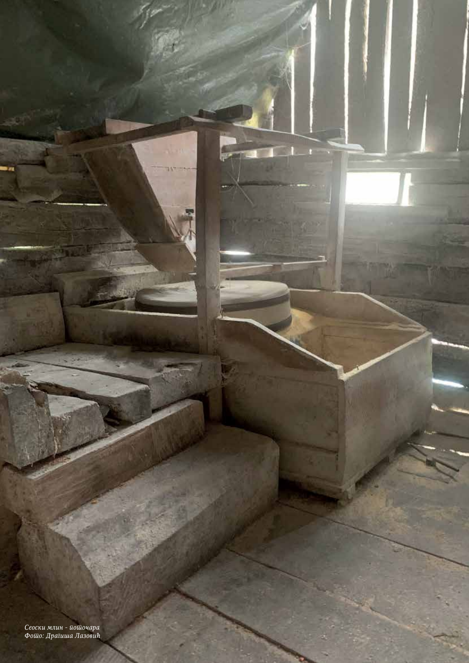
Сеоски млин - пошћара